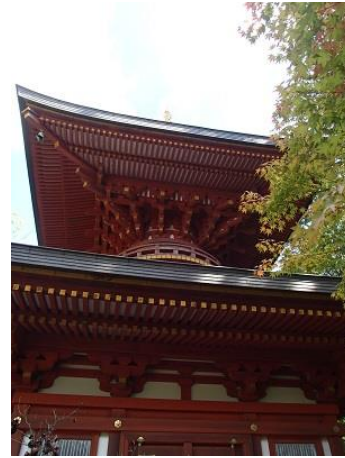
17.円成寺に到着。多宝塔。