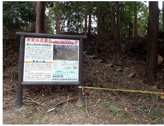
11.残念ながら通行止…orz