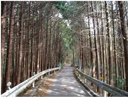
16.少し予定より遅れているのでペースアップ！