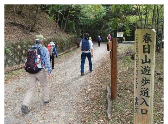
6. 滝坂の道が通行止なので春日山遊歩道を歩く