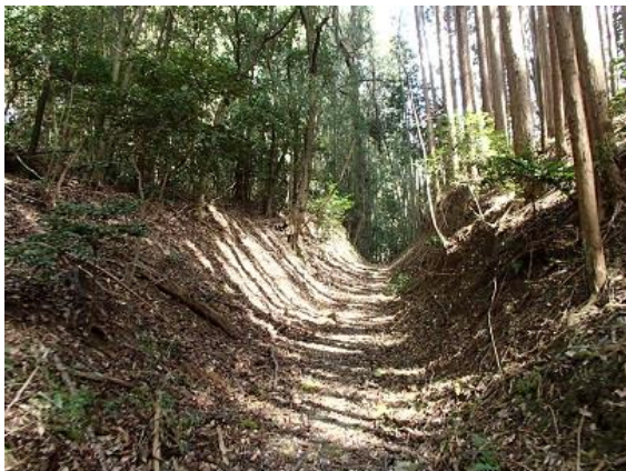
19.柳生街道の剣豪の道