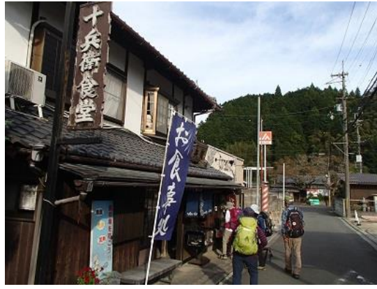
29.ゴールの柳生バス停に到着！バス停前の十兵衛食堂へ。