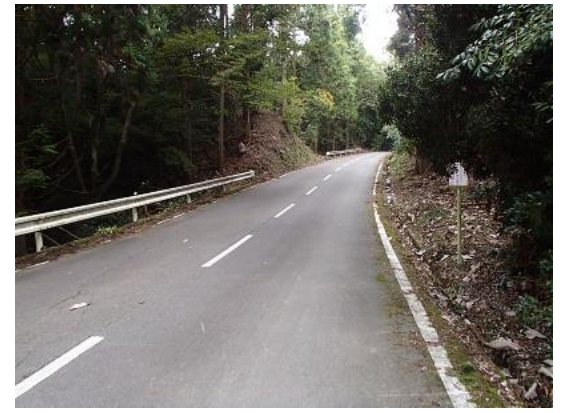
12.仕方なくドライブウェイを歩いて迂回