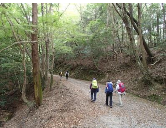
7. 静かな春日山遊歩道