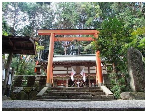
20.夜支布山口神社でお祭りをしていました