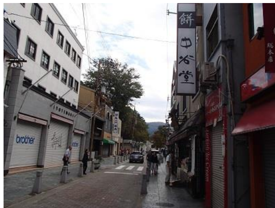
2. 高速餅つきの店の前を通過