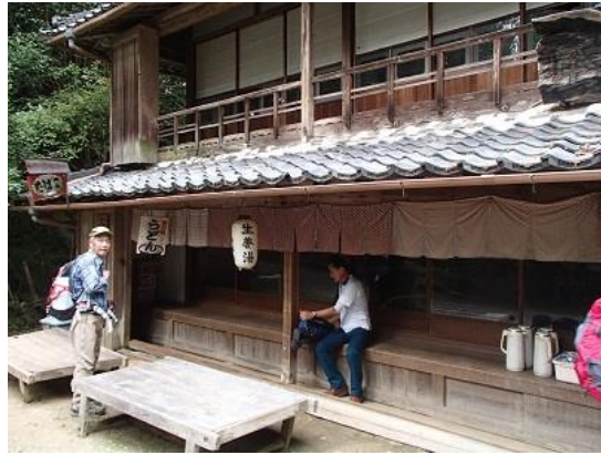
14.峠の茶屋でお昼にしました