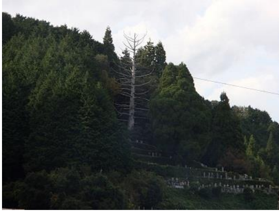
28.十兵衛杉。樹齢 350 年。2 度の落雷で現在枯れています。