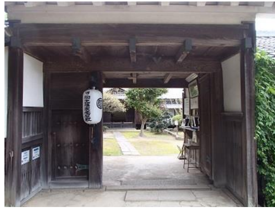
26.旧柳生藩家老屋敷。中には入っていません。