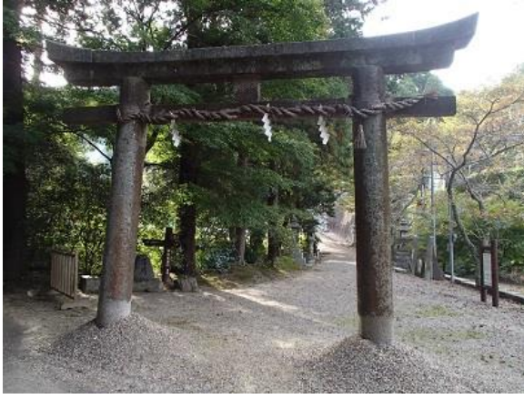
25.柳生八坂神社。ゴールは近い。