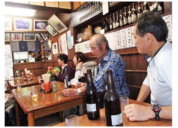
30.皆さん、よく歩きました！お疲れ様！