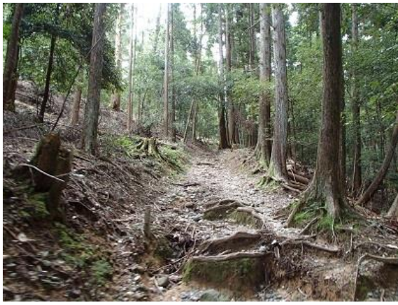
10.地獄谷石窟仏を目指して地獄谷園地を進むも…