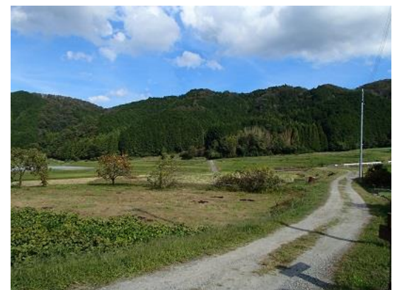
21.大柳生の里が一望