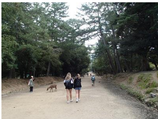
4. 奈良公園に入りました