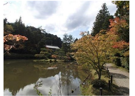
18.円成寺の美しい庭