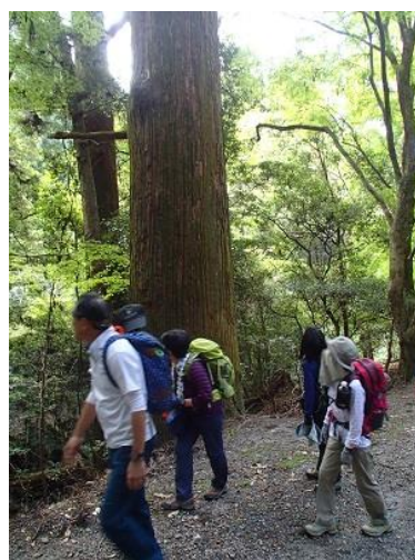
8. 立派な杉の木。さすが原始林。