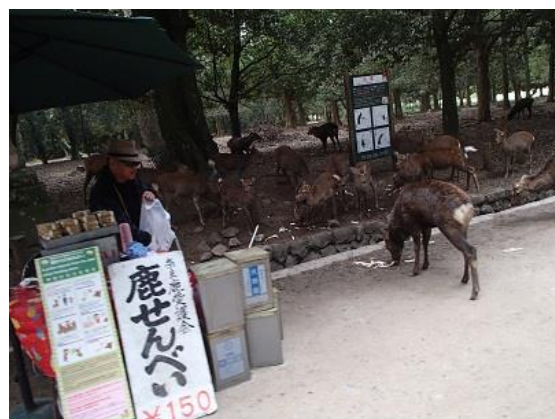
5. パンの耳で鹿を集めてる鹿せんべい屋の親父