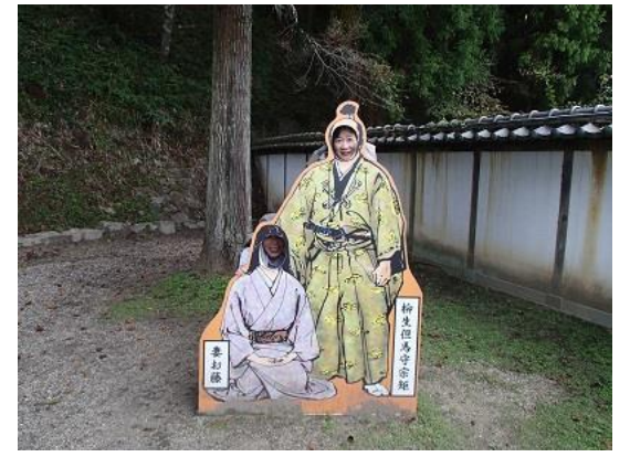
27.お約束。宗矩とお藤。