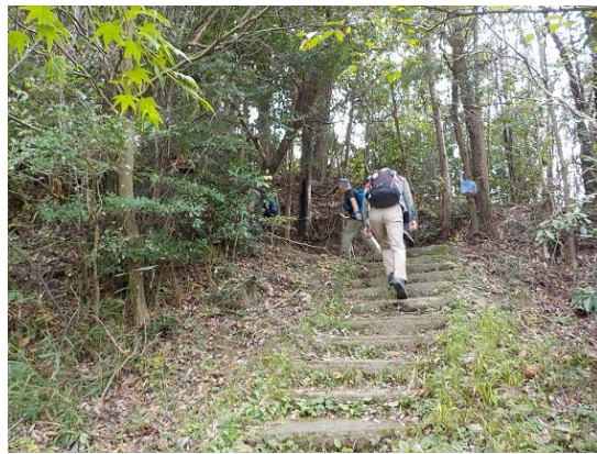
2. 緩やかな階段状の登山道を進む