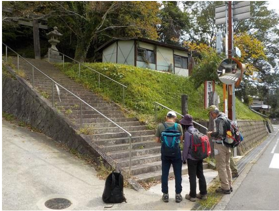
1. 忍頂寺バス停近くの石段を登る

キリシタン自然歩道から竜王山を経て阿武山へ行く予定であったが、時間的にきつことが当日判明して、忍頂寺までバスで行き、竜王山から摂津峡へ抜けるルートに変更した。しかし、竜仙峡経由で行くはずが、道を間違っしまい車作集落へと下山することになってしまった。今回は初めから気合いが入ってなく、行き当たりばったりの安易な山行となったが、気楽な山行として楽しめた。