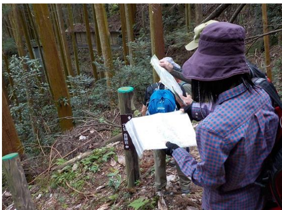
10. どうもこの辺りで道を間違ったようだ