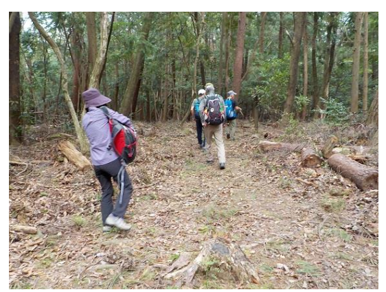
9. 静かな樹林の中を進む