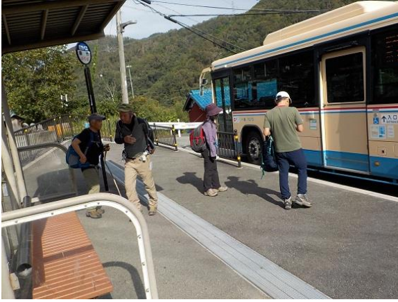
16. 車作バス停から茨木駅へと向かい、今回の軟 弱山行は終了した。 そしてこの後、茨木駅前で一軒、それから十三 へと遠征して十分すぎる反省会を行なった