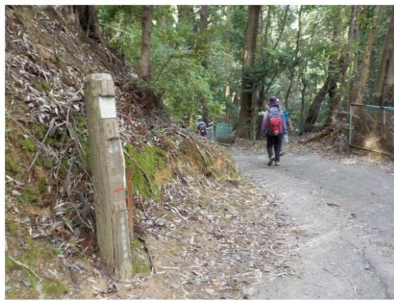
14. そして、そのまま進むことに