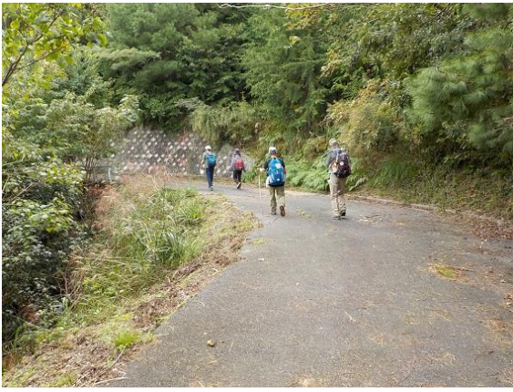
13. 林道に出た。この時点で間違いは分ったが 引き返すのは面倒だという日和見に負けて しまった