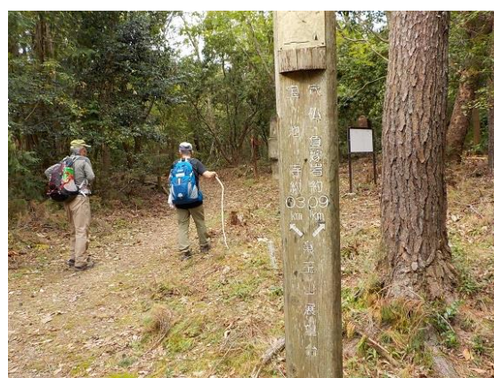
8. 展望台でランチを済ませ竜仙峡へと向かう