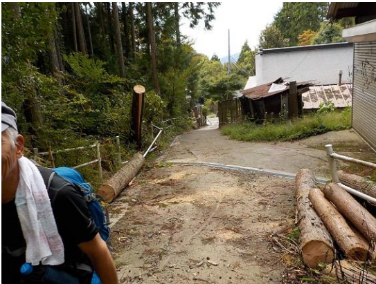
4. 宝池寺を過ぎ、また樹林の中へ