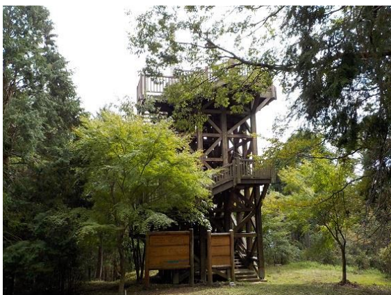
7. 頂上には巨大な木製展望台がある