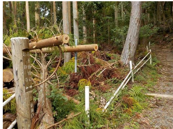
5. 台風による倒木があちこちに