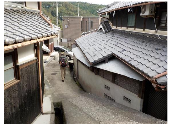
15. 結局、車作集落へと下りて、そのまま帰 ることとなった