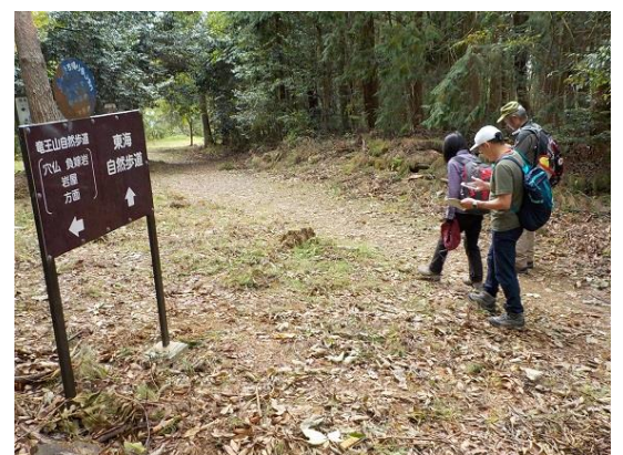
6. 竜王山頂上に到着 だだっ広いところだ