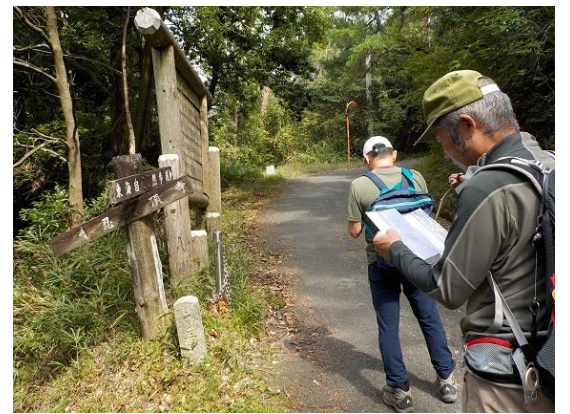
3. 分岐点で現在位置を確認する