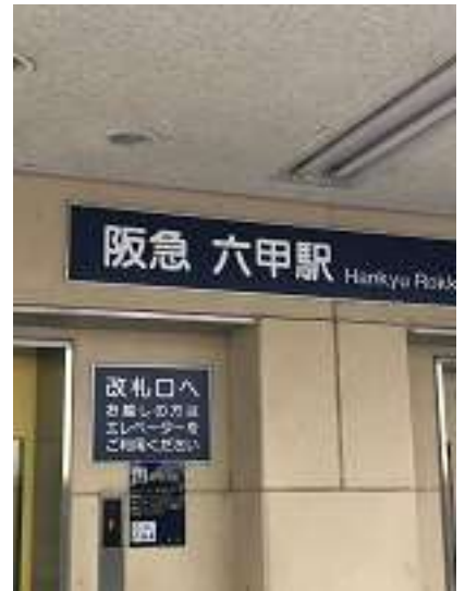
本日のゴール 阪急六甲駅