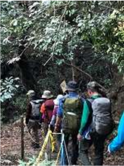
下山は杣谷（カスケードバレイ）