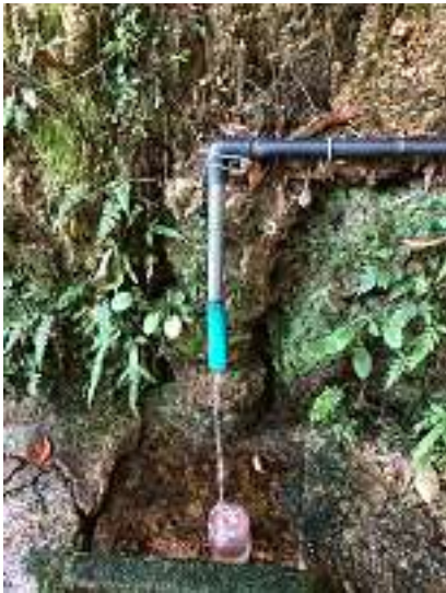
この水は飲めるのだろうか？ コップが置かれているが・・・