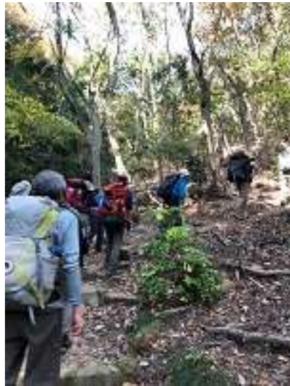
行者尾根の取り付けです