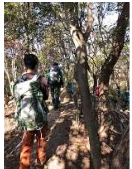
天狗道に入りました