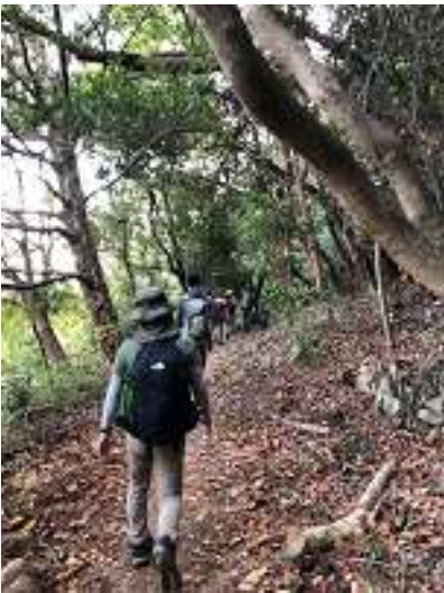
もうじき下山終了ですよ～