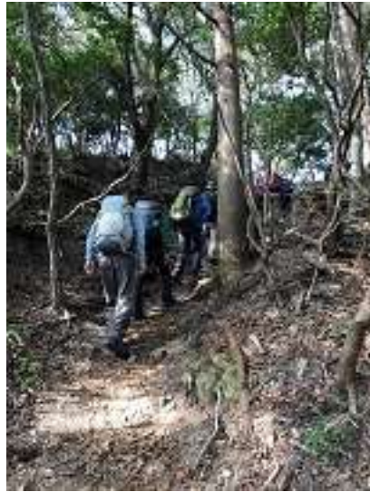
アゴニー坂に向かいます