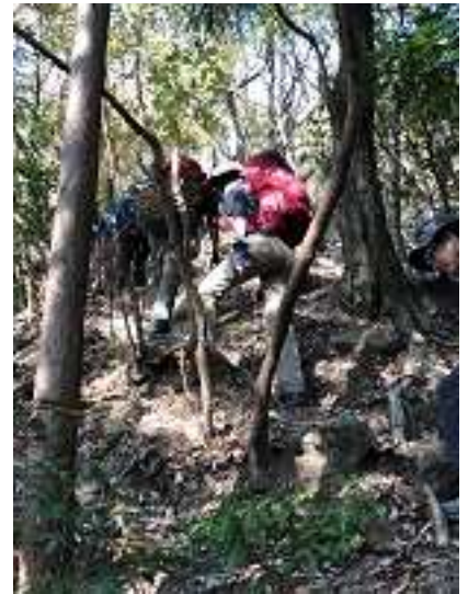
いよいよ行者尾根の岩場