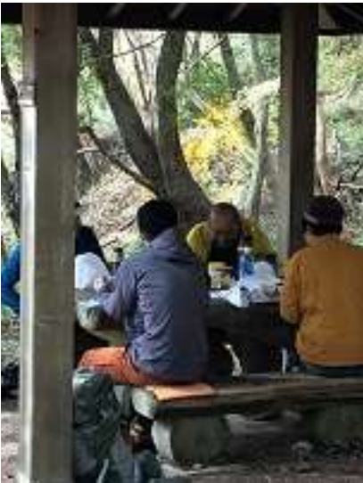
穂高ダムのあるところにある東屋で昼食