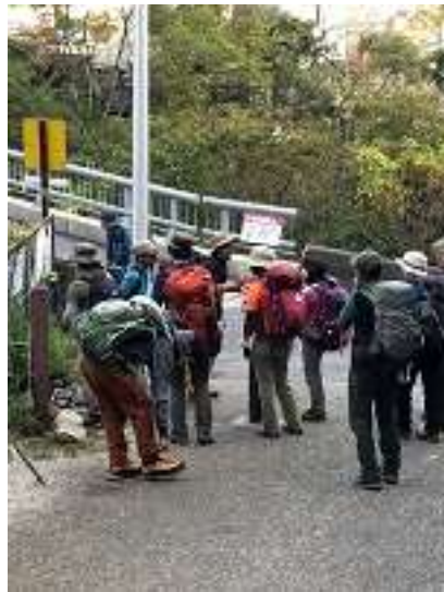
下山してきました