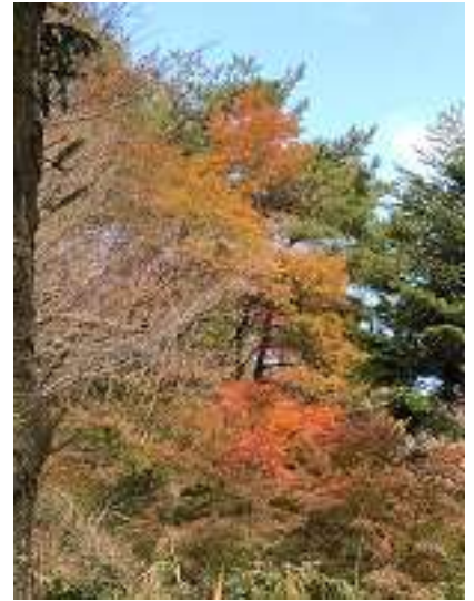
穂高湖周辺の紅葉