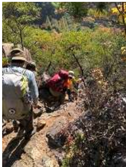
シェール槍を下山