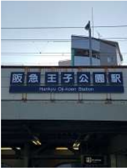
本日の集合場所 阪急王子公園駅