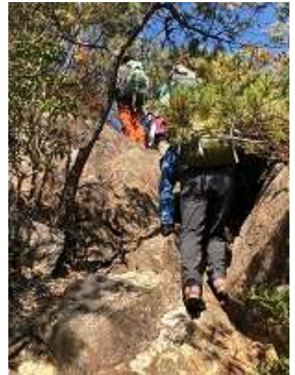
もうじきてっぺん