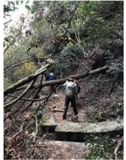
倒木がありました・・・