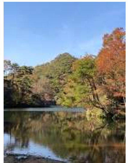
シェール槍と穂高湖