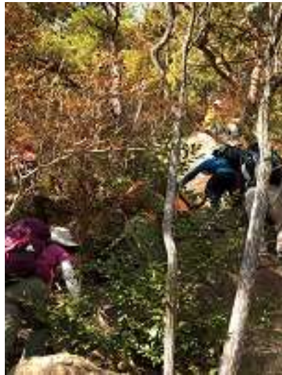
シェール槍を登る