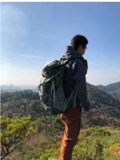
槍の頂点で黄昏るSさん