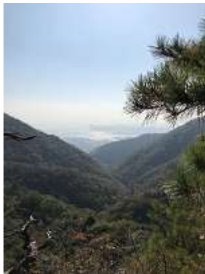
振り返れば神戸の街 ガスって ますなあ～