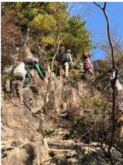
行者尾根で一番危険な場所