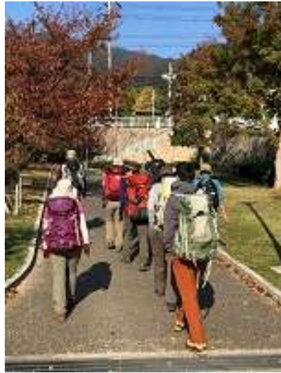
王子公園を抜け、青谷道へ向かいます