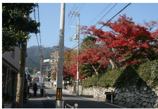
2. 道沿いのカエデが綺麗