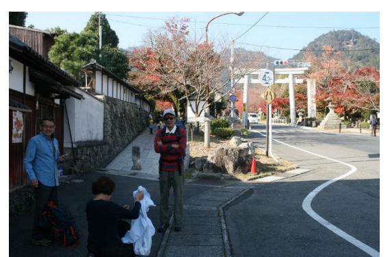
3. 気温が高く、衣服調整する