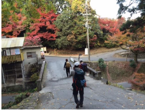
26. 坂本ケーブル駅へと戻ってきた