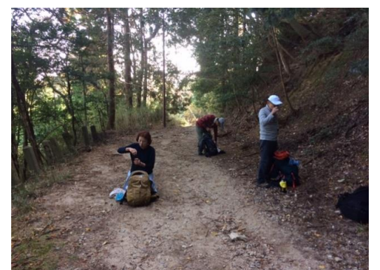
11. ずっとこのような幅広の道だった