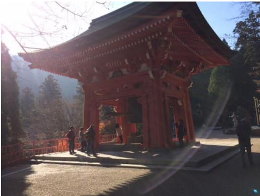
19. 大講堂前にある鐘楼