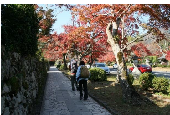
5. 日吉大社までは幅の広い綺麗な道が続く