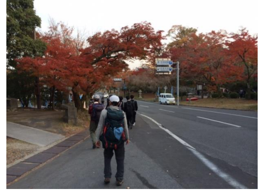
27. そして、坂本駅へと続く紅葉の綺麗な道を進み、今回の山行は終了した