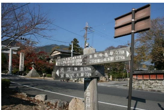
4. 登山口のある日吉大社をめざす