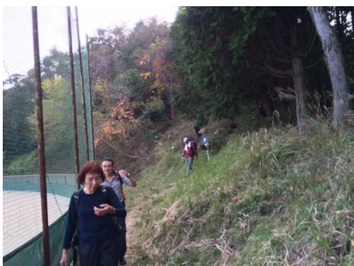
25. 比叡山高校のグラウンド横へと下りてきた