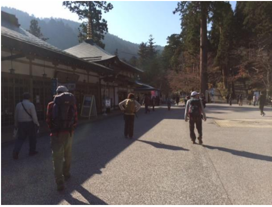
16. 延暦寺境内に到着