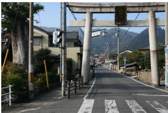
1. 坂本駅から日吉大社へと向かい鳥居をくぐる

紅葉は丁度、坂本駅から比叡山の登山口にある日吉大社までの道沿いのカエデが見頃で綺麗であった。登山道は、登山口から先の道標が少なく、入山後一時迷ったが歩き易い道であった。延暦寺は平日のため思ったほど人は多くなく、根本中堂は保存修理工事中であったが、大講堂などでしばらく参拝してから下山した。この山域も一部だがやはり台風による倒木があり、道を塞いでいた。今回も平日のため静かな山歩きを楽しめた。