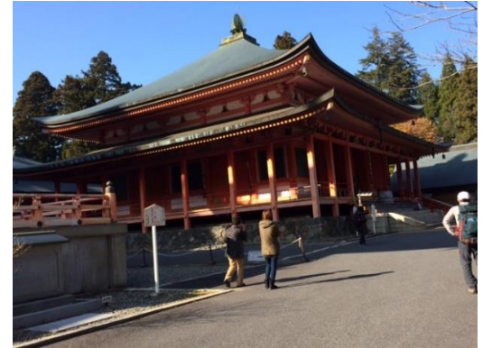
21. 大講堂を後にして下山にかかる