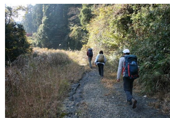
8. 途中、道を間違いすぐに引き返す