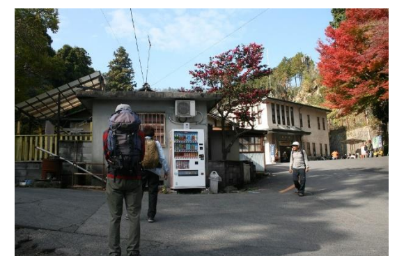
6. 坂本ケーブル駅に到着