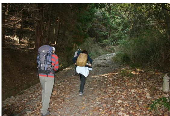
10. 幅の広い登山道が続く