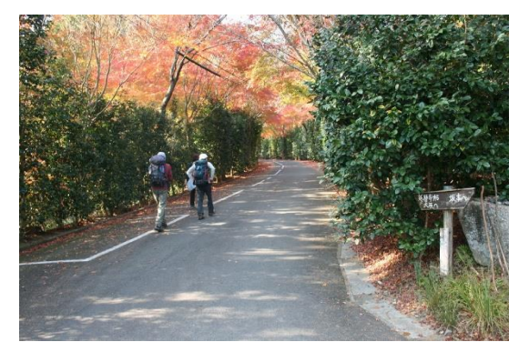
9. またしばらく舗装道を進む