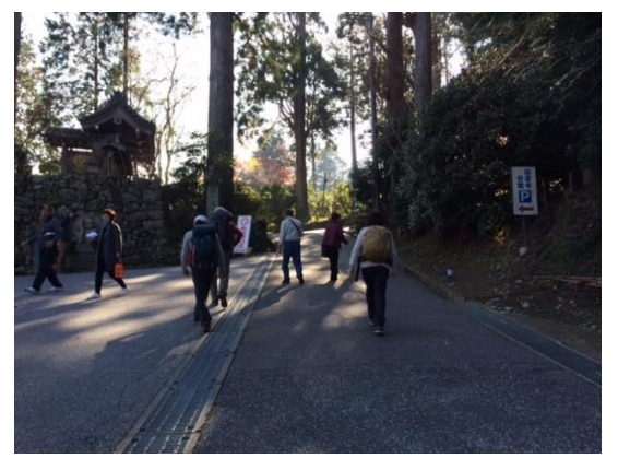
15. 延暦寺会館前に到着