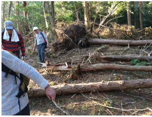
23. 尾根の一部にスギの倒木がまとまってあった