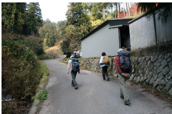
7. ケーブル駅の下側の舗装道を進む