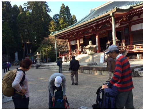
20. 大講堂に入り、お参りした