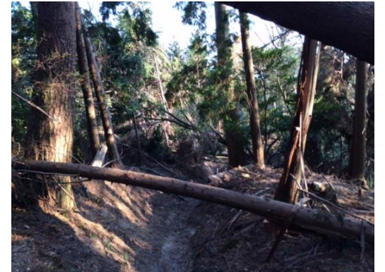
24. そして、倒木は道を塞いでいた