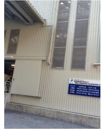
18. 根本中堂は保存修理工事のため、全体を囲われているが、中には入ることができる