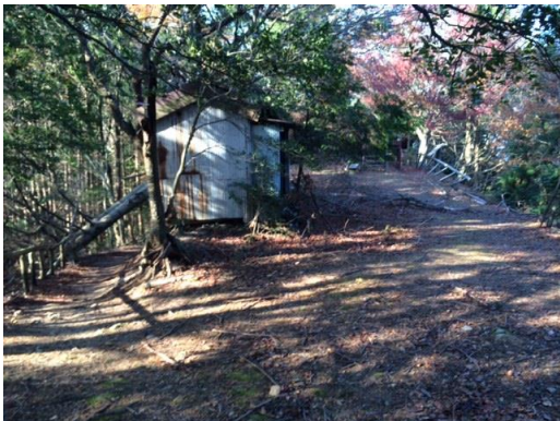
22. 下山はケーブルに沿うような形で伸びる尾根道を下った。途中、何の小屋か廃屋があった