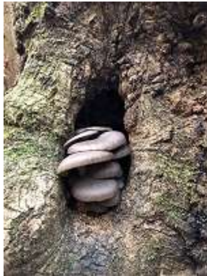
美味しそうなきのこ