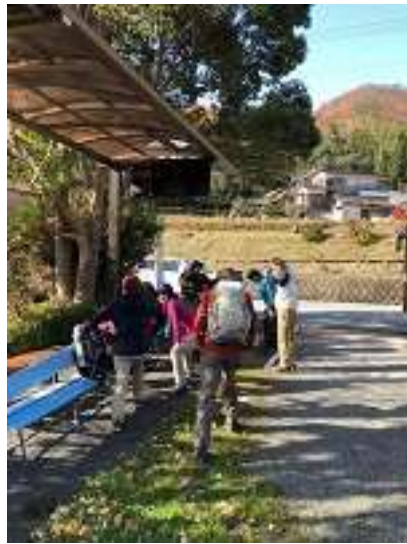
思い思いに準備中