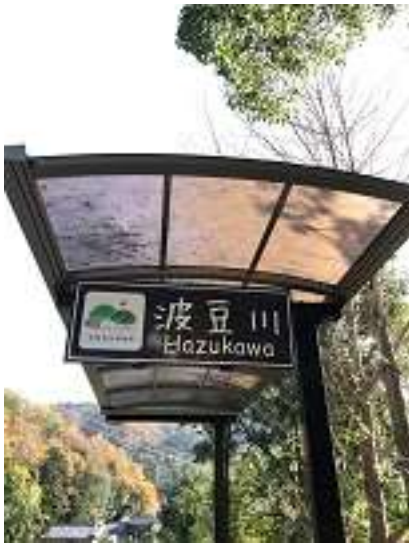
本日のスタート地点&ゴール地点 神姫バス 波豆川バス停