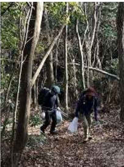
もうじき大船山山頂ですよ～