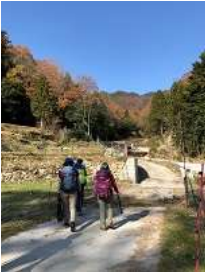
大船山へ クリーンハイクスタート！