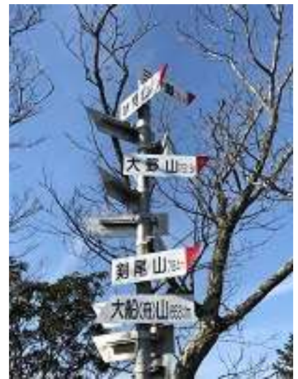
周辺の山々の方位を示す案内 標識がありました