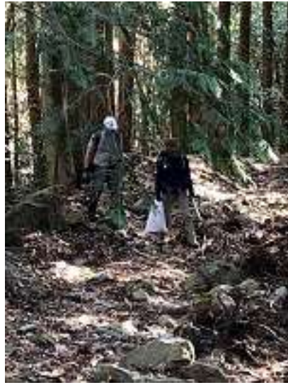
すごく荒れております