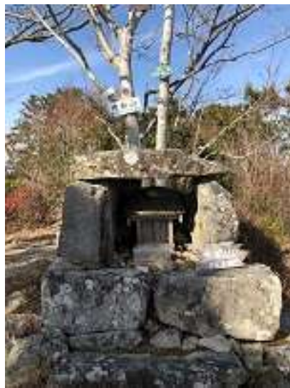
大船山山頂に到着！