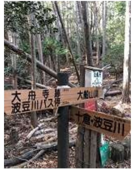
時々綺麗な道標があります