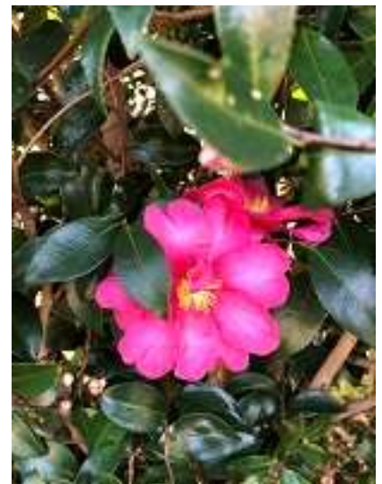
波豆川バス停近くに咲いていま した