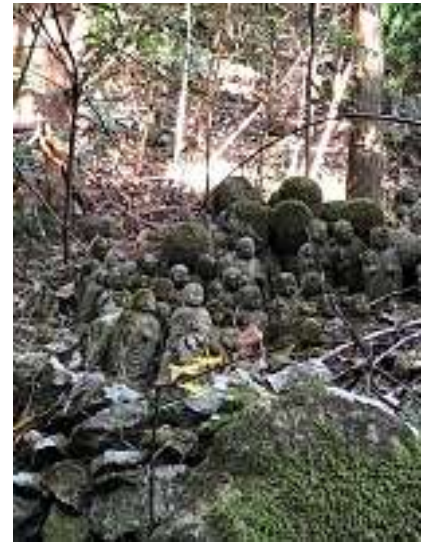
三十三観音だそうです