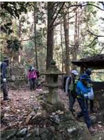
さあ 三十三観音とお別れして、 ラストスパートです。