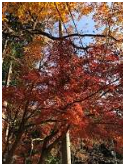
大磯アスレチックの紅葉