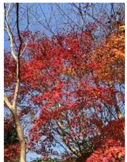
大船山登山口の紅葉 綺麗でしたよ