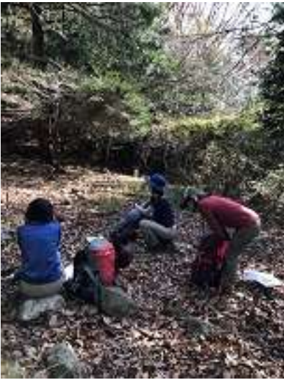
もともとの大舟寺跡地で小休止