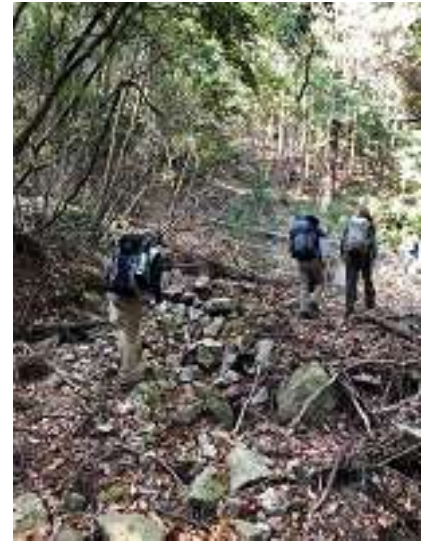
この荒れがしばらく続きます