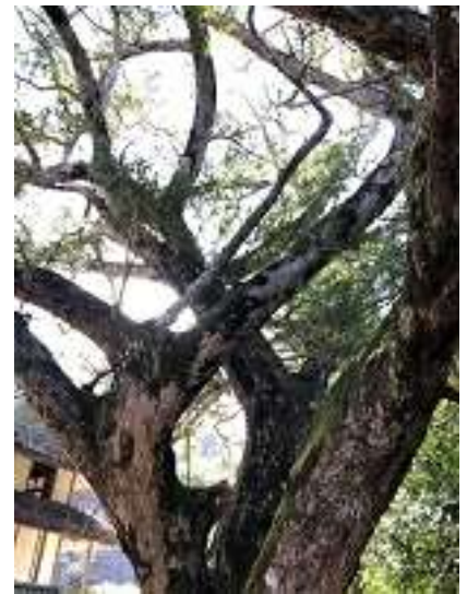
天然記念物 大舟寺のカヤの木