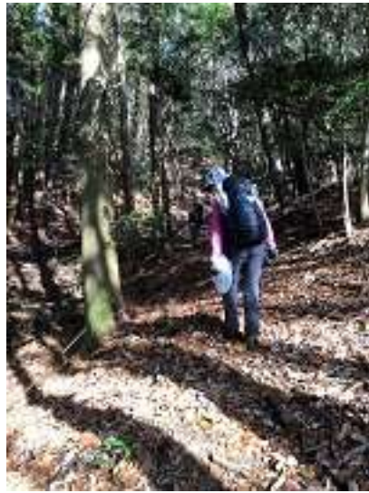
まだまだ続きます