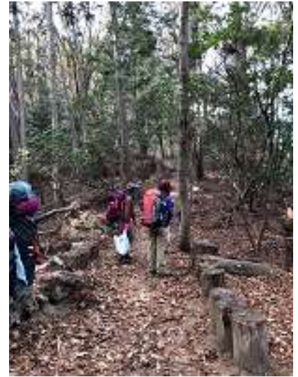
一人来ない人がいる？