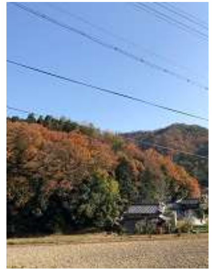
のどかな里山ですこと