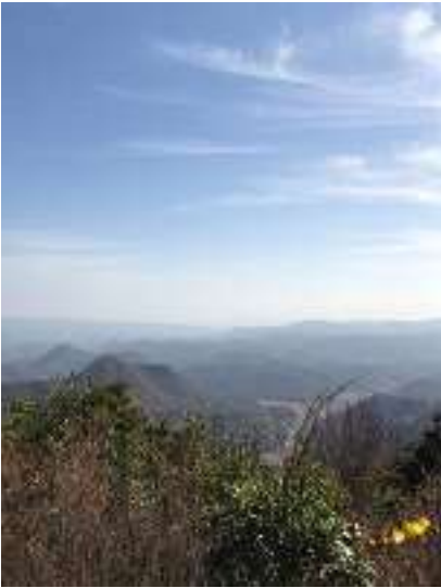
大船山山頂からの眺めです。