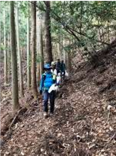
登りの道とは違い、下山した道は 歩きやすい道でした