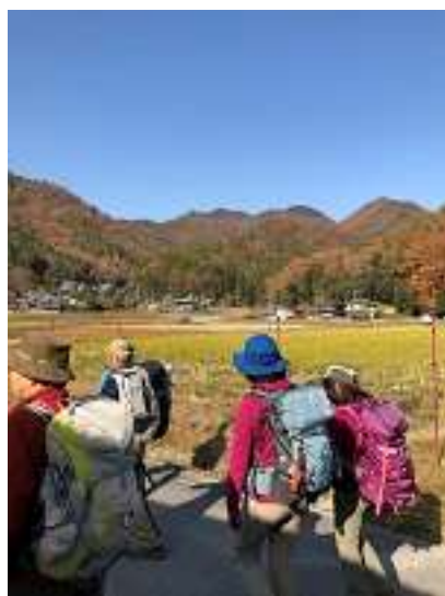
波豆川バス停に戻ります