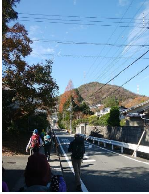
⑩ 縦走路に向かって車道を歩く