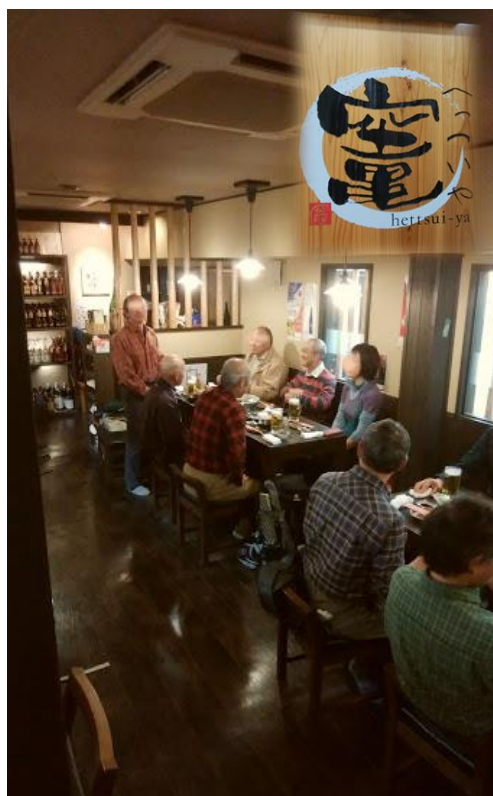
②3 納山会 会長挨拶