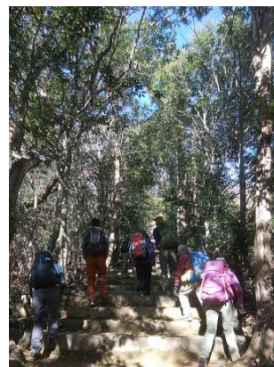
③ 長い階段が続きます