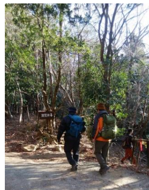
②2 清荒神へ向かって下山