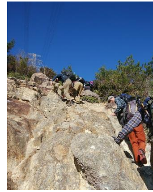
⑭ みんな上手に登っています