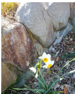
②1 スイセンの花が咲いていた