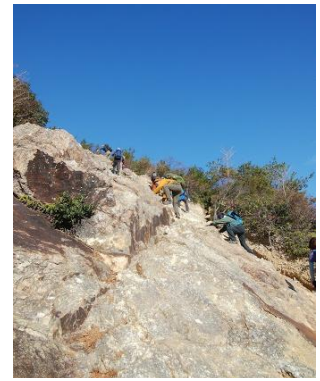
⑮ 競うように登ってます