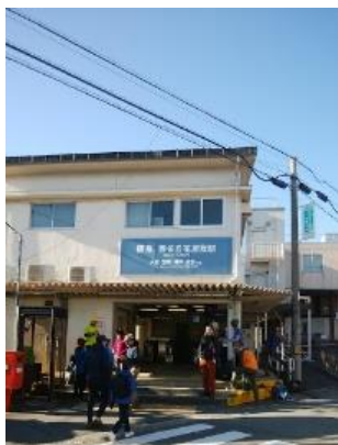
① 雲雀ヶ丘花屋敷駅(スタート)

今日は納山山行、Aaコースは中山観音駅・Bbコースは雲雀丘花屋敷駅から各々中山最高峰を目指して登る。Bbコースは釣鐘山・石切山を縦走、満願寺を経由した後、中山連山縦走路に入り最高峰でAaコース5名と合流、最高峰からは21名で行動を共にする。PM4:00開催の納山会には早く着きすぎるといので時間調整しながら歩き駅前の居酒屋(へっついや)に到着。会長挨拶後いつものように大いに盛り上がった納山会でした。