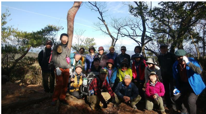
①9 中山最高峰集合写真(Aa・Bb 両コース共)