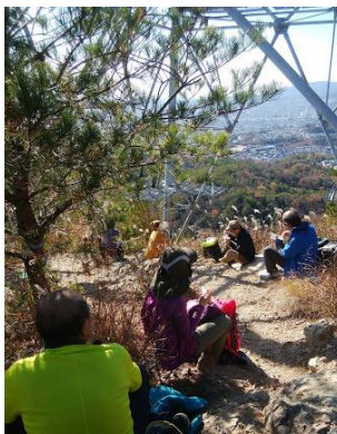
⑯ 鉄塔下で早めの昼食