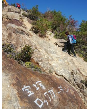
⑬ 誰が名付けたのかな?