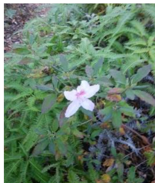
⑥ ツツジの花?が咲いていた (温かいので咲く時期を間違えたのかな?)