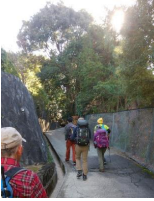
⑦ 満願寺を目指し舗装路を歩く