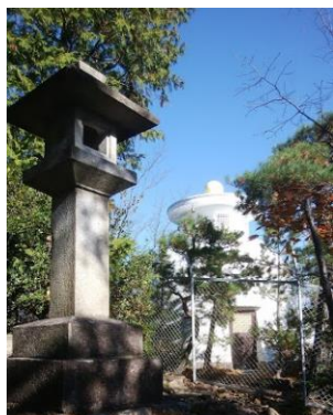
④ 仏舎利塔(フェンス奥)