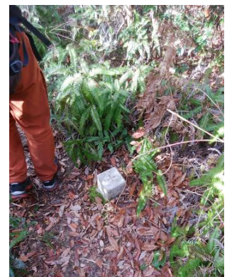
⑱ 満願寺西山三角点