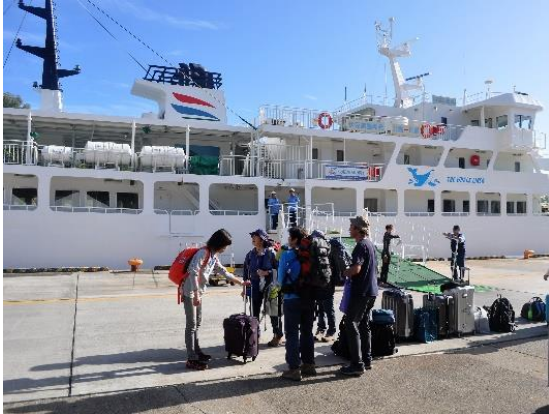
14:00 ははじま丸出航 父島へ