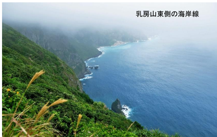
乳房山東側の海岸線