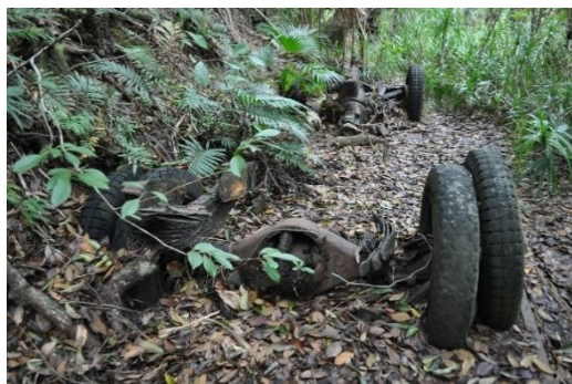
こんなところに旧日本軍のトラックの残骸が