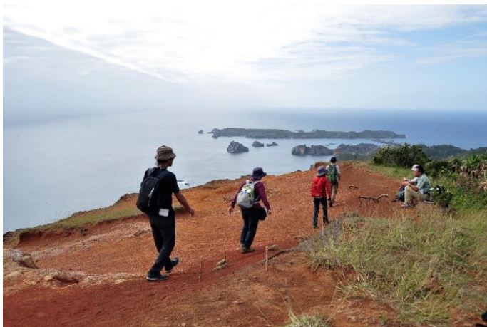
千尋岩 (ハートロック)