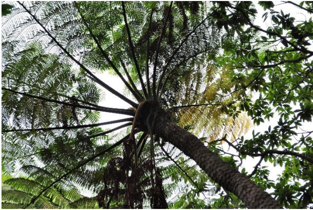
マルハチ (小笠原固有のシダ)