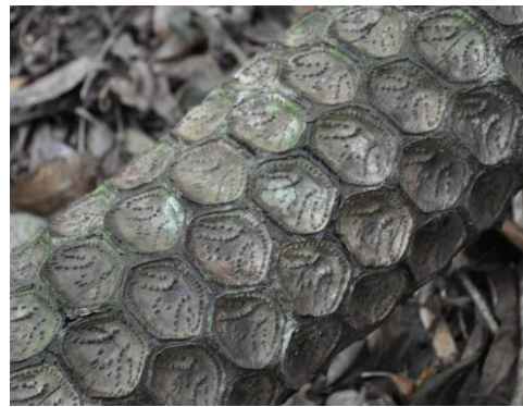
マルハチの幹。名前の由来が一目瞭然