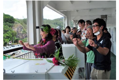
こちらも応えてフラダンス