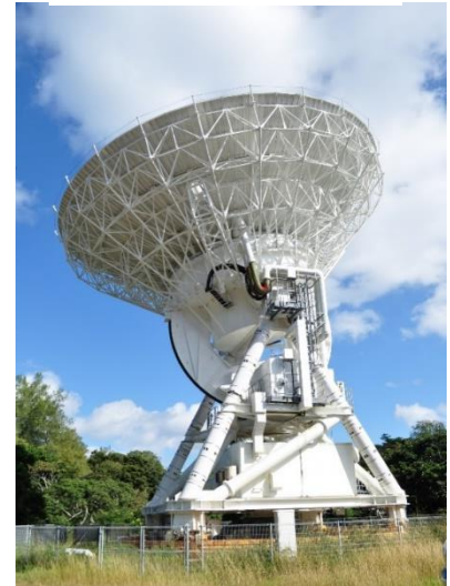
国立天文台 電波望遠鏡