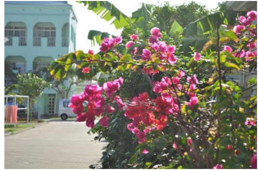
出航までの間 買い物や食事などを楽しむ