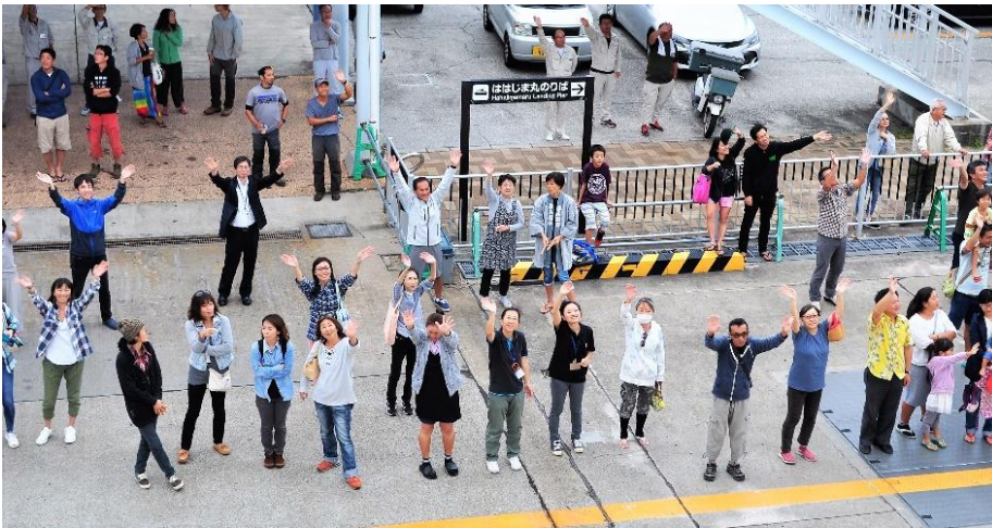
島の方々のお見送り。