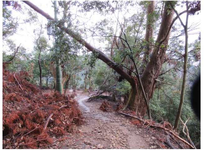
愛宕神社表参道でも倒木多し