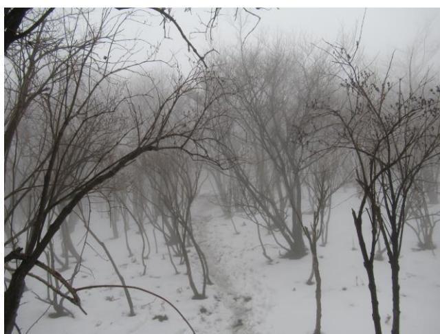
余力ある9名で竜ヶ岳を目指します