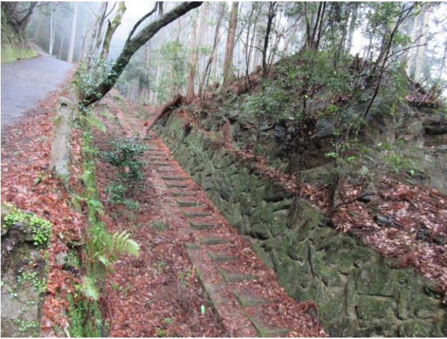
ケーブルカーの跡