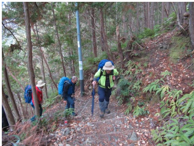
傘を杖替わりに使っています