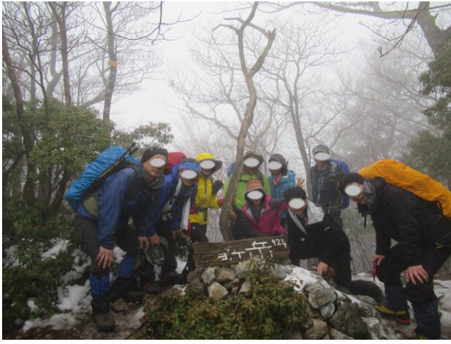
竜ヶ岳の山頂で記念写真