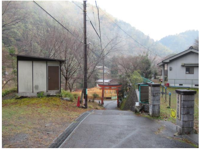
天気が回復し下山しました