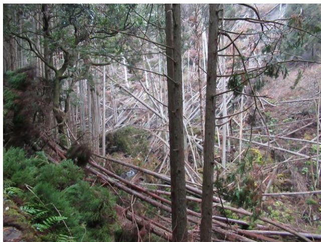
出だしの林道は倒木だらけ

8:15 清滝バス停 ~ 9:01 月輪寺登山口 ~ 9:55 月輪寺 ~ 11:04 愛宕神社 11:45 ~ 12:45 竜ヶ岳 ~ 13:48 愛宕神社 ~ 14:14 水尾分かれ ~ 15:22 愛宕神社二の鳥居