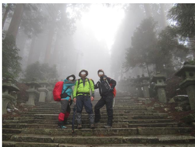
愛宕神社参道でポーズ