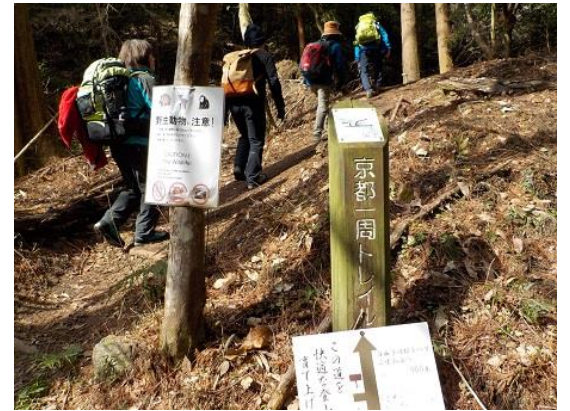
6.神社のはずれから登りが始まる