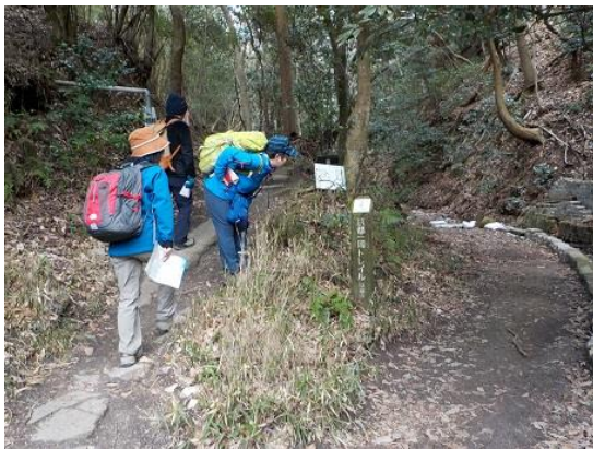
4.舗装道から京都トレイルの標柱のある登山道へ入る