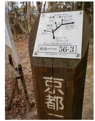
9.トレイル 56-3 の標柱