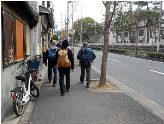
1.出町柳を出発し、一路車道を東に進む

前回の平日山行(山空海温泉)に続き秘湯巡りということで企画した。場所は北白川の京都トレイルコースの外れにある「不動温泉」。天然ラジウム鉱泉で健康のために非常に良いとのこと。山の会故、山もなければいかんということで、トレイルコースの瓜生山に登ったが、縦走のはずが分岐点を間違い、コースは違うが元の登山口に戻る周回コースとなってしまった。