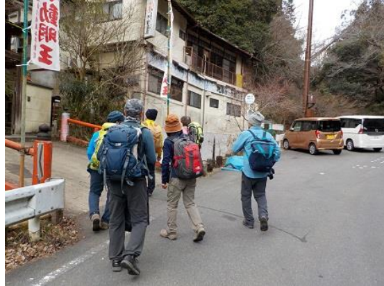
20.ようやく不動明王に到着