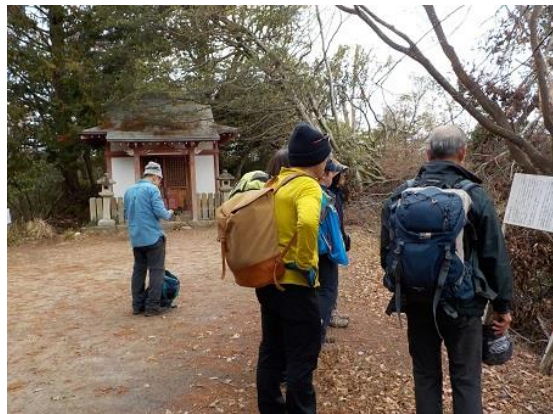
11.瓜生山頂上(301m)に到着