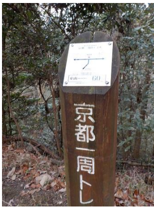
13.分岐があって、ここでルートの間違ってしまった