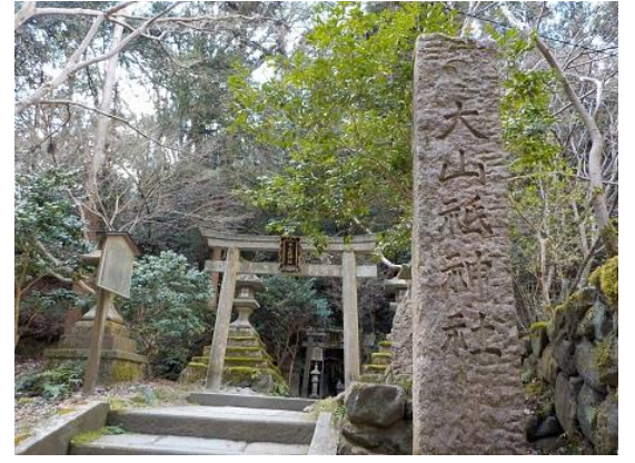
18.途中でルートの間違ったのに気付いたが、やはり元の北白川大山祇神社に戻ってきてしまった