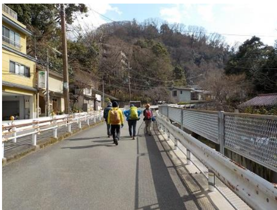
19.仕方なく車が行き交う舗装道を歩くことになった