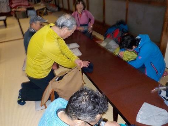
23.入湯後は座敷の休憩所で食事ができる。結構美味しい料理で、一杯飲んでゆっくりくつろいだ