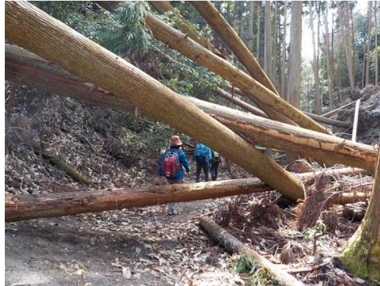
17.昨年秋の21号台風によるものと思うが、すごい倒木だった