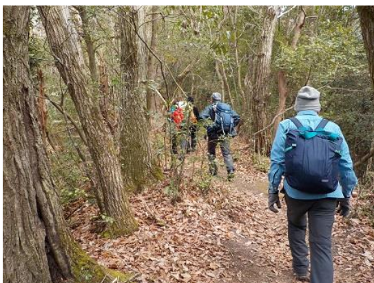
7.静かな道を落葉を踏みながら進む