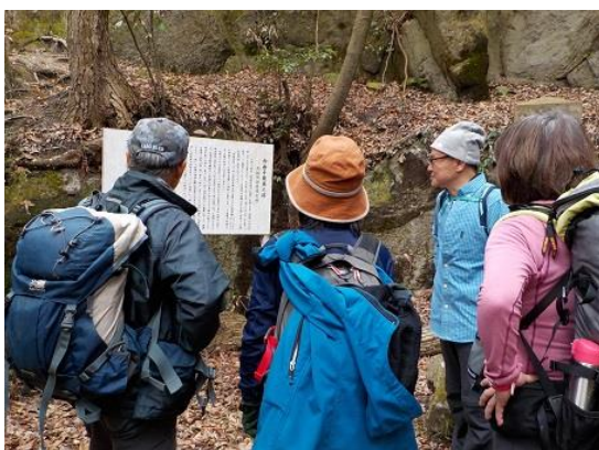
10.白幽子寓居跡で解説板を見る