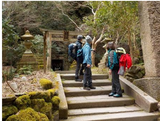
5.北白川大山祇神社前を通る