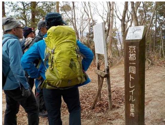
8.史跡の案内板を見て暫し休憩