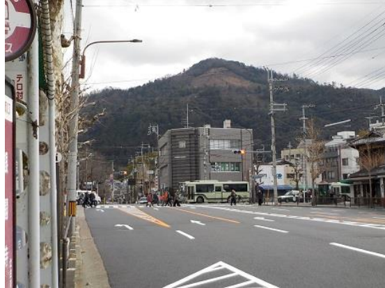
2.京大前を過ぎると大文字山が見えてきた