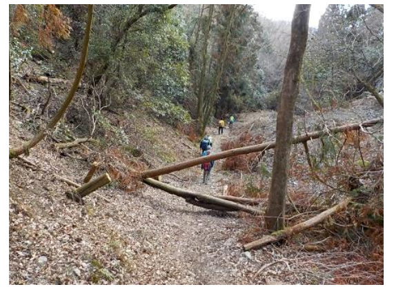
15.杉の倒木が目立ち始める