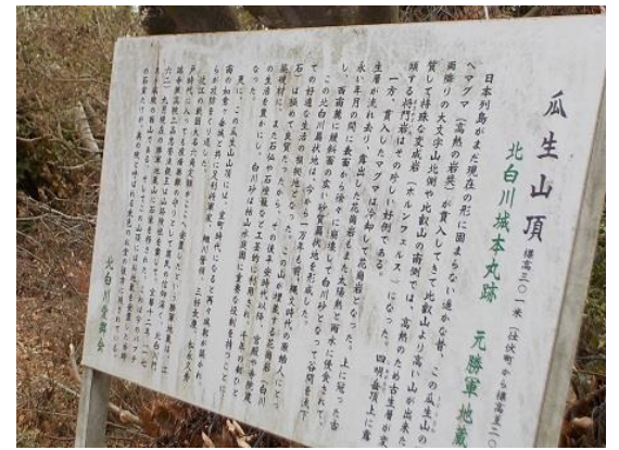
12.瓜生山は山城だったそう