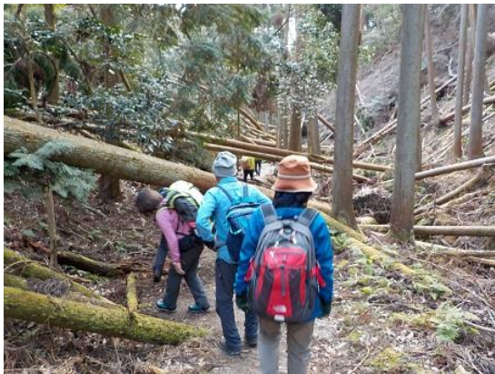
16.倒木の下を潜りながら進む