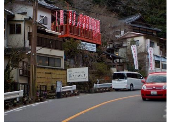
24.これが不動明王と不動温泉の全景。湯治がてらまた行ってみたいくなる温泉だった