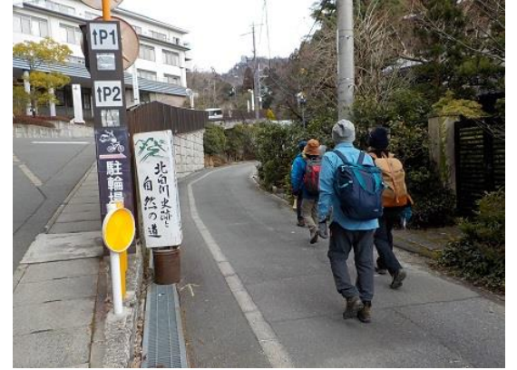
3.北白川に入り、バプテスト病院前を通る