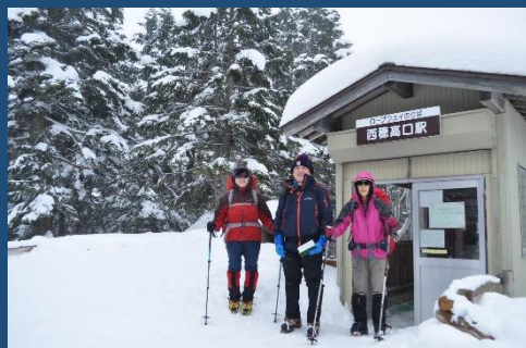
ロープウェイ終点からスタート