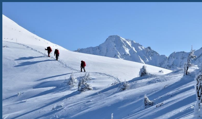
ピラミッドピーク白く天を指す。西穂のピークはここからは見えない（左奥）