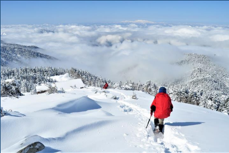
遥か白山を見ながら下る