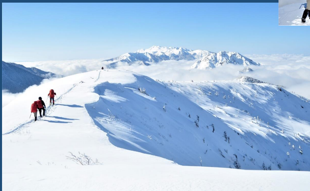
下りは乗鞍を正面に見ながら