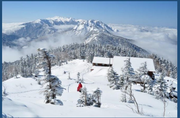
西穂山荘が足下に