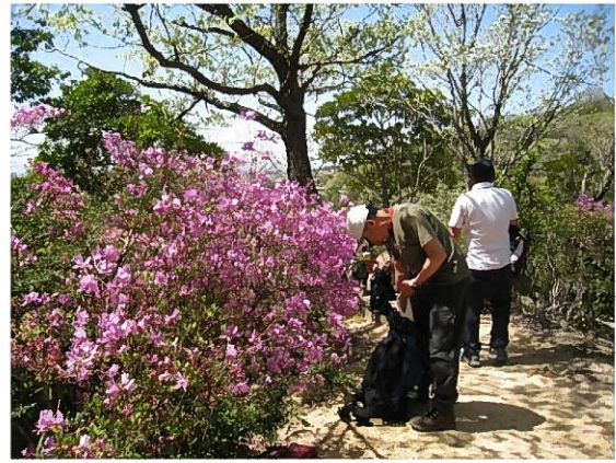
つつじが満開（小休止）