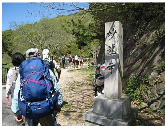
県道から北山植物園への裏口