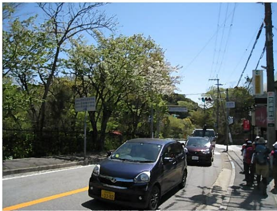
植物園を出て柏堂の交差点へ