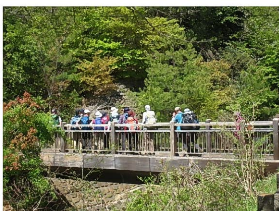
裏口からすぐの橋