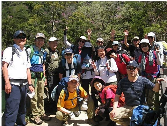
貯水池で記念撮影