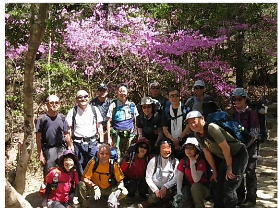
満開のつつじ（左端だんご3兄弟？）