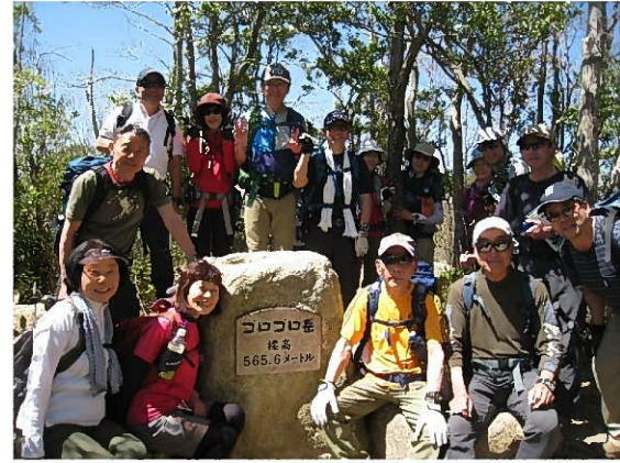
ゴロゴロ岳山頂（標高565.6m）