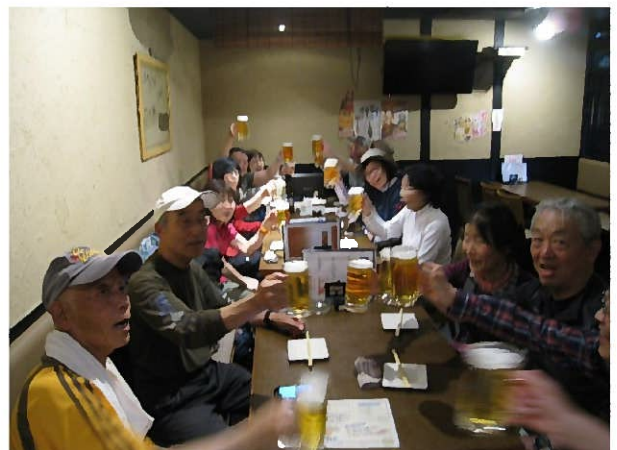
居酒屋じゅう屋にて