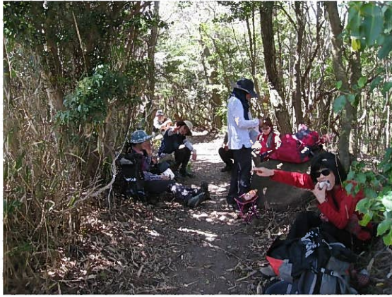
ゴロゴロ岳手前で昼食（木陰を探して）