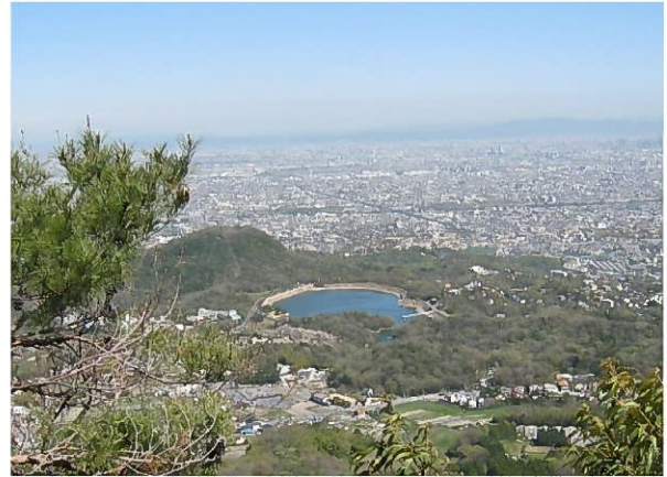
甲山と北山貯水池