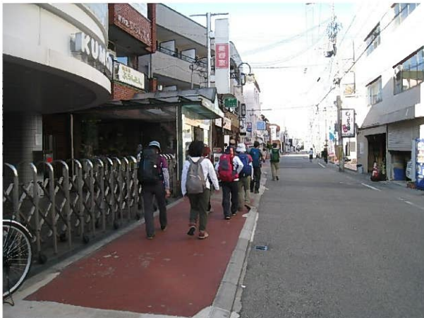
阪急門戸厄神駅をめざして