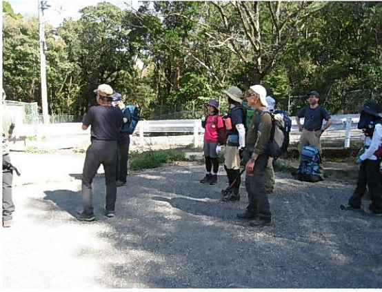
鷺林寺下の広場に到着