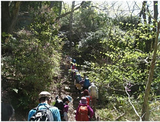
ここから階段だぞ