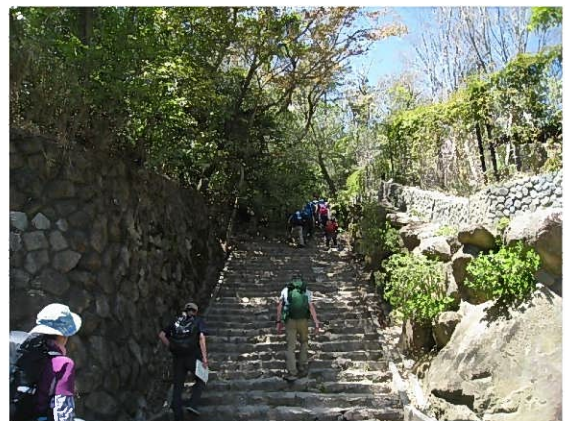
苦楽園尾根の入り口 (?) 付近