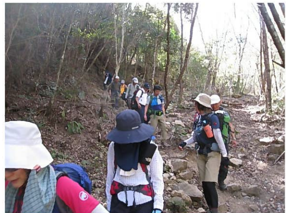
急坂を降りやれやれ