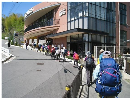
さあ出発(結構長い列)

柏堂交差点11:20→苦楽園尾根入口11:40着→ →観音山山頂13:50着→鷲林寺下14:30着→ 阪急門戸厄神駅16:40着