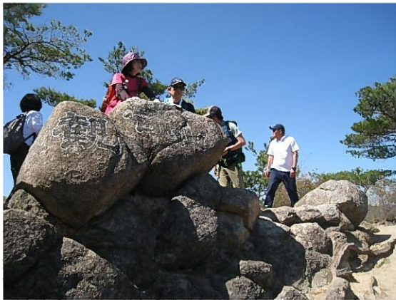
ここが観音山山頂です（大笑い）