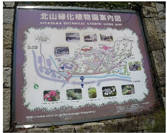
北山植物園案内図