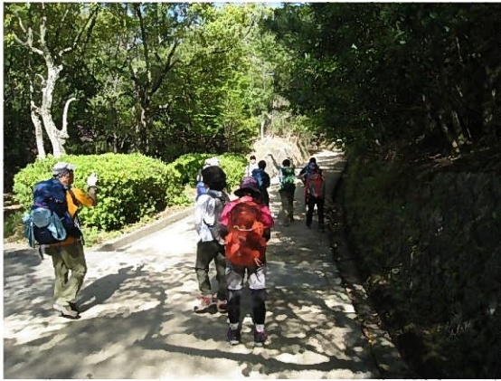
森林公園内の園路