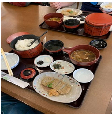
宇和島名物鯛めし