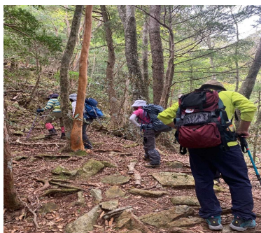
どんどん上ります