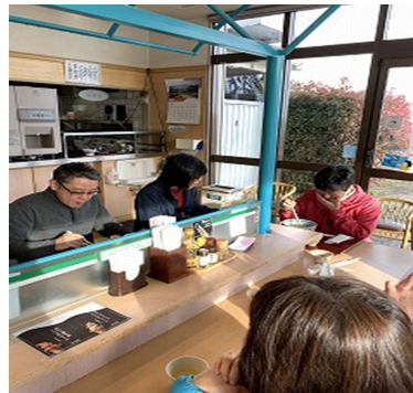
四国上陸後 まずは朝食