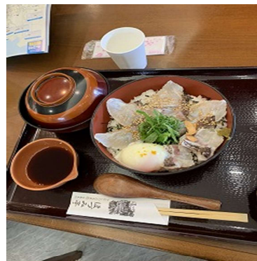
同じく鯛どん 美味しかった