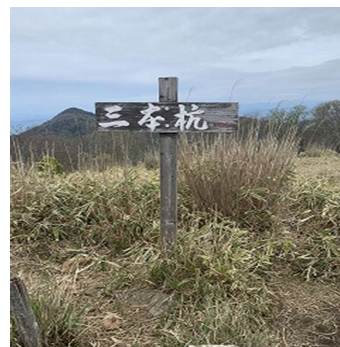
今回の目的三本杭(1226.1m)