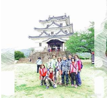
宇和島城でハイポーズ