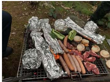
バーベキュースタート