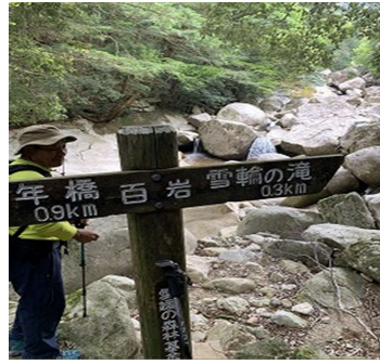
百岩（川に岩がゴロゴロ）