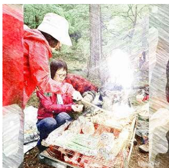
意外に楽しい大人のBBQ