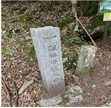
滑床キャンプ場入り口到着 やれやれ！