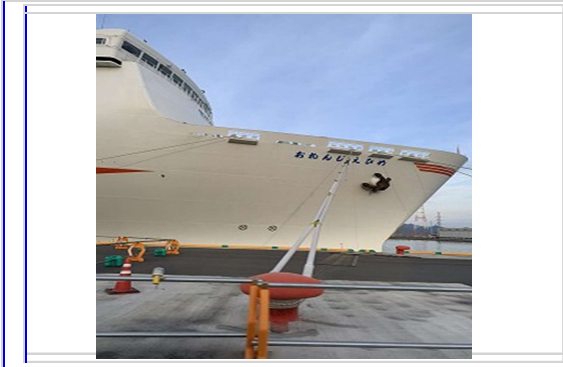
おれんじ えひめ号で四国東予港へ

29日 滑床キャンプ場8:00出発→宇和島城8:52到着→道の駅きさいや広場10:00到着→阪急宝塚16:30到着