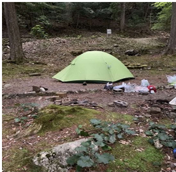
女性用テント（暗くなる前に張れてやれやれ）