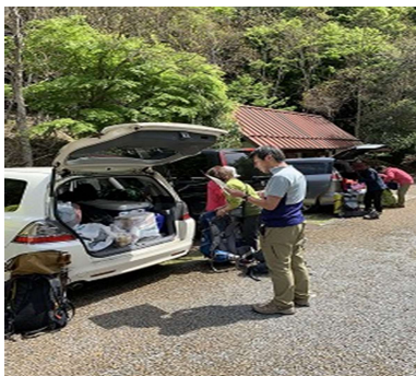
滑床キャンプ場(この後サルに椎茸盗られる)