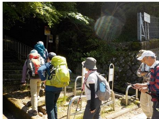
21.勝尾寺の休憩所でアイスクリームなどを食した後、長い階段道から再スタートする