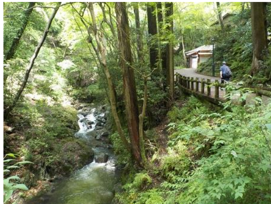
5. 駅から僅か30分程でもう深山幽谷の雰囲気