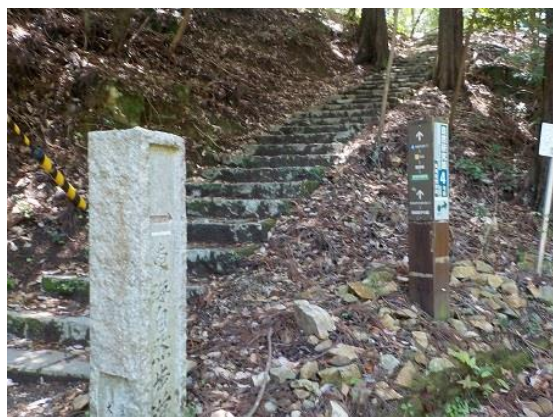
11. ランチ後の歩きは、長い階段から始まった