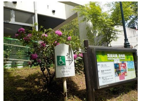
3. 昆虫館前を通過する