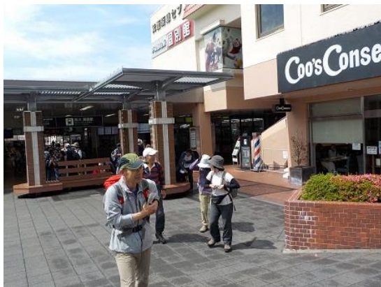
1. 定刻どおり箕面駅を出発した

箕面の山は昨年来、風水害により多くのルートが通行不可となっていたが、被害の傷痕は随所にあったものの歩くには問題なかった。平日山行にもかかわらず8人もの参加があった。下山後は、男性軍だけとなったが彩都・すみれの湯で汗を流した。