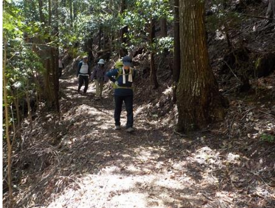
17.樹林の中を黙々と歩く