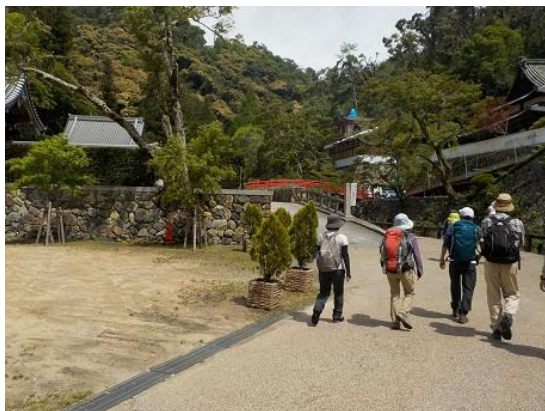
4. 瀧安寺前を通過する