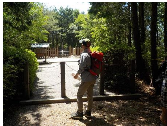
15.開成皇子の墓 皇族の墓で宮内庁が管理している