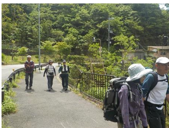
7. ビジターセンターまでは暫く車道脇を歩く