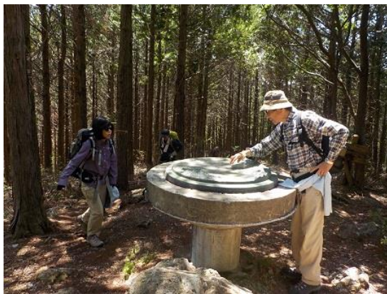
14. 最勝ヶ峰の方位盤 周りの木が育つため、視界を閉ざして何も見えない