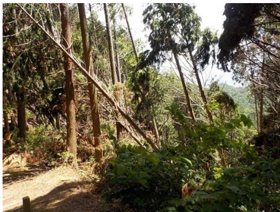
13.ここにも倒木が・・・ 関西の山はどこへ行ってもこんな光景が見られる