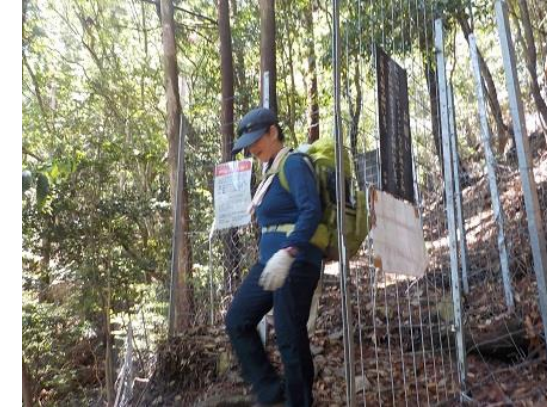
18.鹿の侵入を防ぐ柵 門扉を開けて外に出る