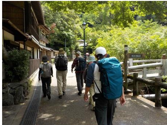
2. 箕面川沿いの道を進む