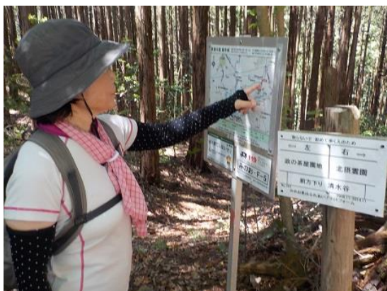
16.今、どこやるか？ これからこう行くんやね