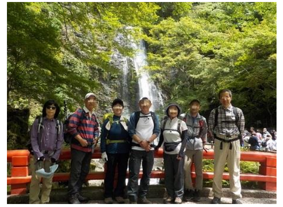
6. 箕面大滝の前で 平日でも人は多かった