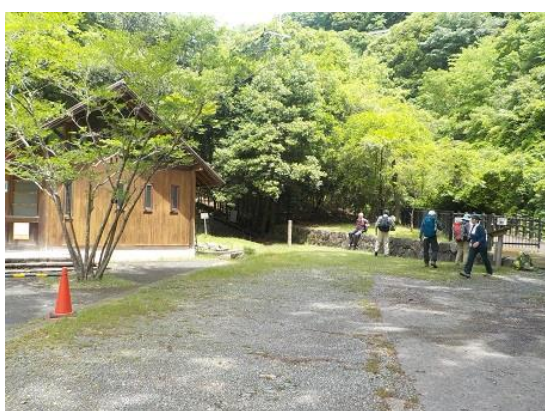
10. ビジターセンターに到着。ここでランチタイム