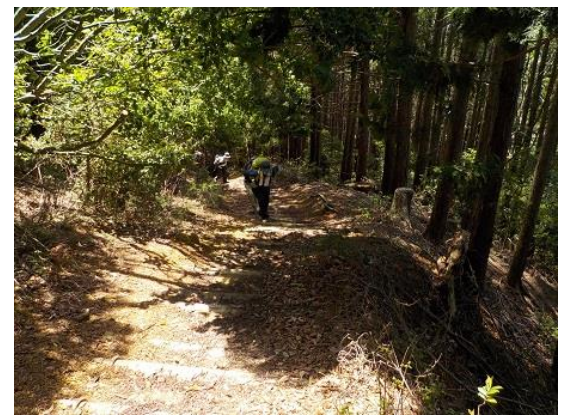
12. 暑い日だったが、風が心地よかった