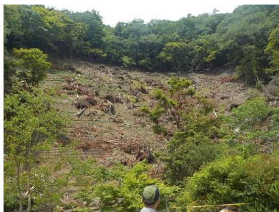
8. 台風による倒木跡。伐採して片付けられていた