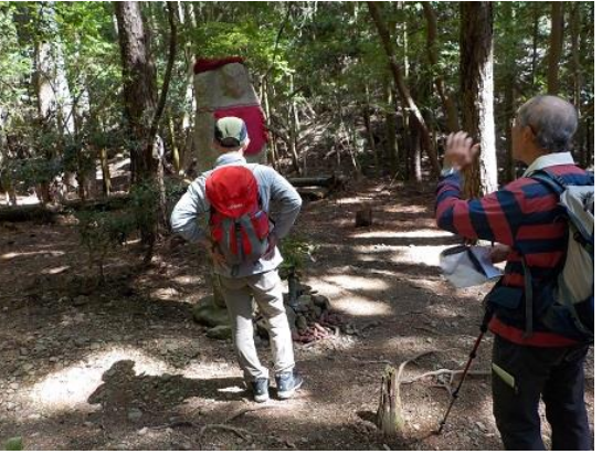
23.しらみ地蔵前に到着