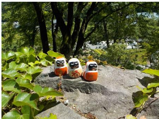
19.勝尾寺に裏山から到着 なぜか小さなダルマさんがあちこちにある