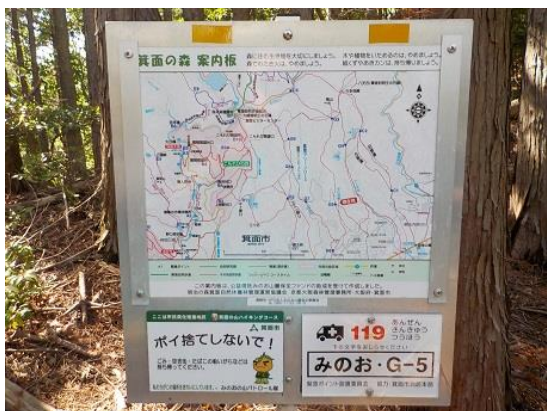
25.外院へ下りる予定であったが、G-5から石丸へ下りることとなった。