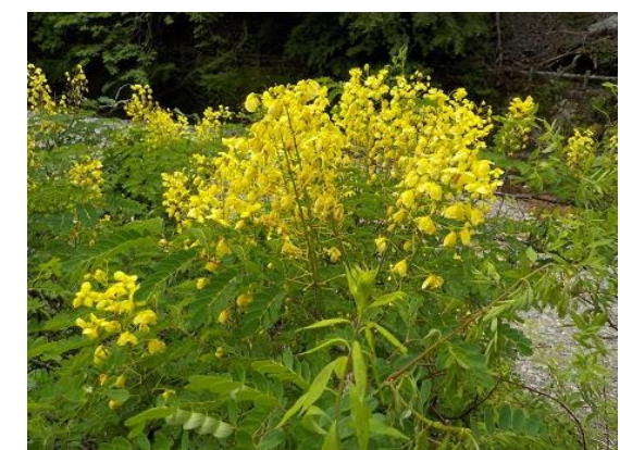
9. 見慣れぬ黄色い花 はて? 外来種のような