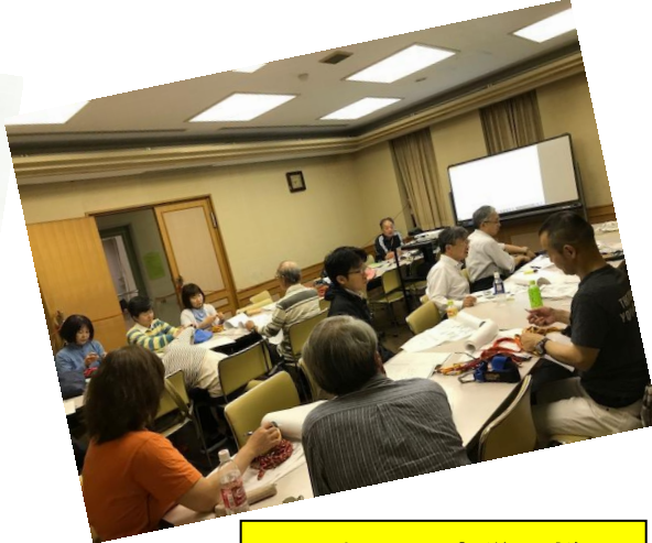
公民館での座学の様子