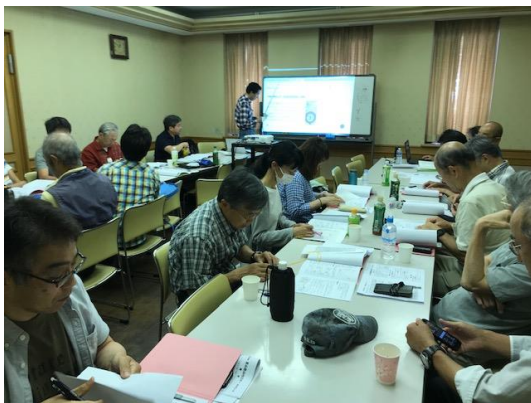
読図、コンパスの使い方の講義風景