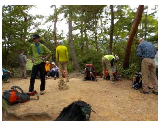
14. 荒地山頂上に到着