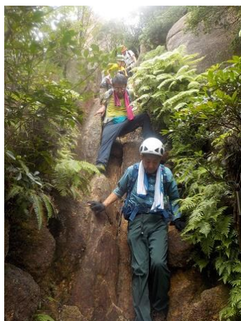
16. 荒地山名物・岩梯子を慎重に 下る