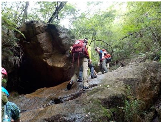
4. 滑りやすい岩の上を慎重に進む