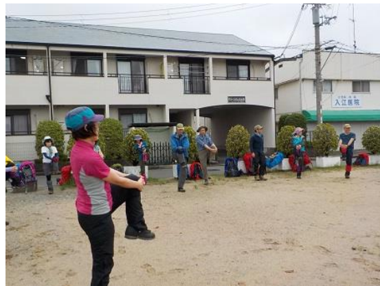
2. 近くの広場でストレッチをして出発準備