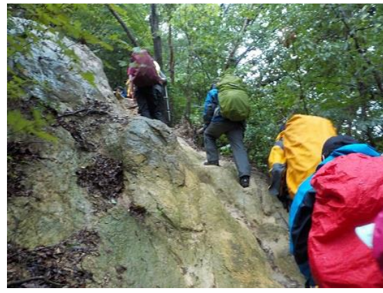
6. 中山の岩場を登り始める