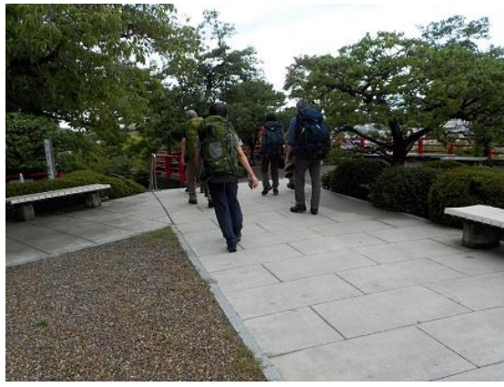
20 ミーティングを終え、さあ一杯飲みに行こうと出発した