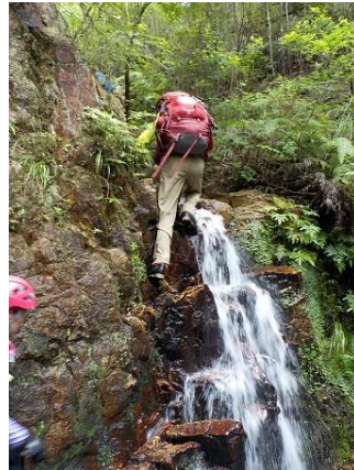
5. 最後の滝を越えて行く