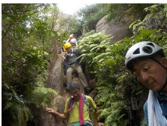
17. 岩梯子 その2 こうして下っていき、今回の実技・トレー ニングは無事終了した。後は槍ヶ岳の修了山行 を残すのみとなった