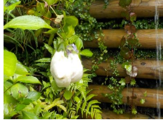
18. この堰堤にモリアオガエルの白い大きな卵塊があった