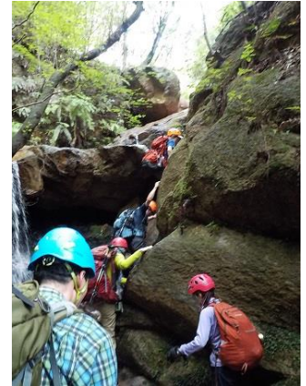
3. 連続する小さい滝をほぼ直登して登る