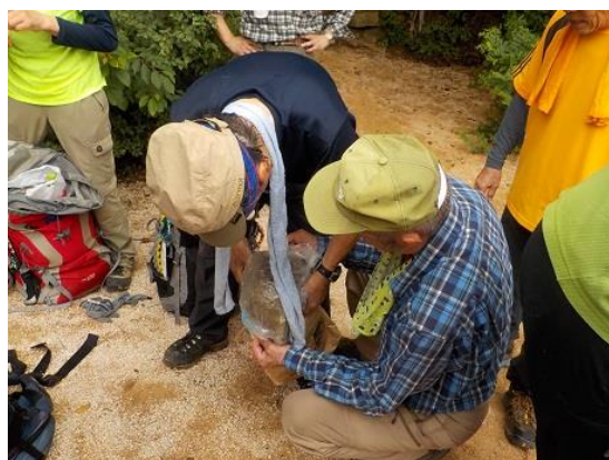
10.ピラーロックでランチした後、歩荷の準備。 大きな石をザックに入れる