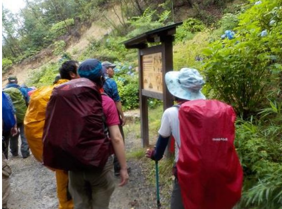
17. 徒渉は終わり、中山寺近くの木製の小堰堤のところまで来た 雨に濡れたアジサイが綺麗だった