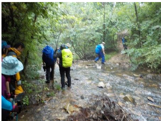
16. 十数回徒渉するが、水量が多くて良い徒渉の練習になった