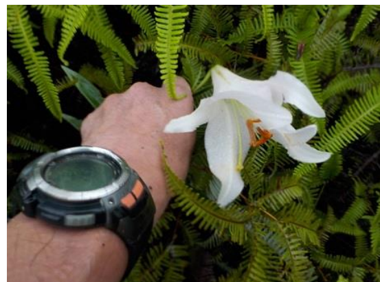
9. ササユリが咲いていた 今年 2 度目の出会い(前は和田寺山にて)