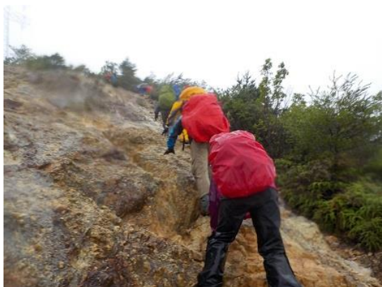
7. 降りしきる雨の中を滑らないように注意して登る