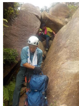
15. 新七右衛門岩の小さな穴を くぐり抜ける