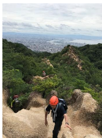
8. その3 暑かったが見晴らしが良かった