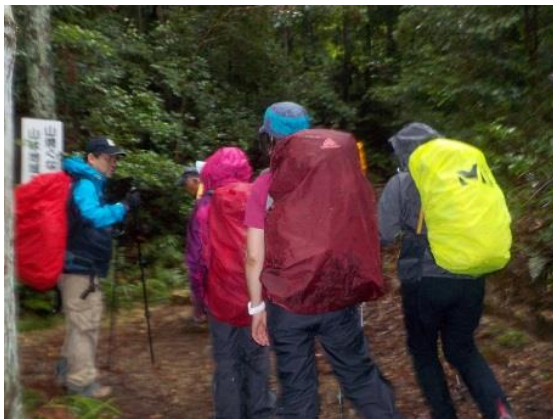
5. 井植山荘分岐のところで、石をザックに入れて歩荷をスタート