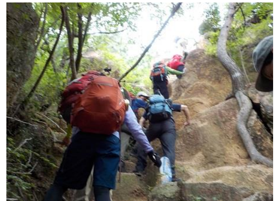
9. ピラーロック手前の急な岩場を登る