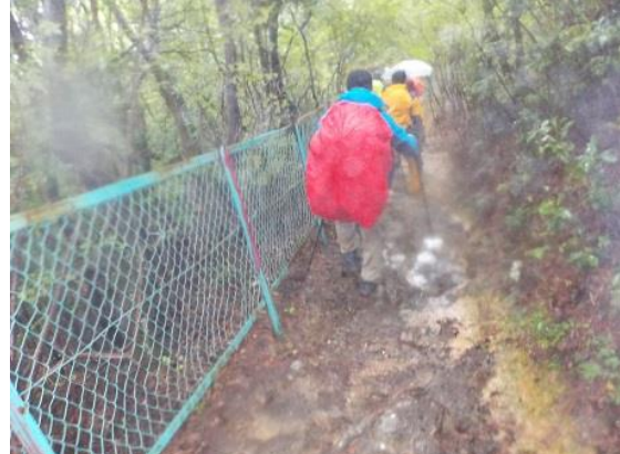
12. 中山寺をめざして下山を開始する