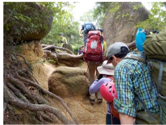
12. 歩荷して荒地山をめざす