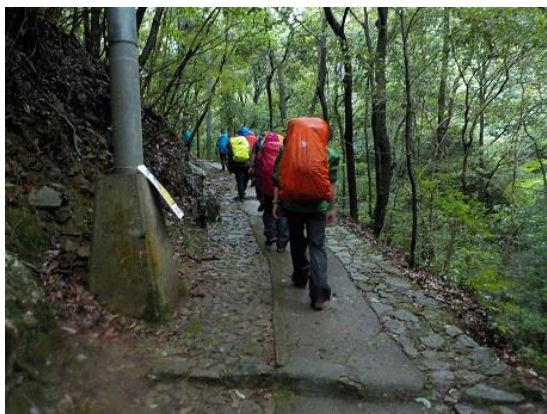
4. 最明寺川に沿って進む