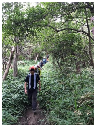
13. 六甲名物・クマザサの道を行く