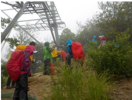
8. 岩場終了点の高圧鉄塔下に到着