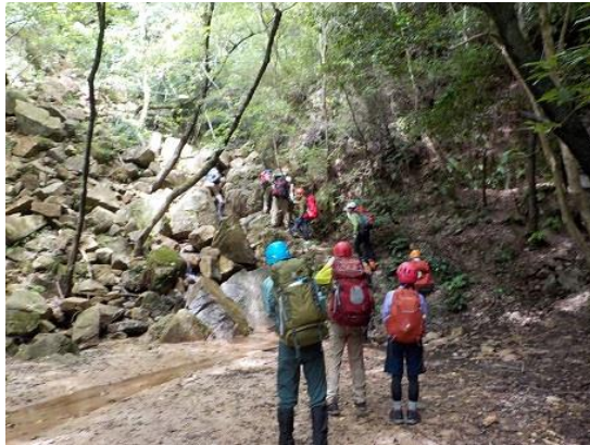
1. 地獄谷の入り口 ここからスタートする

地獄谷では三点支持での登り方、岩場歩きのトレーニング。そして、荒地山へは歩荷をして登った。下山時は岩梯子等で岩場における下降のトレーニングを行った。