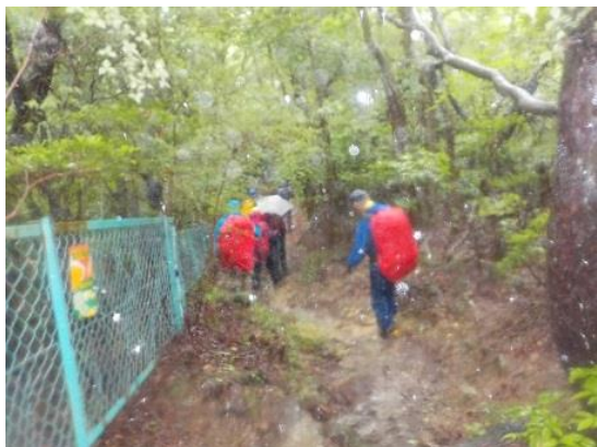
10. 雨は止まず、黙々と歩く