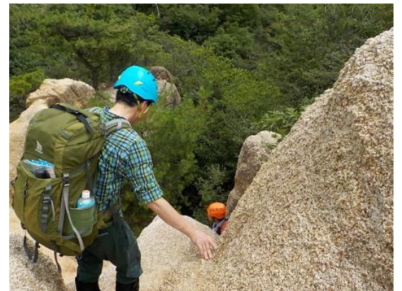
6. 地獄谷を通過した後は、ピラーロックへと続く万物相の風化した岩場を進む