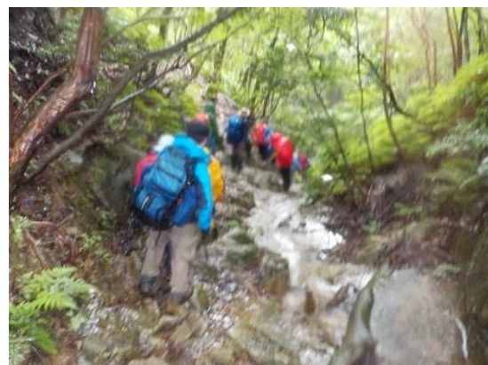
15. 足洗川を徒渉しながら下る