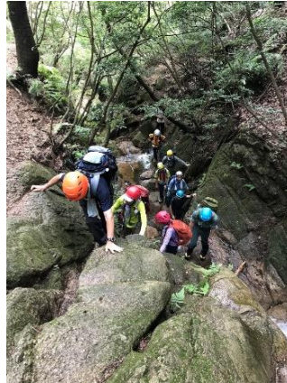
2. 三点支持で急な岩場を登る