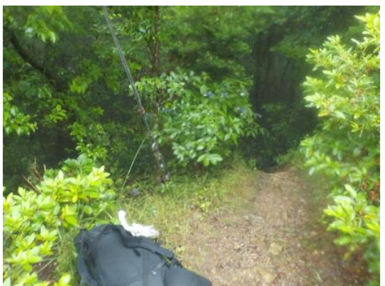
14. そして、ここから足洗川の源流へと下って行く