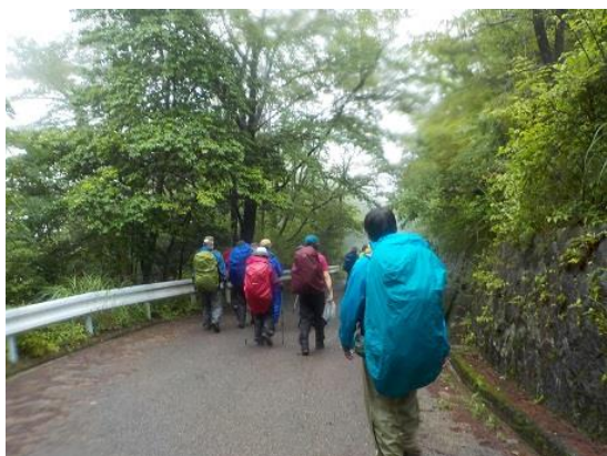
13. 一旦、中山桜台の住宅地に出る