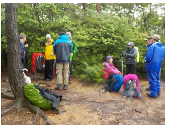
11. 中山最高峰に到着