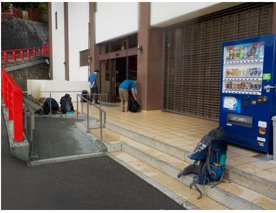
19. 中山寺に到着。この休憩所で着替えの後、次回の比良での実技・トレのミーティングを行った