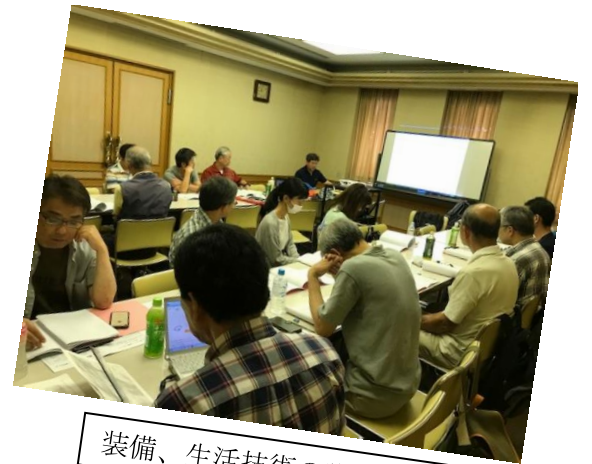
装備、生活技術の講義風景