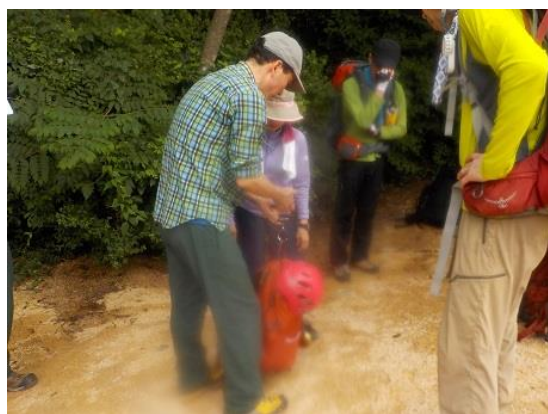
11. 秤で計量し、重さをチェックする。手抜き は許さんぞ!!