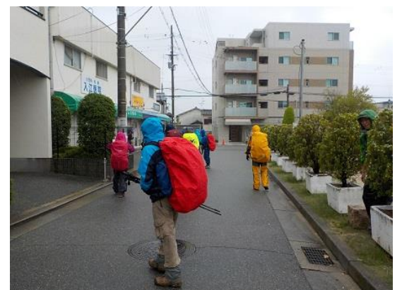
3. 雨の中をスタート