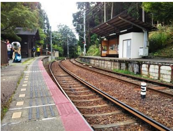
1. 叡山鉄道の無人駅二ノ瀬に到着

二ノ瀬から貴船山を登り、貴船神社を経て鞍馬山に登る計画で実施した。当初は滝谷峠から貴船神社側へ下る予定であったが、このコースは昨年の台風21号の被害からか、倒木や一部登山道の崩壊があるため、このコースは避けて北側の芹生峠へと抜ける遠回りコースで歩いた。鞍馬山頂上へはルートに何故かロープが張ってあったため、入ることは断念した。京都北山は昨年の台風のため、倒木により荒れており、昔のような姿が回復するにはまだまだ時間がかかりそうだ。