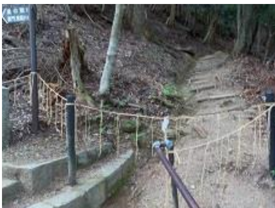
22. 鞍馬山頂上へ向かう道は閉鎖されていたため、登らずに進む