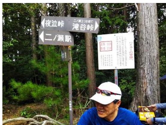
8. 途中の分岐で休憩する