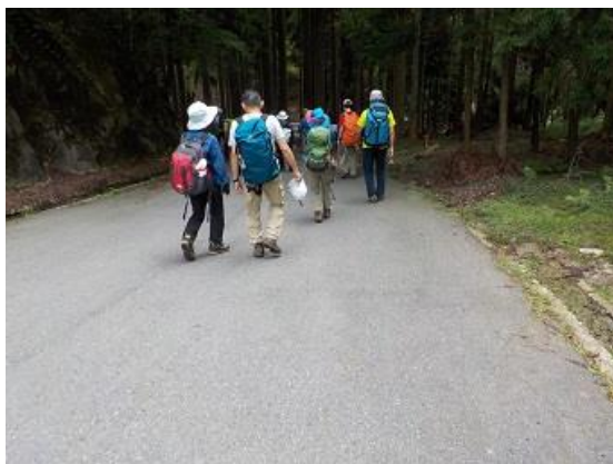
16. 貴船に向け林道を進む