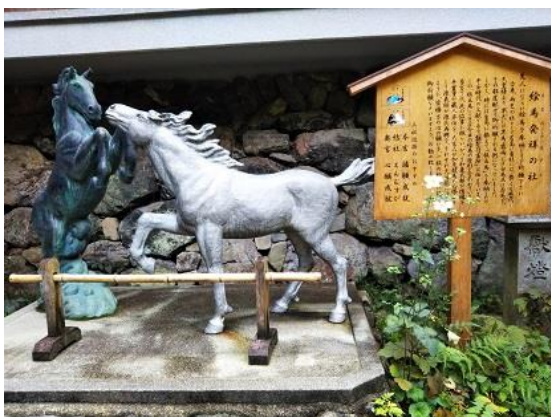
19. 貴船神社の絵馬(絵馬はここが発祥の地だそう)