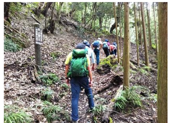
6. 暫くは急登が続く