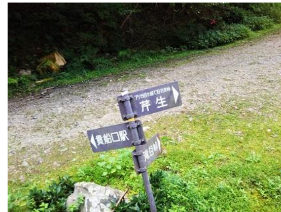
17. 滝谷峠から貴船に直接下るところに出てくるはずだった