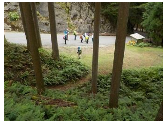
15. 途中、道は不明瞭だったがようやく芹生峠に下り立った