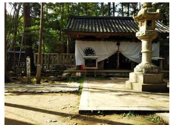
21. 今回一番の急登を登り、鞍馬寺奥ノ院・魔王殿に到着