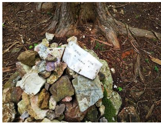
11. 貴船山頂上(三角点はこちらではない)