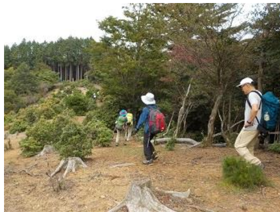
14. 芹生峠に向けて下っていく