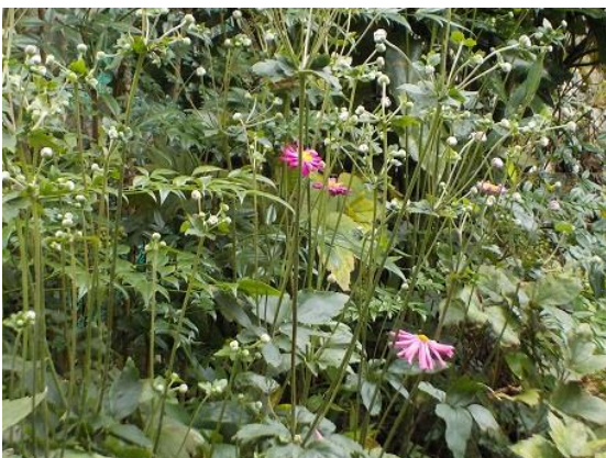
4. その2 シュウメイギク(秋明菊)