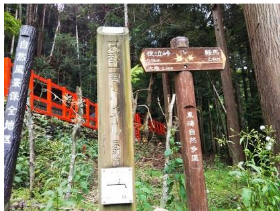
2. 富士神社前から登山道に入る