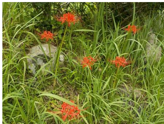
5. その3 ヒガンバナ(彼岸花)