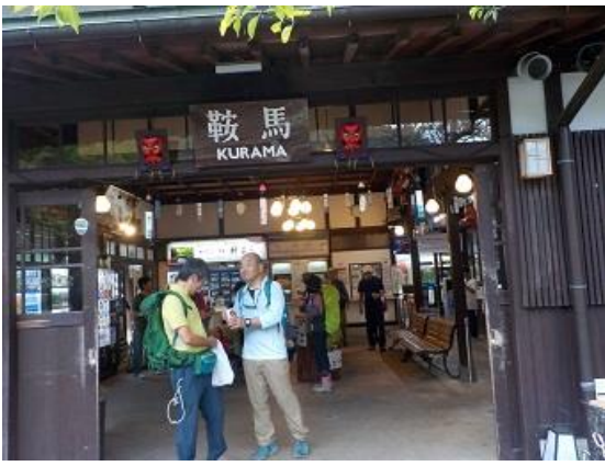
25. ゴールの鞍馬駅に到着し、山行は無事終了した