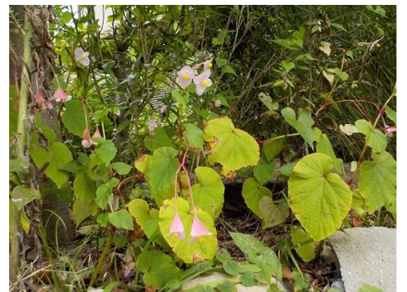
3. 道中にあった秋の花 シュウカイドウ(秋海棠)