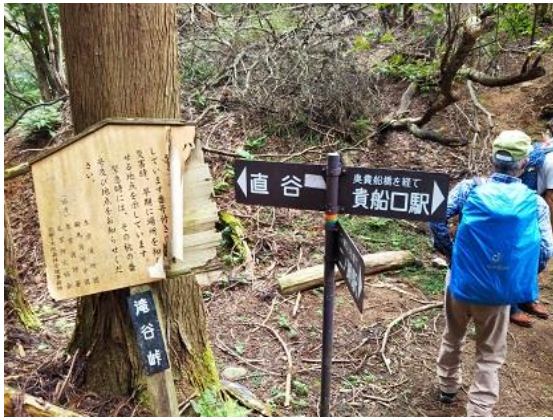
13. 滝谷峠に到着(ここから貴船へ直接下るか、芹生峠に迂回するかを思案したが、結局、迂回ルートをとることとなった。)