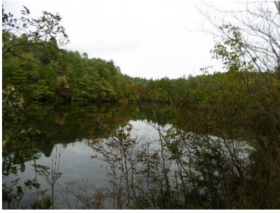
⑲ 内田池 昼ヶ岳から下山し池の麓を歩き ほっと一息。いい感じの雰囲気 紅葉の時には一段と映えるのでは