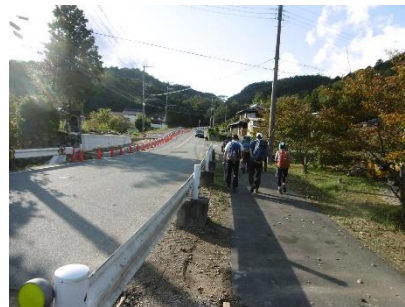
㉖ ひたすら舗装路を歩く 登山靴での舗装路は辛いなあ