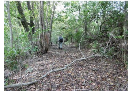
⑨ 頂上からの下山道も不明瞭で藪漕ぎしながら下りたが麓に近づくとも幅広い林道が現れた