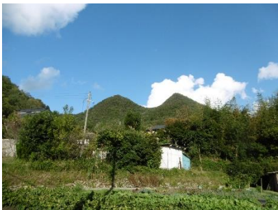
㉕ 羽豆川添から見た双耳峰の山 名称は不明だが感じ良さそう 何かの機会に登ってみたい？ 登れるのか？道ある？