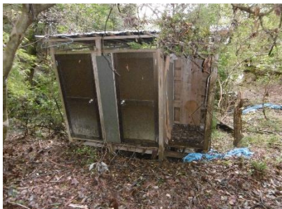
⑩ 麓には昔使用していたであろうトイレがあった今は使用できるようなものではなかった