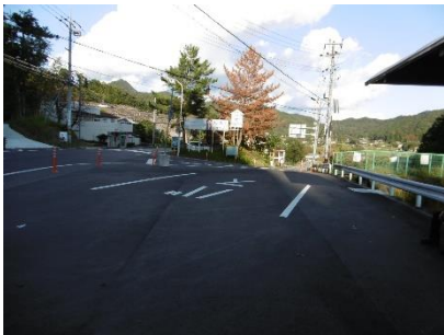
㉙ やっとバス停に バス停留所より来た方向を 振り返る 良く歩きました