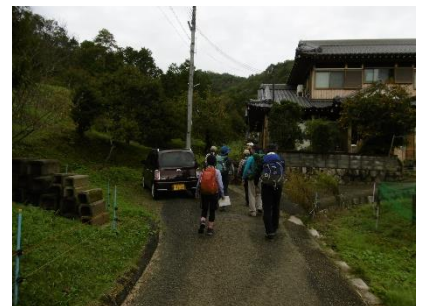
③ 民家の横まで舗装路 ここまで里山風情を味わう