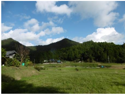
㉒ 波豆川上流の集落から見た 先刻登ってきた鳥飼山