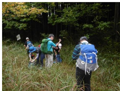
⑤ 林道が終わり分岐の登り口 を探す。足下も悪いので スパッツを付ける人も