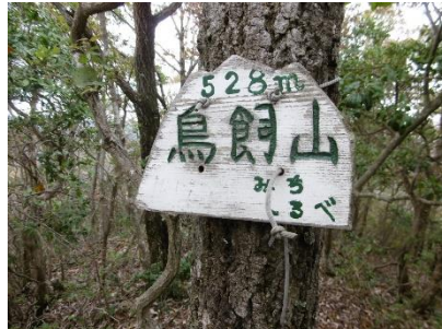
⑭ 頂上には明確な表示板があった下山は少し方向を間違えたがすぐ修正しその後はスムーズに下山