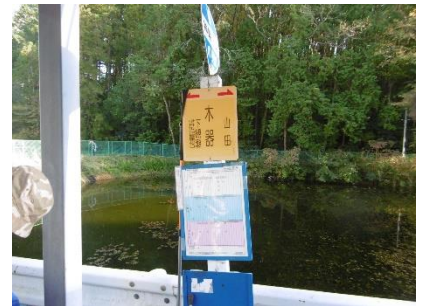
㉚ バス停(木器) こうづきと読むそうです こんな機会でもないとい生 知らなかったかな