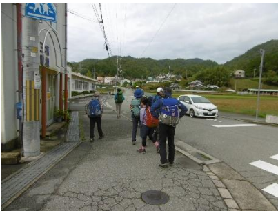
① バス降車 ミーティングの後出発

理由：クリーンハイクで幾度も登っていることもありルートも明確なのと当初予定のバス時刻に間に合いそうにないので今後の踏査山行とする