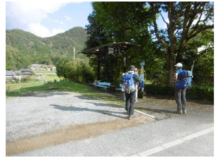
㉔ 波豆川バス停 大船山クリーンハイクの時に 降車するバス停（最終バスは 13時台、当然間に合わず）