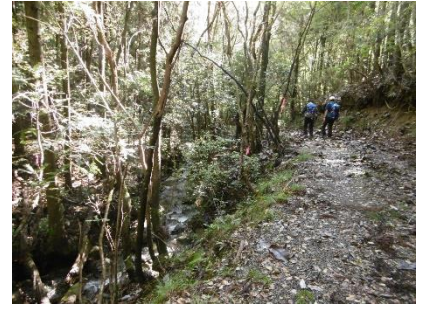
㉑ ひたすら林道を歩く