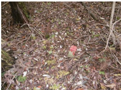
⑬ ほぼ尾根伝いに歩く所々に境界杭もありこれも目標物になり易いと思う