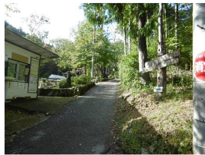
㉓ 大船山登山口（アスレチック側） この右から登るが、皆で協議した 結果本日は諸般の事情により後日 の楽しみとする？