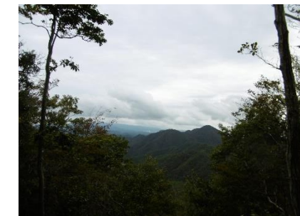
⑱ 昼ヶ岳頂上から見た大船山下山道も不明瞭な部分あるも迷わずに進めた