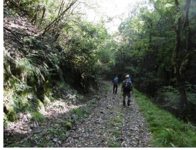
⑳ 内田池から大船山登山口に 向かって歩く