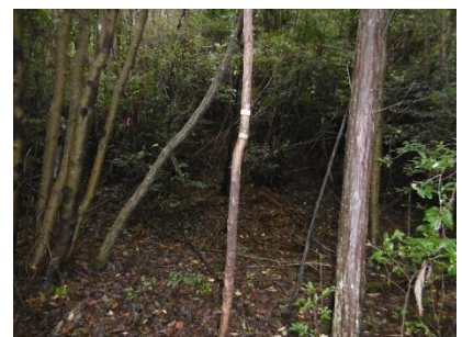
⑥ 少し前後しながら探すと 登山道らしきものを発見 ここから登る