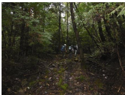
④ いよいよ林道歩き あまり使用されていないのか 結構荒れていた