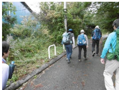
② 集落の舗装路を歩く