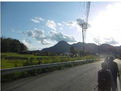
㉘ 大坂峠を越えて下ってしばらく 行くと向うに羽東山が視界に現 れた 次のトレイルのコースで登る山