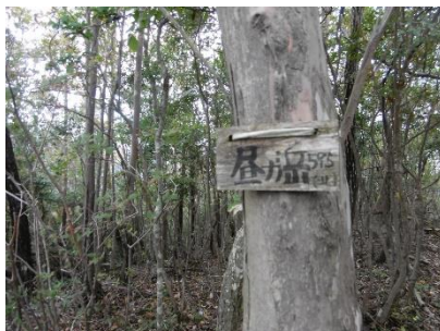
⑰ 昼ヶ岳頂上表示板この三峰では一番登る人が多いのか古い表示板が数か所あった