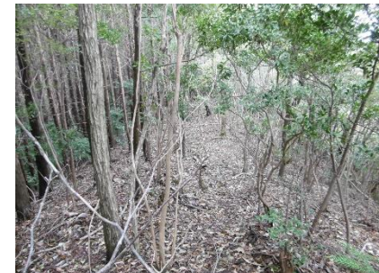
⑫ 登山道は明確ではないがよく見て進めば迷わない