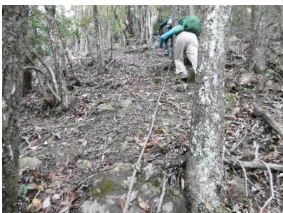
⑯ 頂上付近ではロープが2ヶ所付けてあり急登の程度がわかる