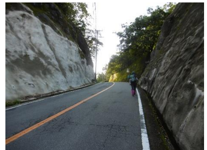
㉗ 大阪峠 この坂を越えて羽東川を 越えるとバス停だ。 まだまだだ・・・