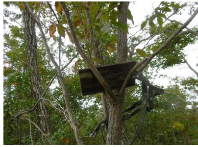
⑧ 頂上には表示板があったが上之岳の文字ははっきりとはわからなかったが、あったことに少し驚いた