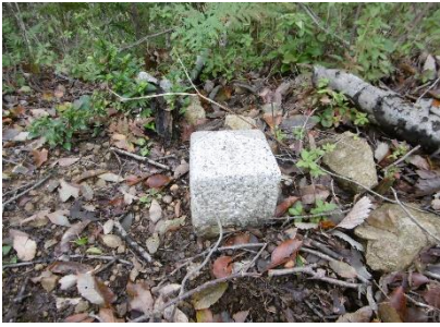
⑦ あまり明確な登山道はなく時々GPSを照合しながら尾根筋を登って行くと頂上に三角点があった