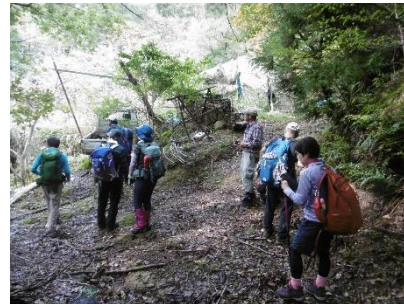
⑪ 上之岳から下山、鳥飼山への登り口で休憩。登り口は少し迷ったが無事発見