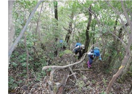
⑮ 鳥飼山を下山し昼ヶ岳への登りかなり急登が続く