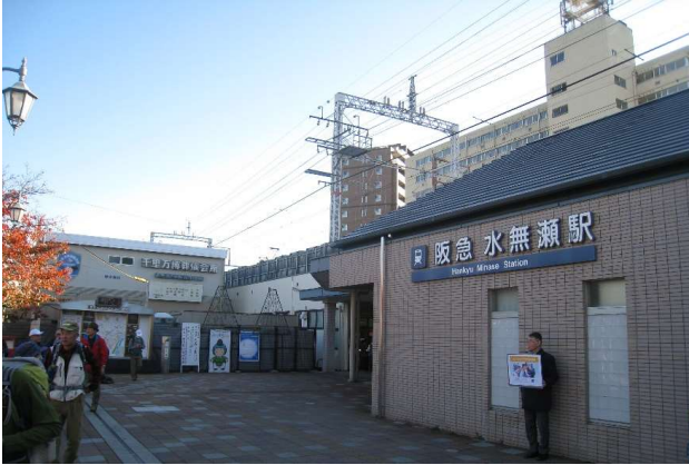
阪急水無瀬駅(CL遅刻)

→展望台(昼食) 12:00→町営キャンプ場(11)→府道左折 →大沢集落(右折)→(通行止) 12:50→う回路經由→ →釈迦岳 14:00→ポンポン山 14:30→本山寺(11) 15:30→ →神峰山寺 16:30→上ノ口(バス停) 17:10→JR高槻駅(北側)