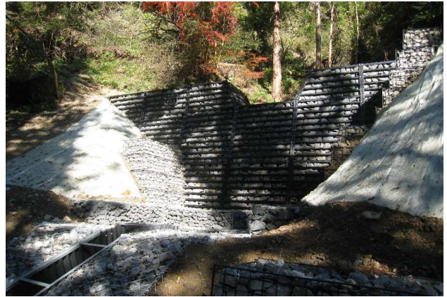
山腹崩落個所の対策工(谷止工いいねえ)