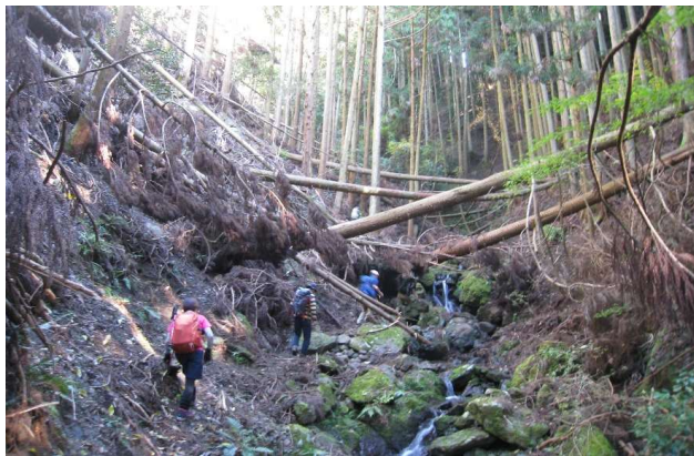
沢沿いの倒木樹林帯(めっちゃしんどい)