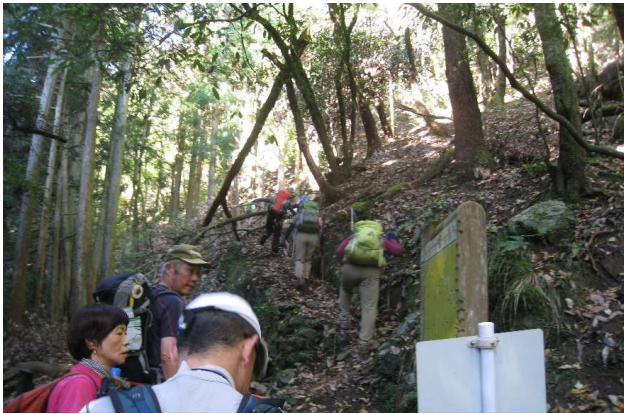
沢沿いのルートからここで別れる