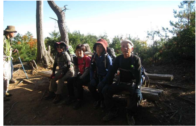
善峰寺分岐点ベンチ(お疲れ)