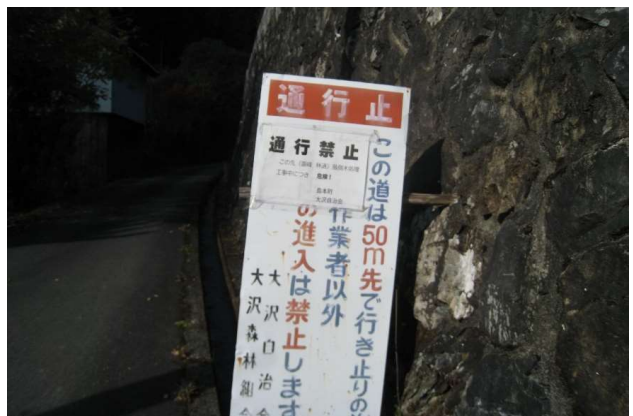
リ一側で通行止の看板娘(前進あるのみ)