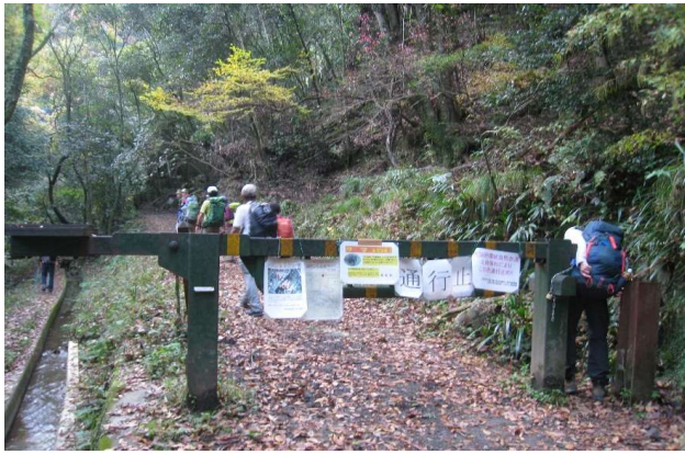
(ながどり橋左折) おおさか環状自然歩道(通行止め)