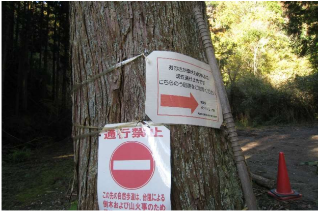
う回路へ(正解でした)