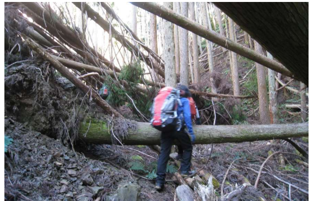
沢沿いの倒木樹林帯(もういや)