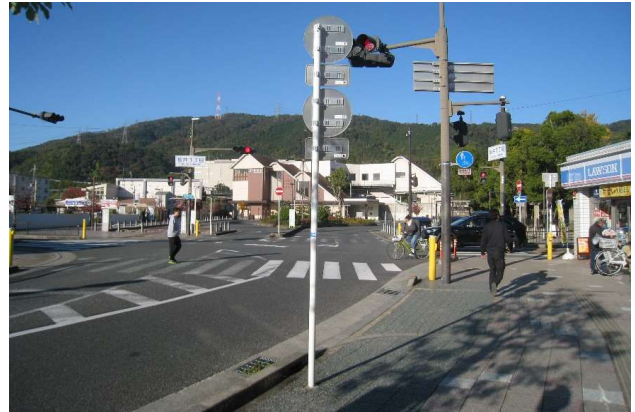
楠公道路桜井交差点右折(正面JR水無瀬駅)