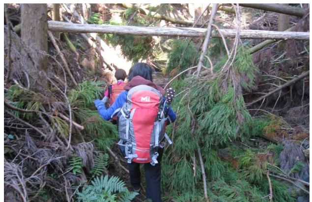
倒木樹林帯(いやいや)