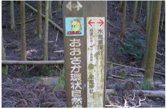
ここはどこや？時刻11：10