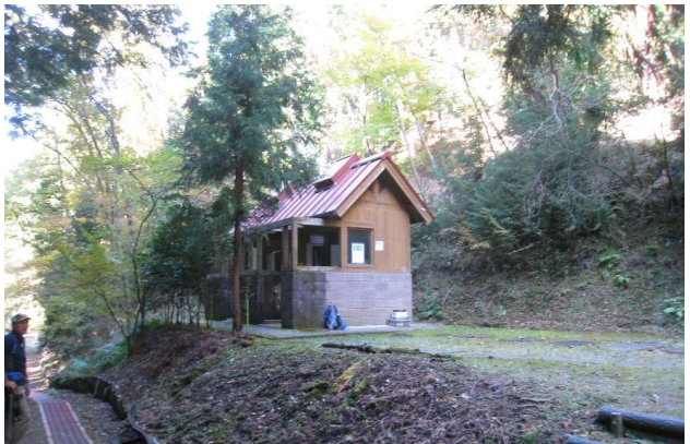
展望台そばの町営キャンプ場