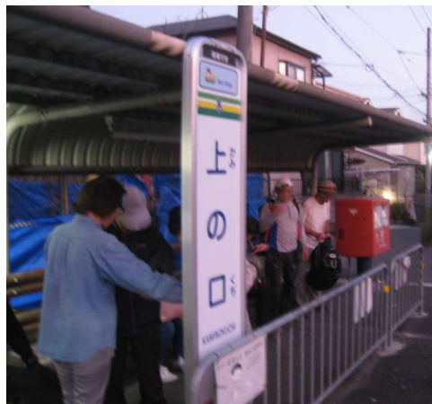
上のバス停(始発です)