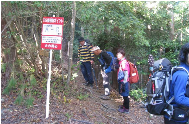
こんな看板がいっぱい