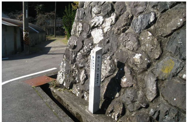
大沢集落右折(いざ糺迦岳へ)