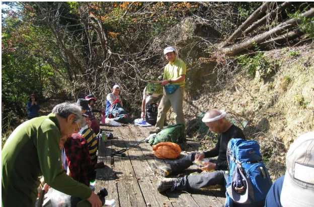
倒木樹林帯を抜けての展望台(昼食)12：00