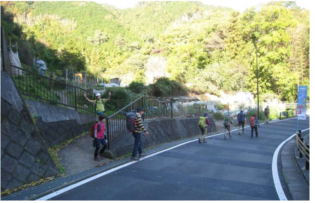
尺代集落の府道に合流