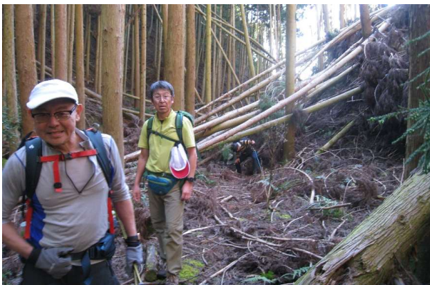
倒木樹林帯(前進あるのみ)