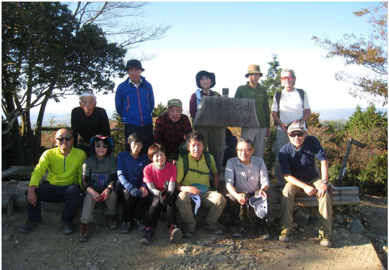
どこや? 時刻14:30 ポンポン山頂(13名全員集合)