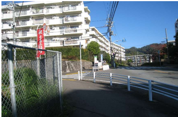
若山台(左折):道迷い有