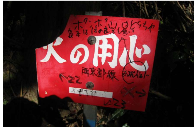
×の右折へ進む(正解)