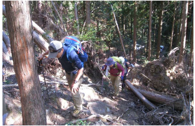
林道分岐点を左折(急登)