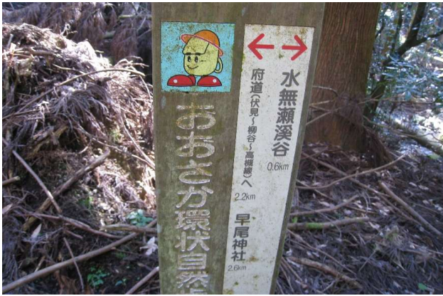
ここはどこや？時刻10：53