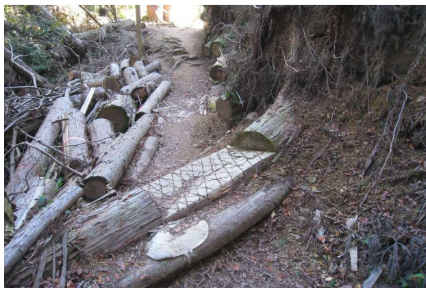
倒木撤去跡(素人には無理)