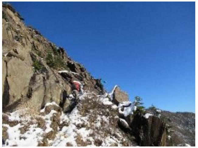
前赤石山の巻道。でも結構険しい