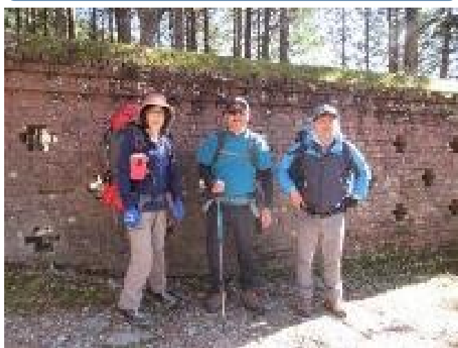
別子銅山遺構 レンガの壁が残るのみ