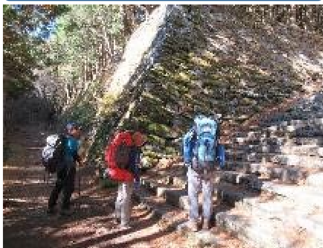
夢の跡 栄えたのは遠い昔