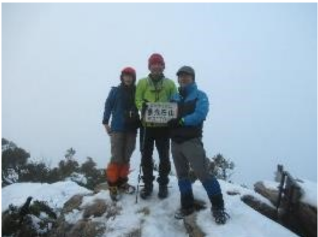
ガッスガッスの中、登頂しました