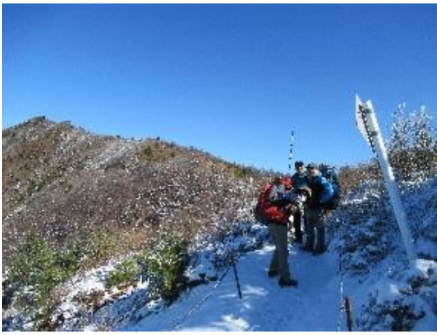
赤石ブルー 気持ちの良い稜線歩き