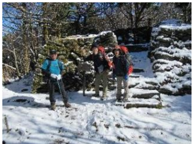
銅山越 愛媛でも降雪がありました