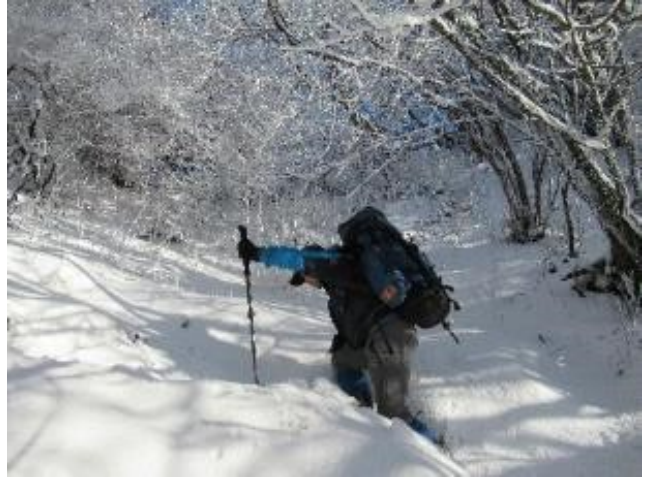
こんなに積雪があるとは思わなかった