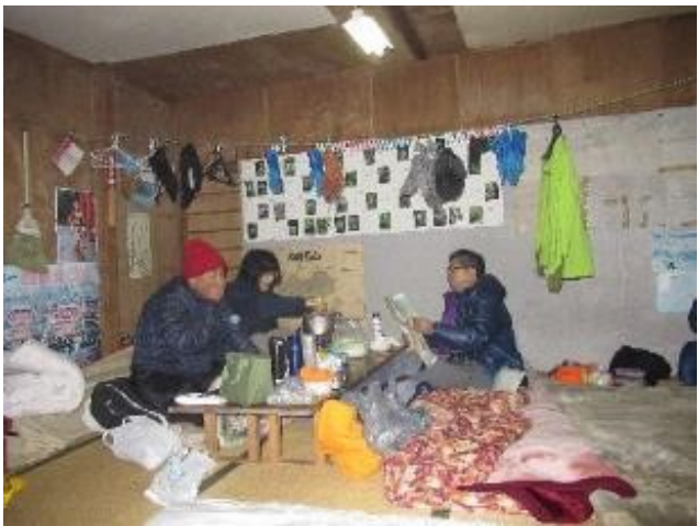
長い歴史の赤石山荘、今夜で小屋締めです