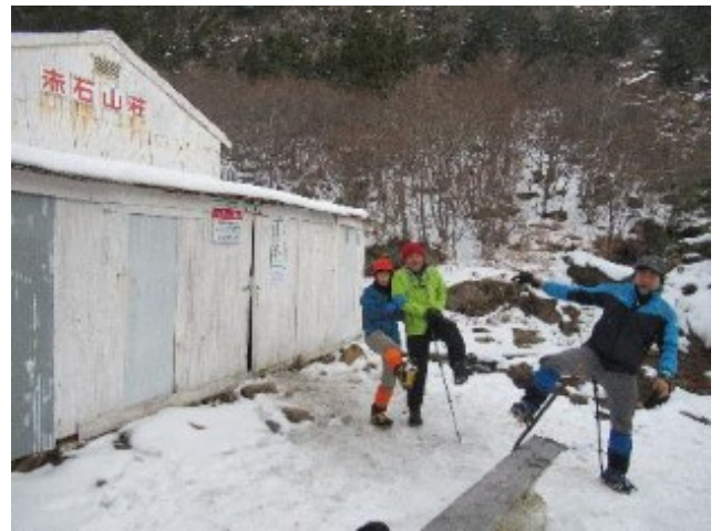
これはアイスダンス？アイゼン装着