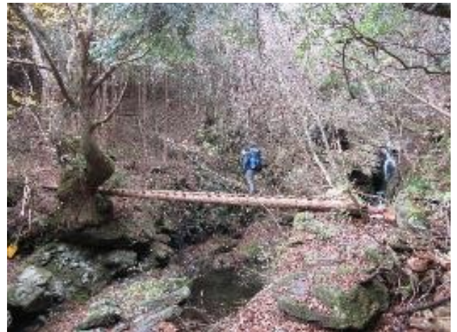
下山路もアスレチックなコースです