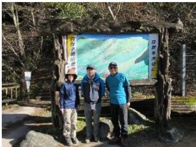
日浦登山口。さあ、登るぞー