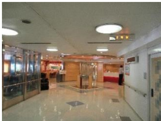
オレンジフェリーで移動。揺れがすごい

12/1 6:52 山荘 ～ 7:40 東赤石山(ピストン) ～ 12:00 筏津登山口 ～ 12:47 別子銅山駐車場 ～ マイントピア別子で食事・入浴 - 15:45 出発（松山道徳島道淡路縦貫道経由） ～ 19:40川西池田駅着