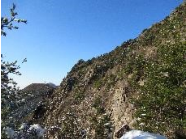
振り返ったところ。ほっとした