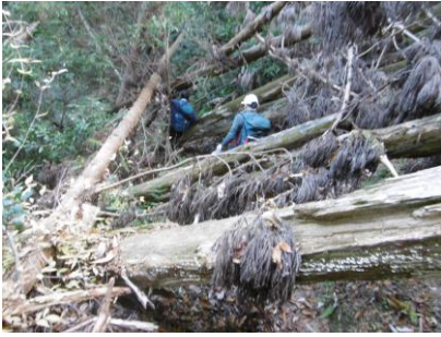
⑩ 古い倒木をかいくぐって進む