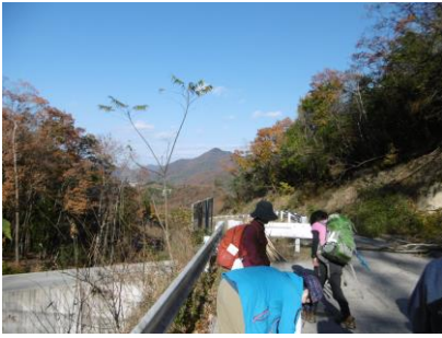
⑬ ティータイム後出発 (遠くに大船山が見えています)