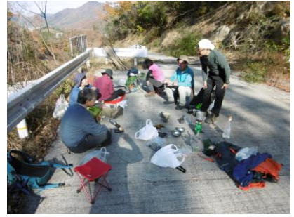
⑫ 林道でティータイム