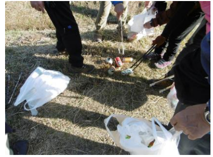
⑮ 道路脇で分別 (燃えるゴミ 2 kg、缶 1 kgでした)