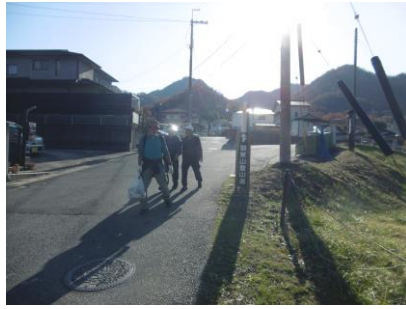
⑭ 集落まで下りてきました