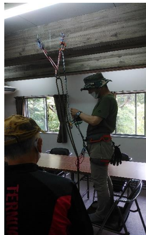
懸垂下降のセットを説明