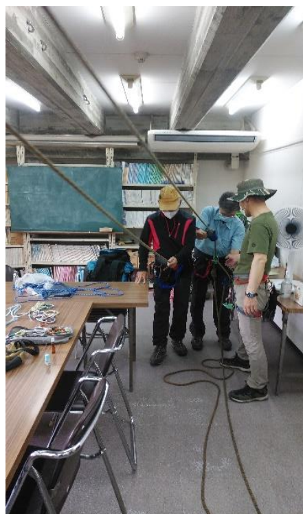
トップロープビレーの練習