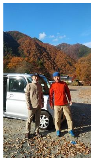
菅の台駐車場にて②