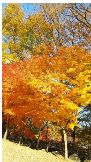
菅の台駐車場にて①