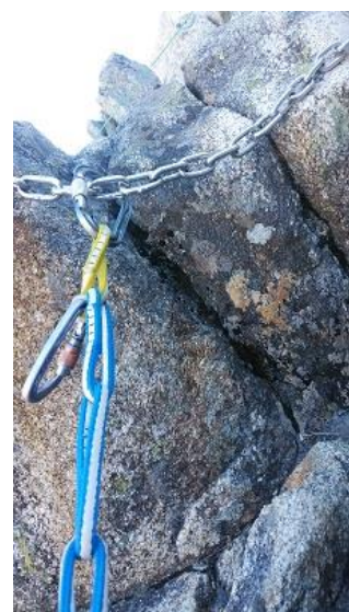
鎖を使ってセルフビレー