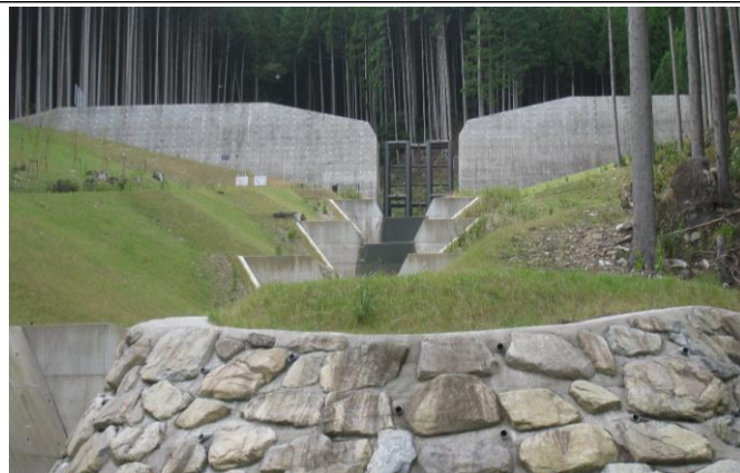
PS: 岩座神地区にある透過型砂防堰堤 (いいねえ)