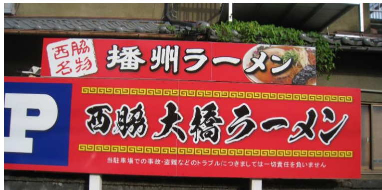
追記：西脇では、誰もが知る超有名なラーメン屋さんです。