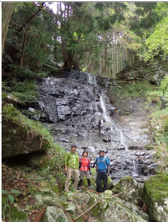
雄滝です(知らんけど)