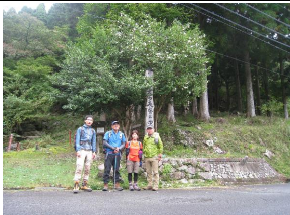
三谷コース登山口

前半の三谷コースは、溪流沿いの道で雨の場合、岩が濡れ嫌なルートになりそうです。今回は何とか免れました。尾根筋に入ると杉林の急登になります。下山ルートは、溪流沿いの岩場を避け岩座神コース(ほぼ全て杉林の作業道)、麓に下山してから駐車場まで町道(ほぼ登り)を歩く。