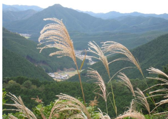
こんな景色でした。