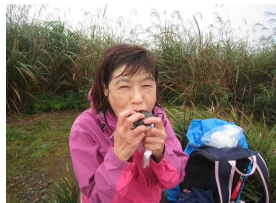
美味しそう (ちょっと寒い)