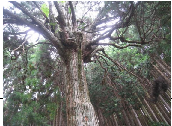
枝分れしている杉、全国で確認されている2本の内の1本らしいです。