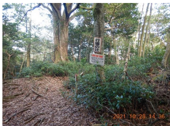
23. 無事行場の辻に帰ってきた