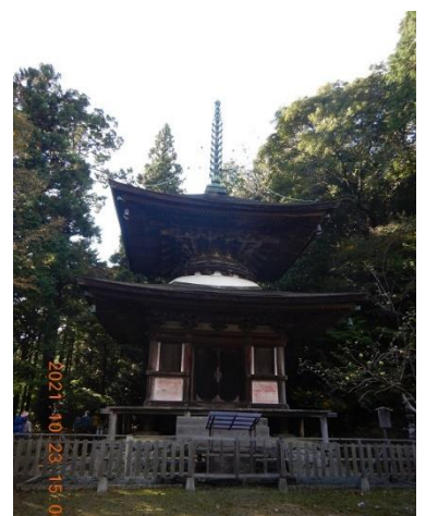
24. 重要文化財の多宝塔