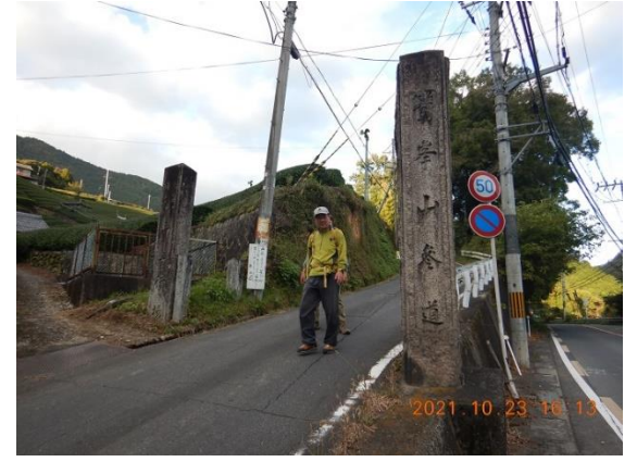
30. 原山バス停に到着。しばらくしてバスに乗れるはずだったのに...