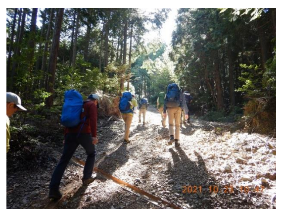
3. 金胎寺までは単調な登り