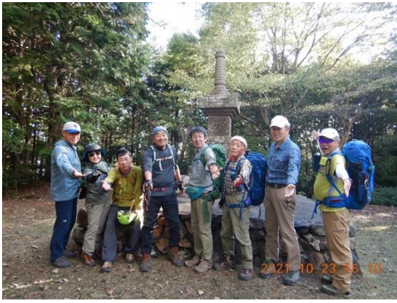
25. 鷲峰山山頂でダークダックス