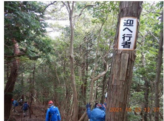
9. 所々に色々な名前が付いている