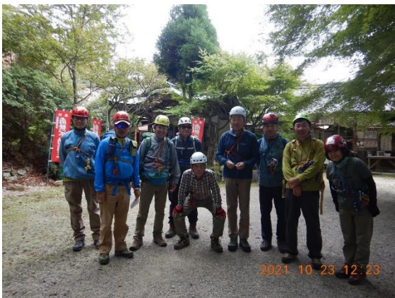
7. 準備を整えて行場へ出発