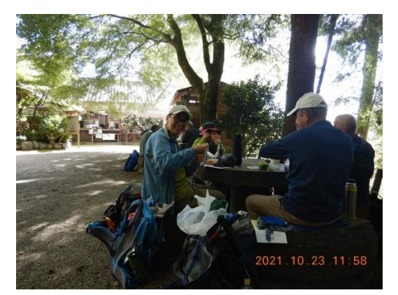
6. 先ずは腹ごしらえ