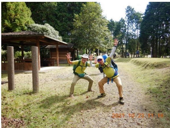
4. 東屋に怪しい二人組