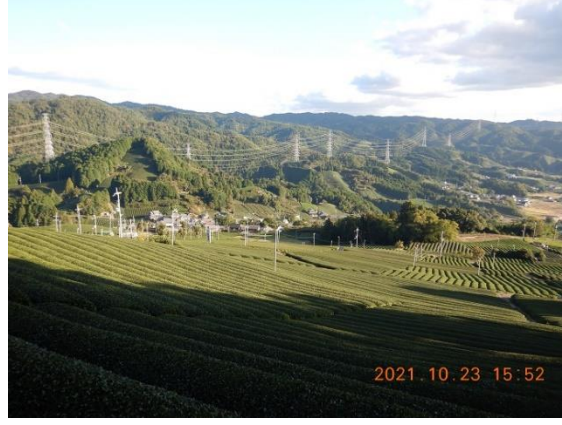
29. 見渡す限り広がる茶畑