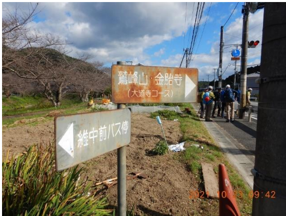
1. 準備体操を終えて出発

この辺りはお茶の産地で、下山した和東町は見渡す限り茶畑が広がるともいいた所でした。