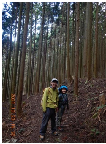
26. 杉の木立が美しい下山道