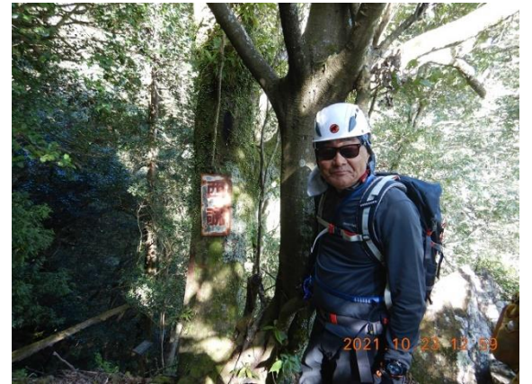
12. 工事現場のおっちゃん出現