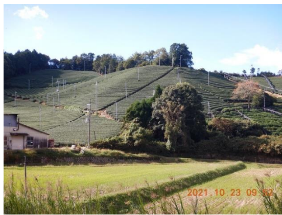
2. 宇治田原に広がる茶畑