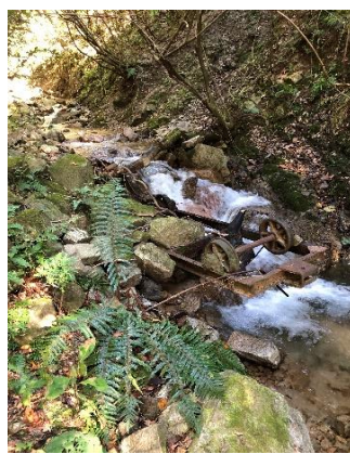
③謎のトロッコ台車