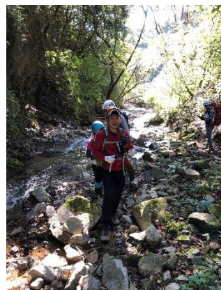
④数ある渡渉のルート探し