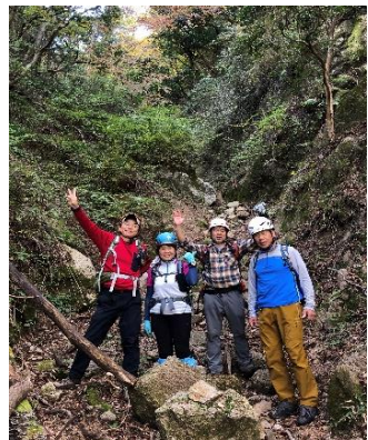
⑭最後のガレ場登り