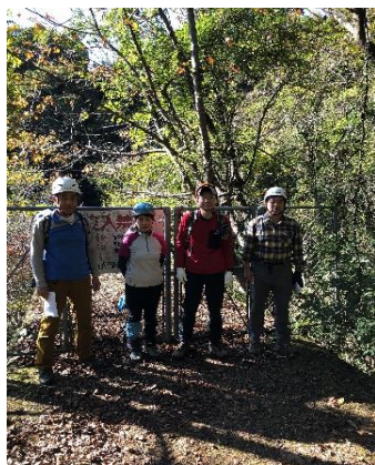
②最初の西滝が谷堰堤