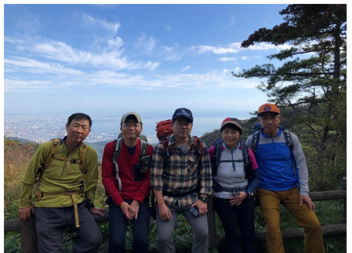
⑮ 全員無事登攀終了