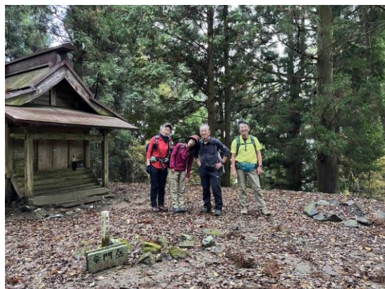
5. 竜門岳山頂に到着。少し先に展望が開けた所があるが、ガスっているし、寒いのですぐに下山。