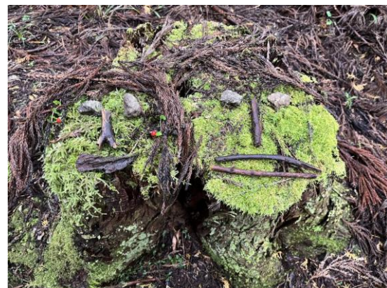
6. 切り株で夫婦の顔を描いてみました。奥さんはイヤリングをしている。