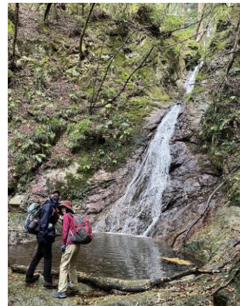
3. 竜門の滝。見返り美人だそうです。