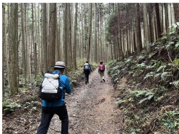
2. しばらくは林道を歩く。山全体が植林で広葉樹は少なかった。