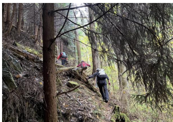
4. だんだんと急な登りになってきた。