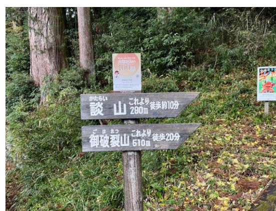
9. こんな標識があったので、山の会としては登らない訳にはいきません。