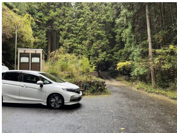
1. 山口神社奥のバイオトイレ前の駐車場に到着。

平日山行で日本三百名山の竜門岳へ。 登山口に向かう途中は雨だったが、登山開始前に雨は止み、下山後また雨。 談山神社に到着すると、また雨が止む。 山全体は植林で覆われている。山頂では風が強くすぐに下山。 下山後、近くの談山神社に。紅葉は少し早かった。山の会なので、談山、御破裂山にも登る。