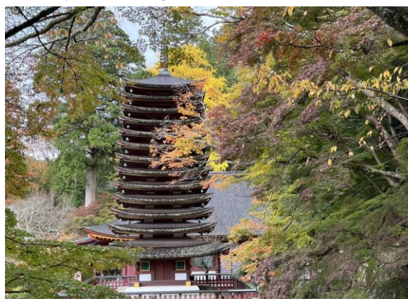
8. 下山後、車で近くの談山神社に行く。