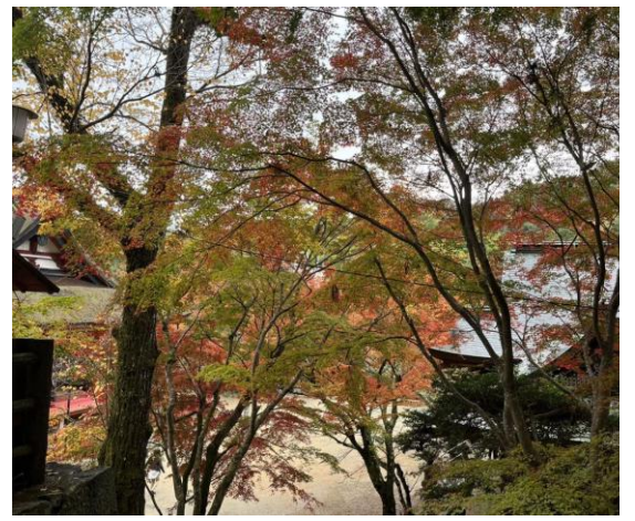
12. 境内を散策、神社前のお店でお土産を買って帰宅の途に。