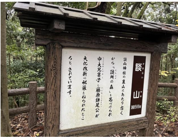
10. 談山（かたらいやま）山頂。