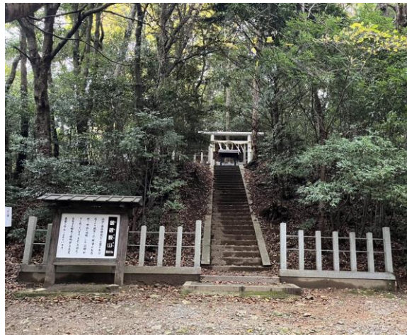
11. 御破裂山。山頂に藤原鎌足のお墓がある。