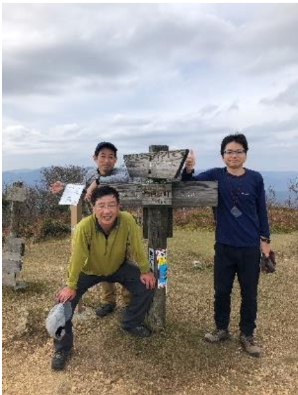
目的 蛇谷ヶ峰到着 3人とも大満足