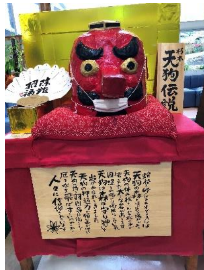
天狗伝説 ゆっくり温泉につかりビールで乾杯