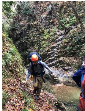
不安定なトラバース