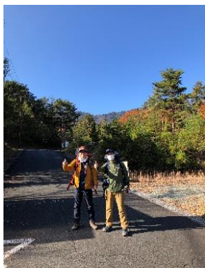
準備整えいざ出発