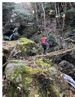
朽ちかけた丸太橋