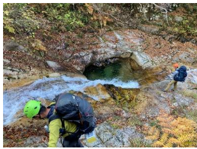
ビビリながらの渡渉