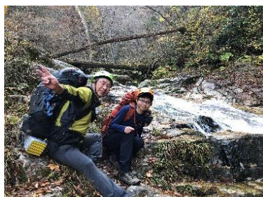
滑滝でホット休憩