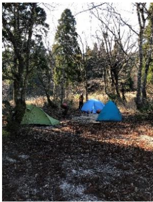
テント設営 キムチ鍋で宴会