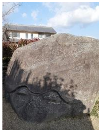
8. 謎の石造物「亀石」 いわれはあるがまだまだ不明なことが多いという