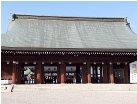
1. 橿原神宮の後ろには畝傍山が構えている

今年最後の平日山行。 橿原神宮の広大な境内の中を歩いて畝傍山登山口に向かう。 畝傍山山頂からは耳成山、天香久山が間近に見え、金剛・葛城山系もくっきり見えた。展望もよくイスやテーブルもあり落ち着ける所だ。次に向かう甘樫丘は、「国営飛鳥歴史公園」の中の一つで、特に甘樫丘展望台からの眺めは素晴らしかった。古代史の舞台となった藤原京跡や大和三山、金剛・葛城山系、二上山も一望することができた。ここは蘇我氏の邸宅もあったそうだ。説明版もあってとても丁寧だ。展望台の他に「万葉の植物園路」があって40種類の植物がクイズ形式でまわられるようになっている。今回はその一部を歩いた。そのあと謎の石造物の一つ「亀石」を見て岡寺駅に向かった。