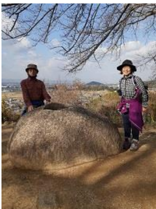
7. 甘樫丘展望台 後ろの小さい山が耳成山