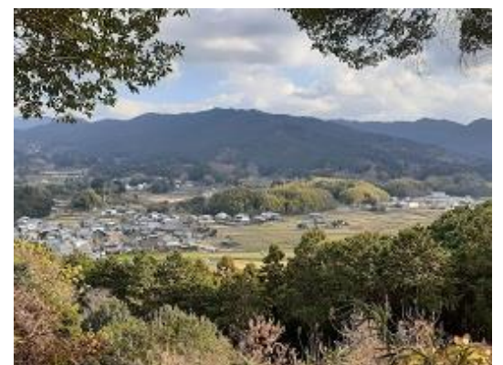
6. 甘樫丘展望台 左の方に飛鳥寺と飛鳥宮跡があるが木で見えない