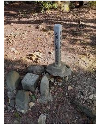
3. 畝傍山山頂 三等三角点