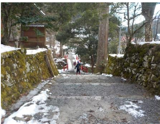
17. 明王院の前を通り、坊村の駐車場へと向 かう