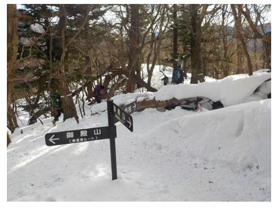
15. 夏道ルートとの合流点に到着