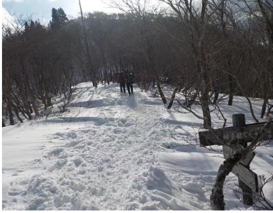
13. ワサビ峠を通過し、御殿山へと進む