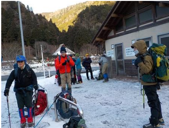
1. 坊村の公衆トイレ前で出発の準備をする

新年の雪山泊山行はコロナ禍の中で中止となり、今回の日帰り武奈ヶ岳山行に多くの会員が集中した。日本列島を覆う寒波により日本海側の豪雪が報道される中、山行を実施したが、坊村までの積雪、凍結状況は大したことはなかった。山行は計画どおりの行程で行えたが、予想に反して積雪量は多くなく、ラッセルを楽しめるかと思っていたがラッセルすることもなく、何か肩すかしの思いを持った。しかし、比良の素敵な雪山山行は楽しめた。だが、あまりにも多くの登山者がいて何か興ざめた緊張感のない思いもした。