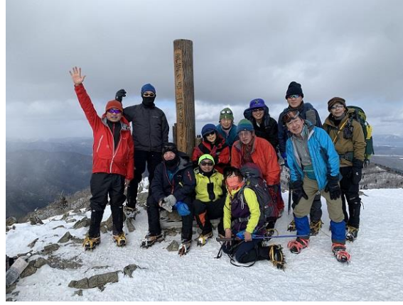
11. 頂上に到着 全員集合