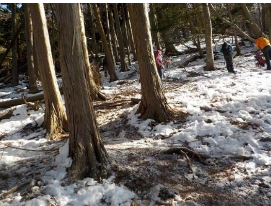
4. しばらくは積雪状況はこのように多くない