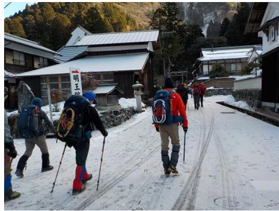
2. 登山口の明王院へと向かう