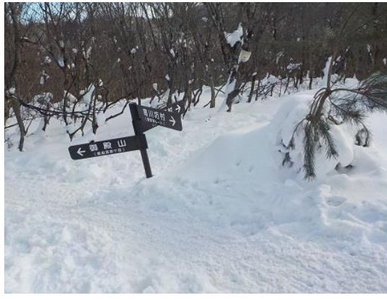
14. 雪道ルートと夏道の分岐、ここからまた雪道ルートへと進む