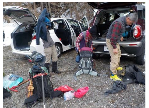
18. 無事下山、駐車場に到着した。 参加のみなさん、お疲れ様でした。