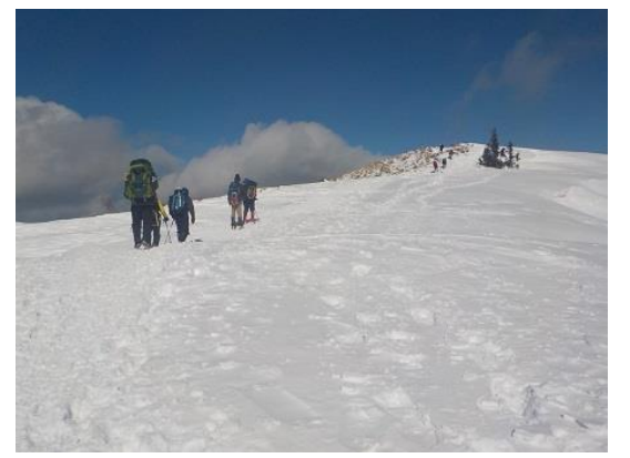
9. この西南稜の雪の景観 今回も素敵でした