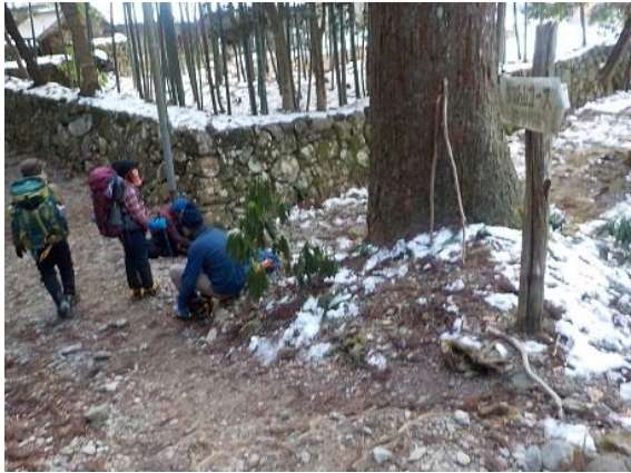
16. 急な下りを経て明王院に到着し、アイゼン をはずす