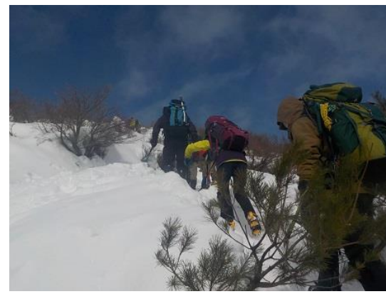
8. この雪山景観、これぞ冬の武奈ヶ岳来て良かったと思った