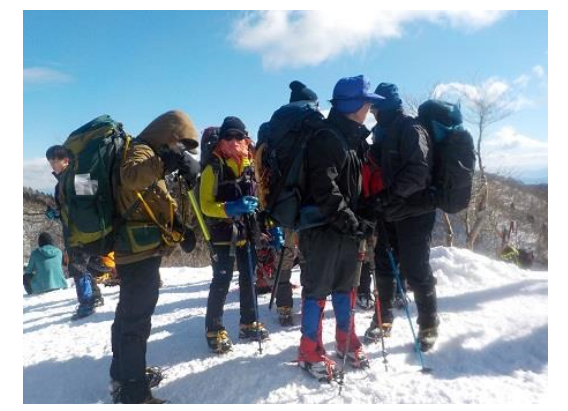
6. 御殿山に到着 何が御殿なのか？何でもない小ピークである