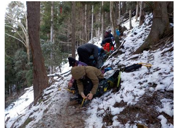
3. 登山口から上がってすぐのところが凍結しており、早速アイゼンを装着する