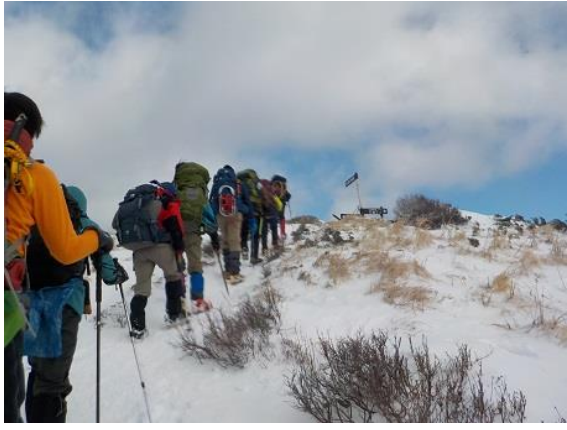
10. 武奈ヶ岳の頂上はもうすぐ