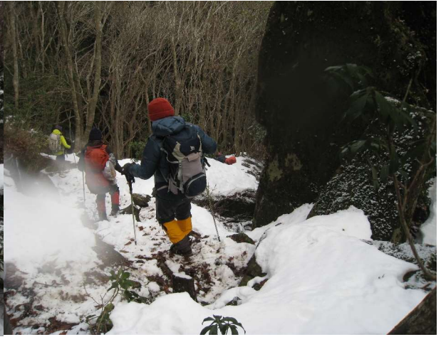
杉谷登山道の急坂