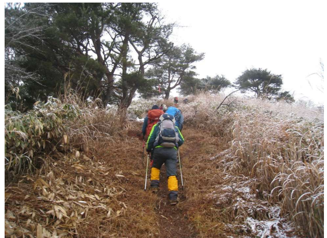
ようやく尾根筋へ