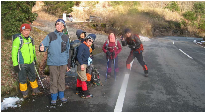
駐車場に到着(ご苦労様でした)