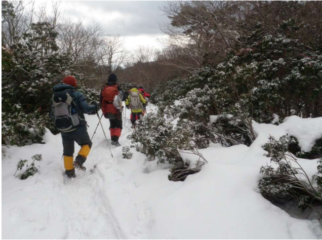
杉谷登山道を下る