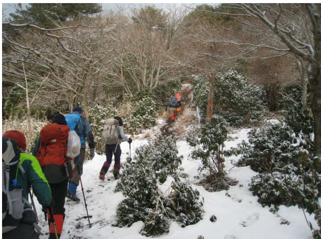
雪が積もっています (1)