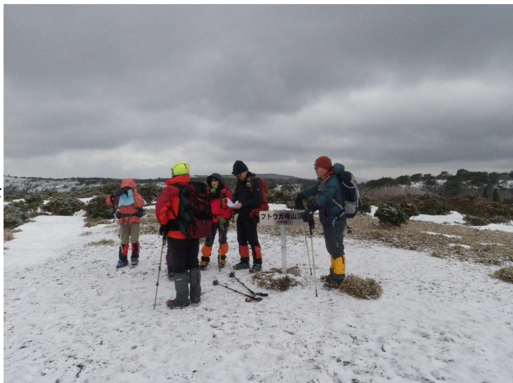
フトウガ峰到着 (段ヶ峰を断念し下山することに決定)