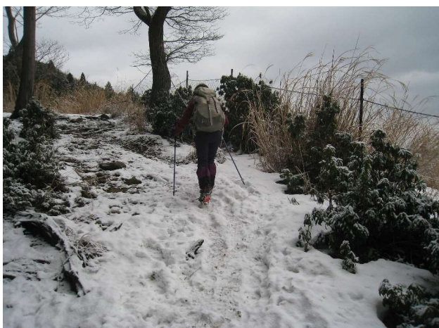
雪が積もっています (2)