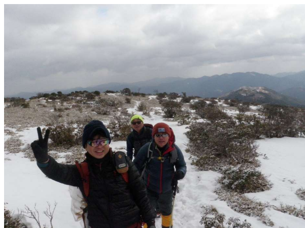
草原 (やっぱり寒い)