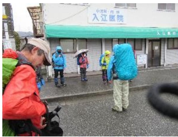
一般受講生も3名参加しています。