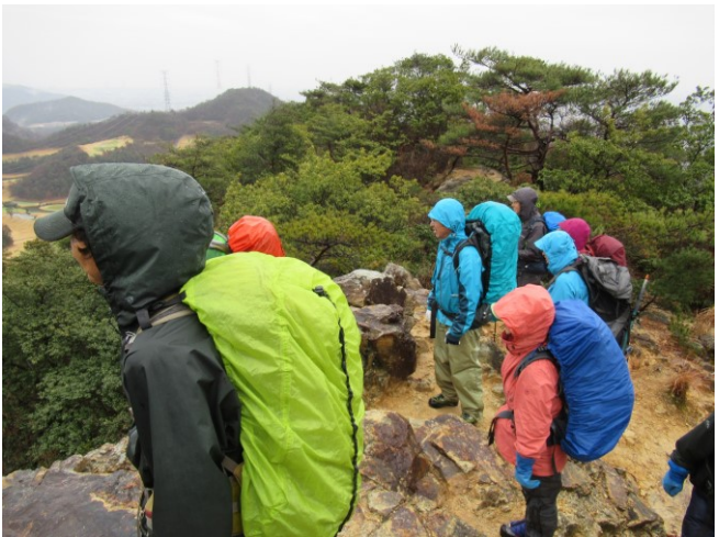
雨ですが、しばし眺望を楽しむ