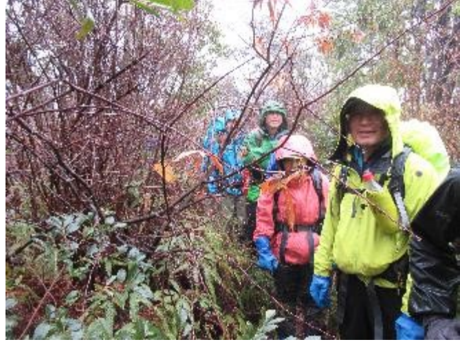
万願寺西山四等三角点