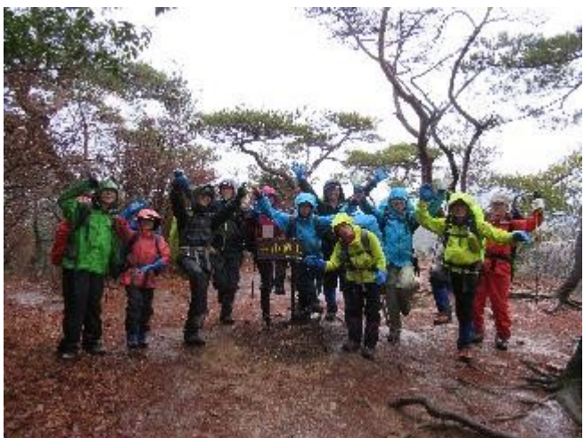
はい、グリコ！中山最高峰。