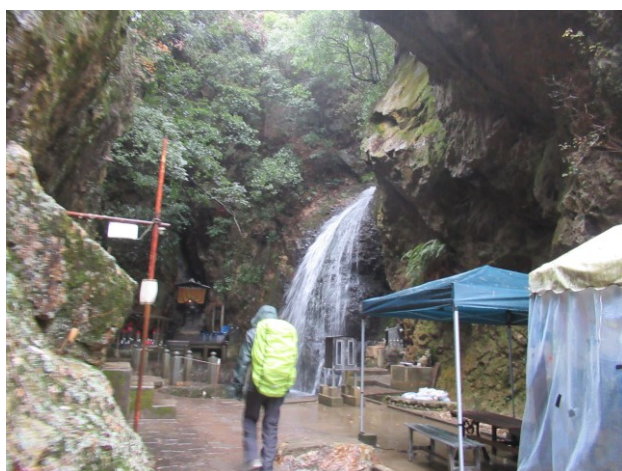
雨の中、最明寺滝に到着。