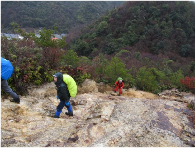
やはり雨のためツルツルです。