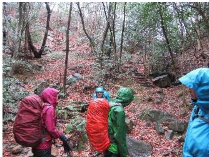
後半になって雨脚が強まってきました。 今回はテント設営は無しとしました。