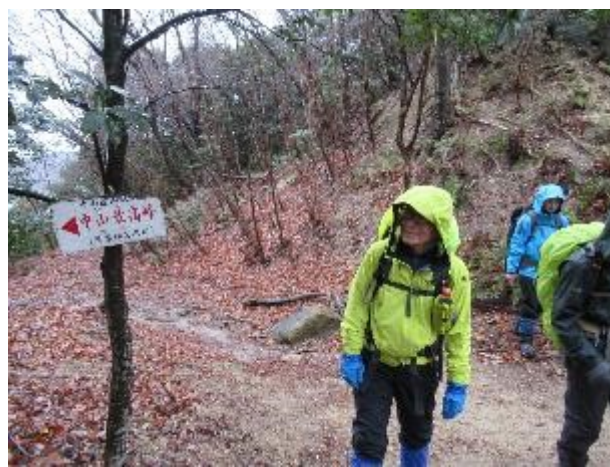
宝塚ロックガーデンの登り口