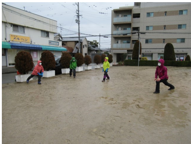
雨ですが、準備体操。念入りに。

9:00 阪急山本駅集合 ~ 9:25 出発 ~ 9:46 最明寺滝 ~ 11:15 万願寺西山 ~ 11:45 ランチ ~ 12:05 出発 ~ 12:16 三日月岩 ~ 12:56 中山最高峰 ~ 15:30 中山寺解散