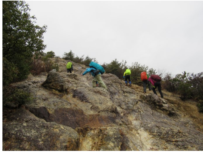
雨ですが、ガシガシ登ります。