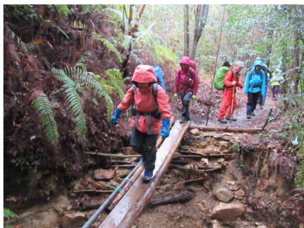
ボッカをしているので、ちょっと不安な木橋。でも大丈夫。