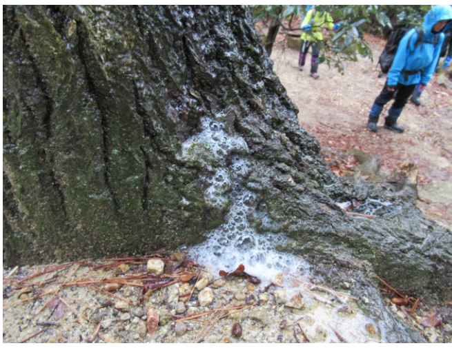
松の木から泡吹いてました。 これが樹幹流でしょうかね。