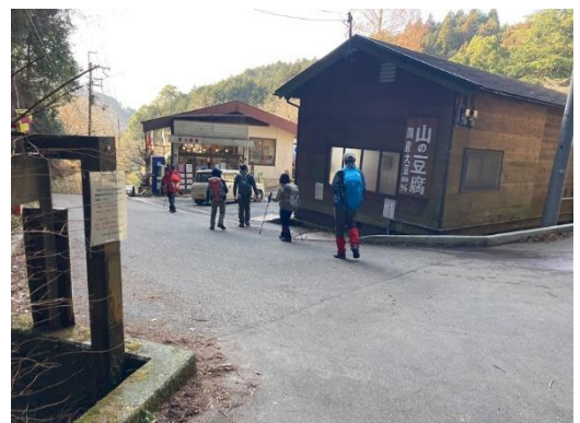
無事登山口に帰着