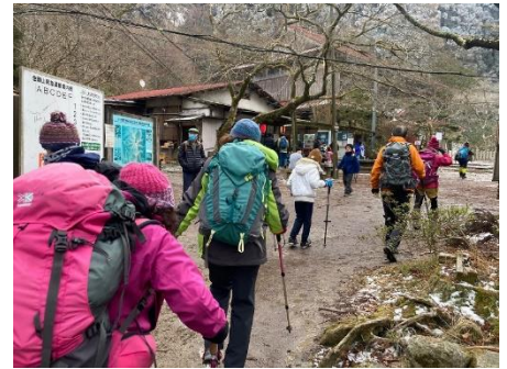
山頂広場周辺の人込み