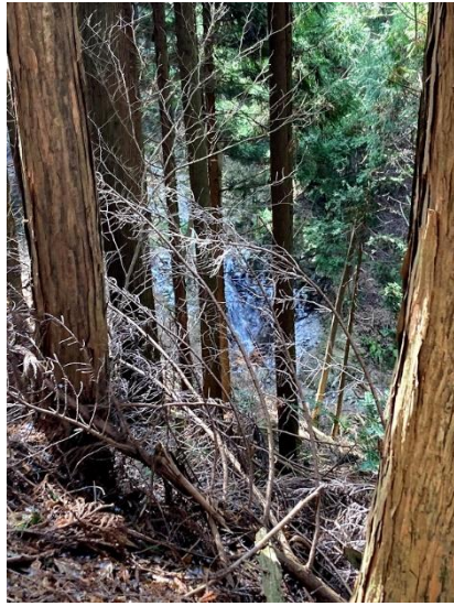
下に見える腰折滝の脇に行く予定 だったのですが