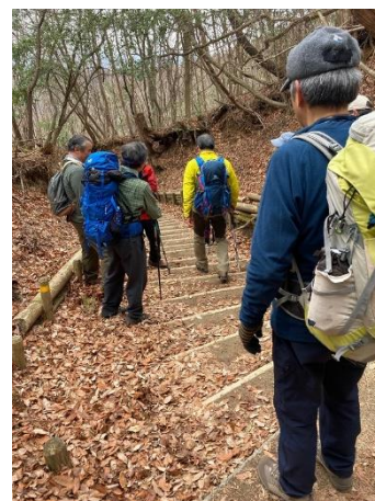
千早本道の下り 延々と階段が続く