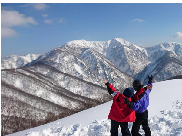
7. 右の人、スキー板は今シーズンに買い替えましたが、ウェアは35年前のもの。