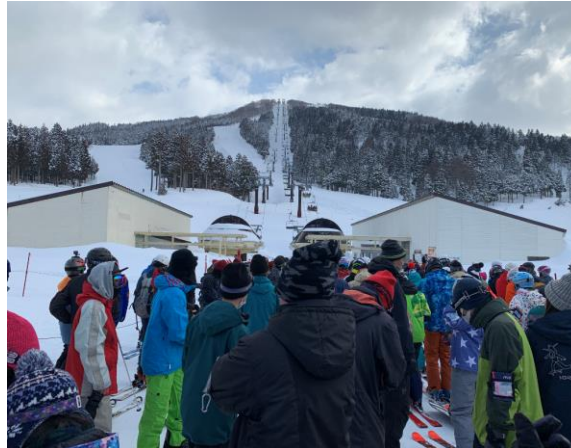
2. こんなにリフト待ちをするのは久しぶり。