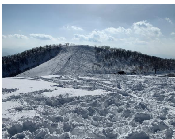
8. 見えているのが、法恩寺山の本峰。ここにも登りました。