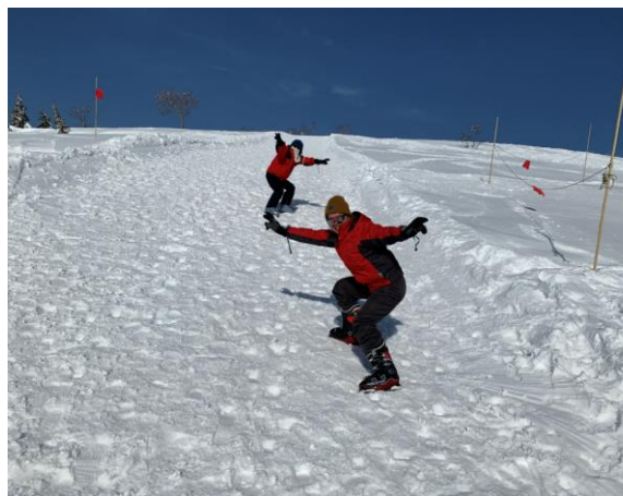
5. スキー板を外して法恩寺山の山頂へ登る。まずは北側のピークの伏拝へ。