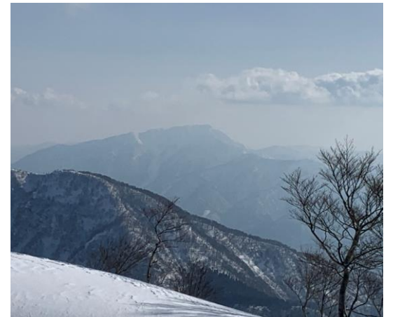
9. 山頂から見る荒島岳です。