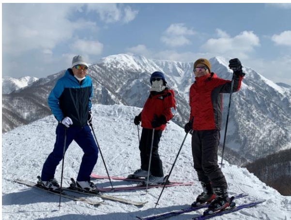
4. 日本三百名山の経ヶ岳をバックに。