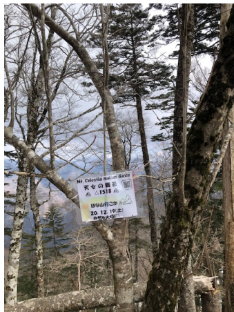
天女の舞から約 10 分で頂へ到着