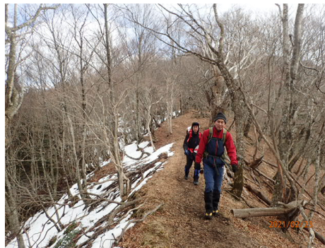
アイゼンもワカンも必要なし