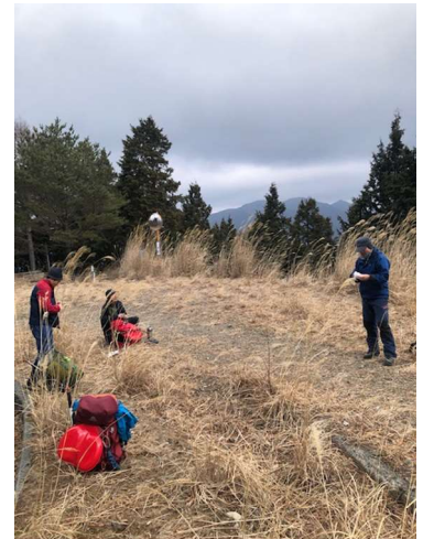
林道へ出てきました