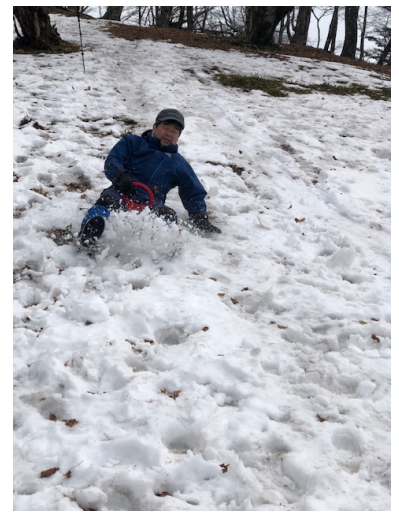
雪は少なくともヒップそりは楽しい