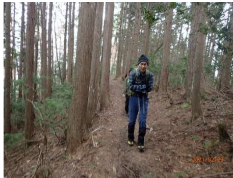
階段多し、結構急登