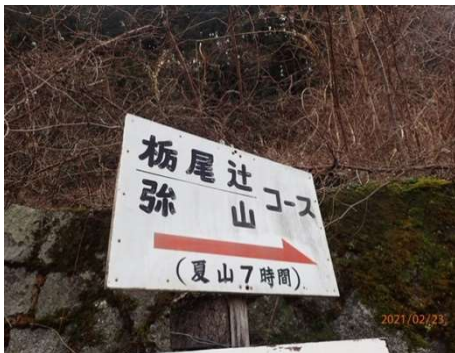
登山口 雪は全くありません

とき : 2021年 2月 23日(火) 祝日 天候 : 曇り時々晴 メンバー : 4名(男性:3名 女性:1名) 大東号 コース 7:15JR 川西駅ロータリー集合 7:20-8:10天川村役場-8:20 登山口- 9:25 林道-11:35 栃尾辻-12:30 天女の舞-13:10 天女の頂-13:40 下山開始 14:30 林道-16:10 天川村役場着-入湯-19:00JR 川西解散