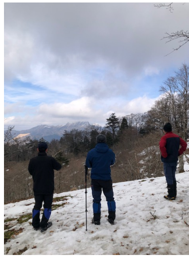
いつかあの山でクライミングを、と 心に決めたOさん