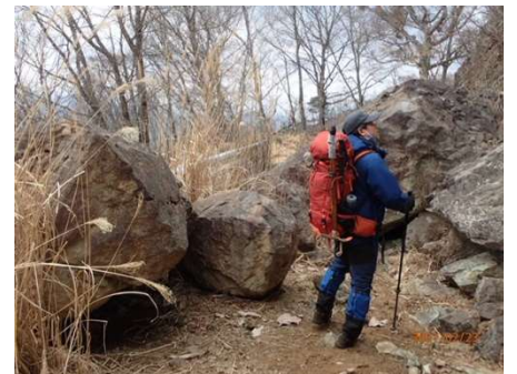
大きな落石が林道を塞ぐ