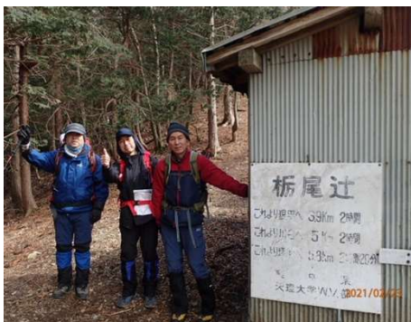
栃尾辻。土間に屋根とトタン壁のみ