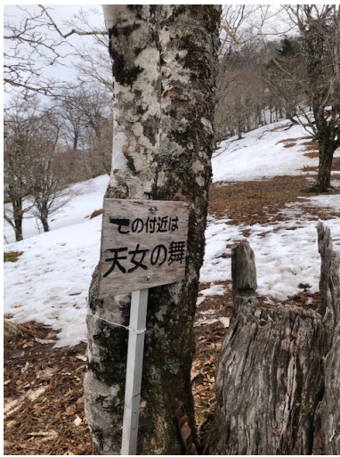
霧氷時は天女が舞う程美しい所