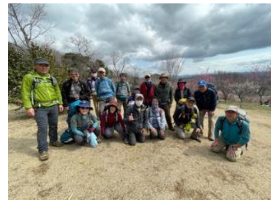
9. 下山途中の展望の良いところで再び全員集合