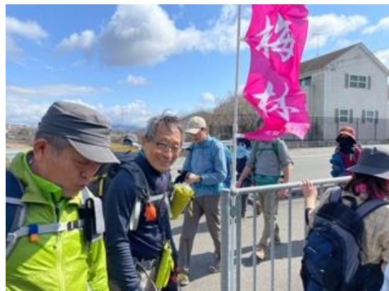
5. 雄岡山から雌岡山へと向かう。暫く車道を歩き、梅林の幟のところから雌岡山へと入っていく