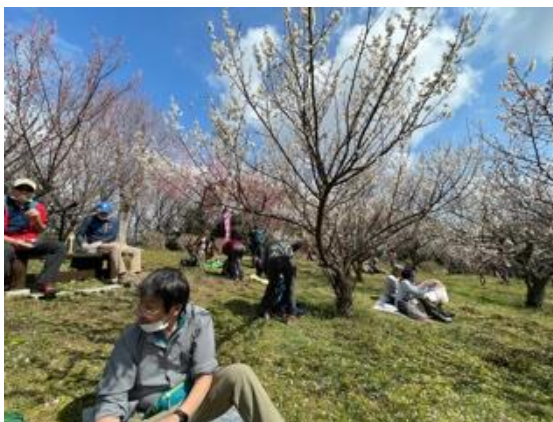
7. 梅林でランチタイム。この日は暖かく、のんびりと梅の花を楽しみながらくつろいだ