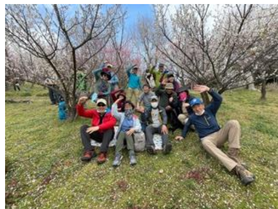
8. 梅の花の下でパチリ