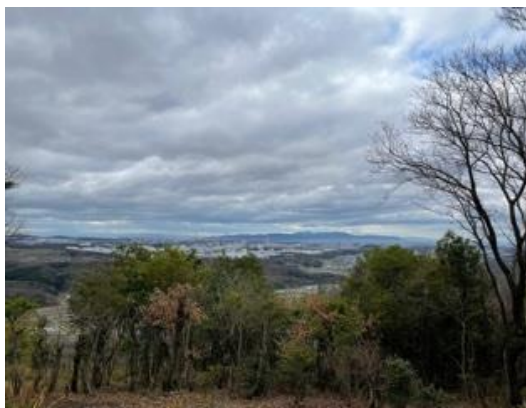
4. 雄岡山頂上に到着。展望はよく明石方面から淡路島がよく見える。もちろん明石海峡大橋も