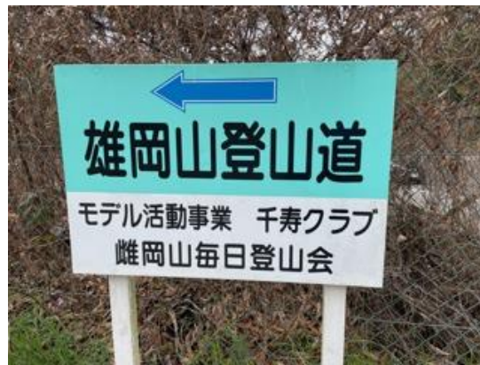
2. 雄岡山の道標が要所要所にある