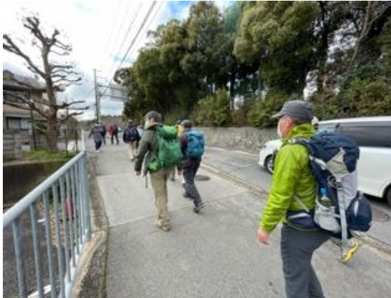
1. 神鉄・緑ヶ丘駅前を出発し、雄岡山をめざす。しばらくは車道歩き

雄岡山、雌岡山は高度差が小さくて楽に登れる上に、頂上からの眺望は良く結構よい山であった。雌岡山の梅林は管理がしっかりしていて、有名な梅林に負けないなかなかのものだった。ワイン城は昔と随分様子が変わっていたが、ワイン城の手前にできたJAの直売所では、みんな買い物できて喜んでた。