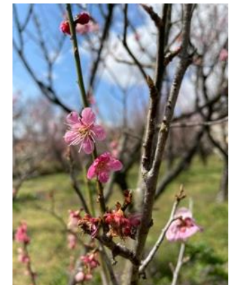
6. 梅林はちょうど見頃であった。薄い色の紅梅が美しい