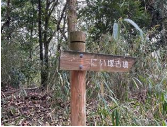
13. ワイン城(農業公園)をめざし下っていく。途中、にい塚古墳の道標が