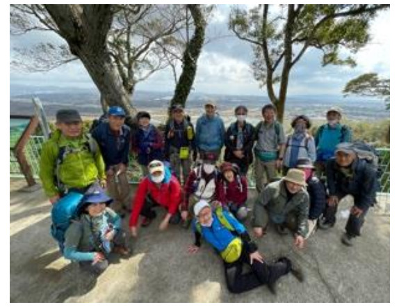
12. 明石方面をバックにまたパチリ