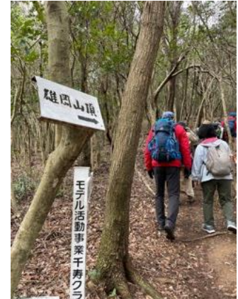
3. 頂上めざし、樹林の道へ入っていく