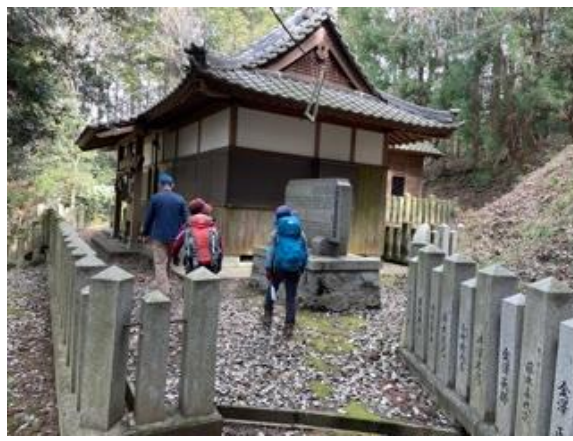
11. 暫く休憩の後、少し下って裸石神社へ参拝する。ここには男性のシンボルが祀ってある。これには完全に負けた！