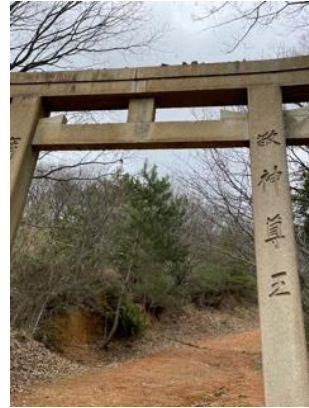
14. 神出神社の大鳥居 ここから先は車道歩き