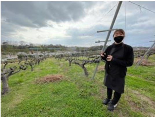
16. ワイン城に到着後、ワインの試飲の前にワイン製造の過程の説明を受ける。ここは園内のブドウ畑 ワイン城で買ったワインでお疲れさん会をして解散となった