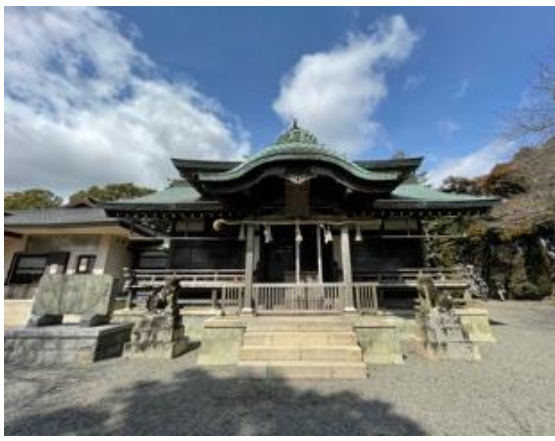
10. 雌岡山頂上の立派な神出神社に到着