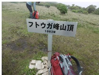
フトウガ峰(歩荷解除)