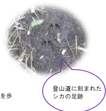
登山道に刻まれたシカの足跡