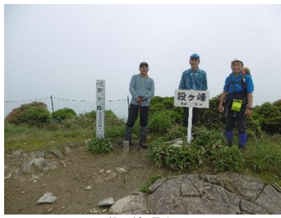
段ヶ峰頂上 (撮影後昼食)