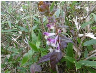
登山道わきに咲いていた花(名前はわかりません)