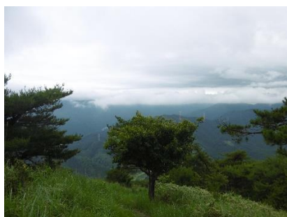
達磨の肩より下界遠景