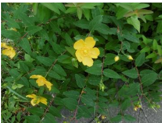
林道道わきに咲いていた花 (名前はわかりません)