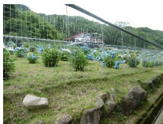
あじさい園(きれいでした)