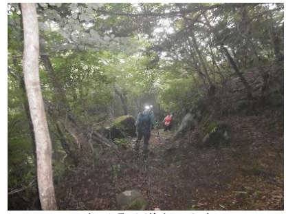
杉谷登山道を下山中