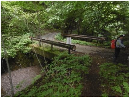
杉谷登山口(林道出会)

(クマにも遭遇せずヒル被害にもあわず無事下山。ここより車のところまでひたすら舗装された林道を歩