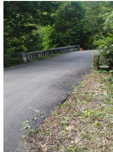
入溪地点の東山橋