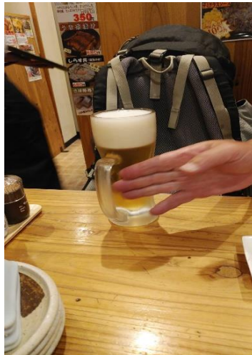
新開地で乾杯ビール