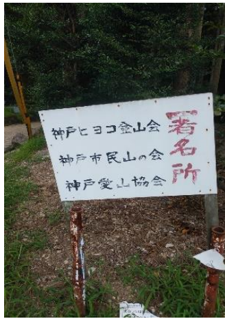
登山口近くの標識?