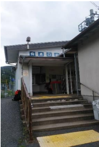
神戸電鉄 有馬口駅