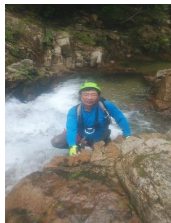
気持ち良く川遊び