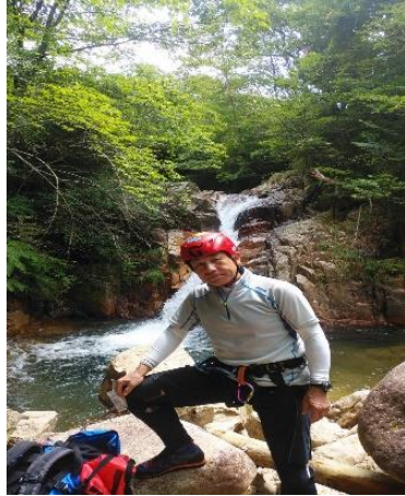
猪ノ鼻滝で師匠のポーズ