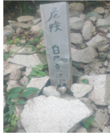
危険 自己責任の案内標識