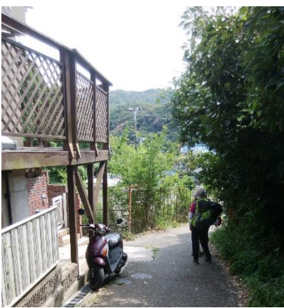
高取山下山ここから市街地へ