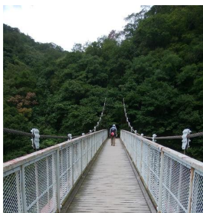
鍋蓋山下山⇒菊水山へ