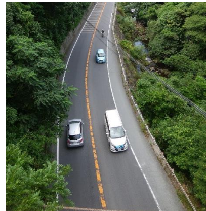
同左吊り橋より眼下の道路