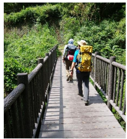
菊水山下山 石井ダム前の橋