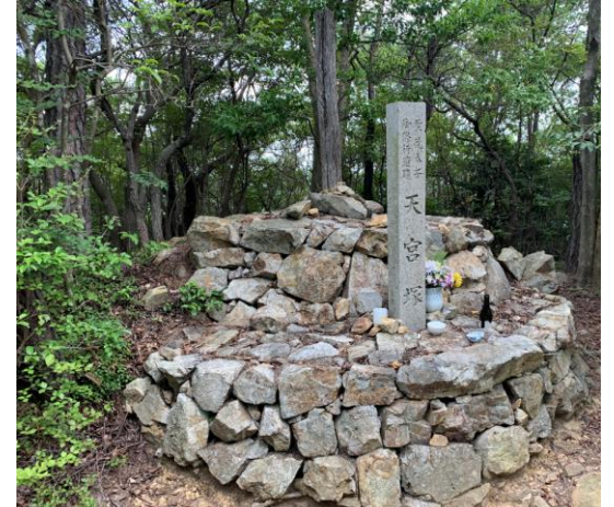
6. 聖徳太子修行跡の天宮塚。 大阪平野が一望出来る。