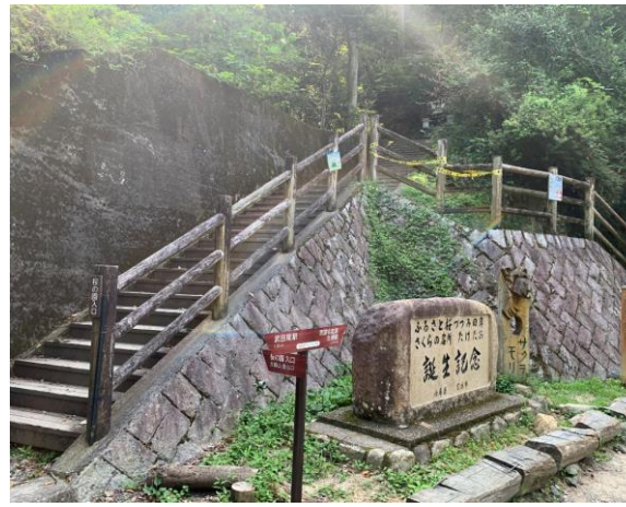
2. 桜の園。ここから登りが始まる。