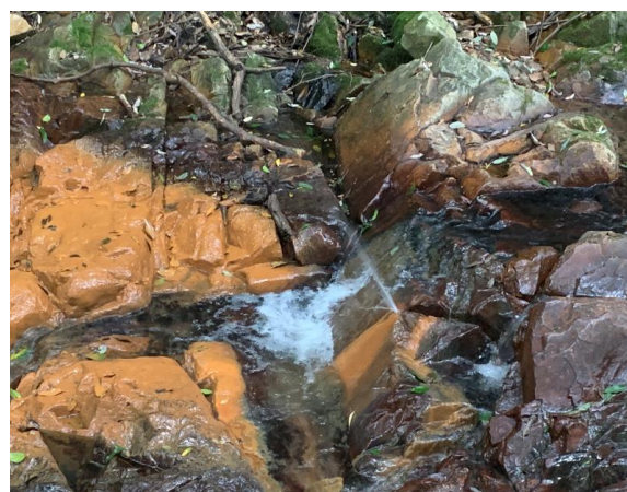
8. 今日噴水が勢いよく出ている。