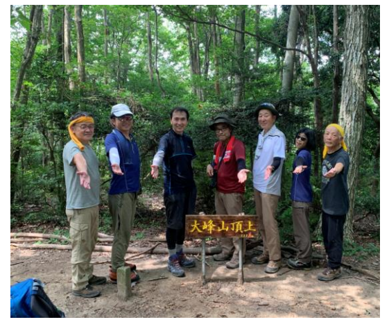
3. 大峰山山頂に到着。 尾瀬で若者に全く通じなかったダークダックスのポーズで。