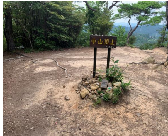
5. 中山山頂に到着。いつもは多くの登山者で賑わう山頂だが、今日は暑さのため、他に1組いるだけだった。