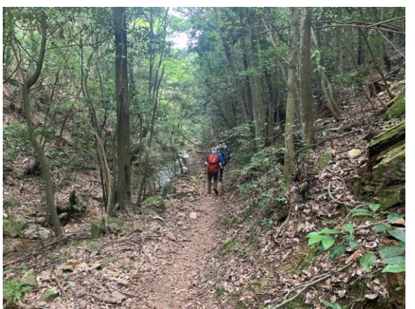
7. 沢コースを降りる。