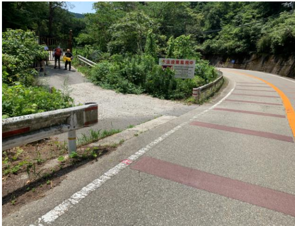
4. 一度車道に降りて、中山に登りなおす。