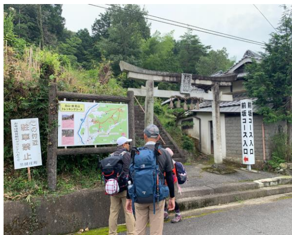
前坂コース入口から登山開始。