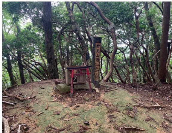
妙見山山頂。展望は無い。 白山も妙見山も標高最高地点が山頂ではないのが不思議に思った。