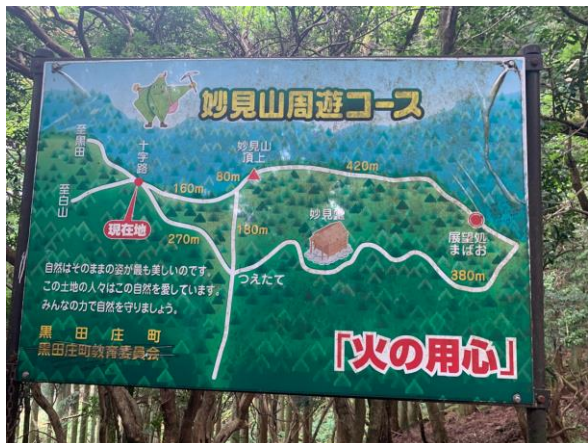
十字路から周遊コースを行く。