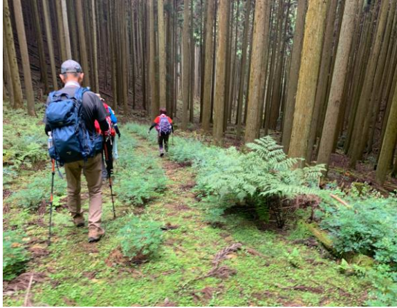
靴の中敷を敷忘れた人は、さぞかし下山が辛かったこととお察しします。