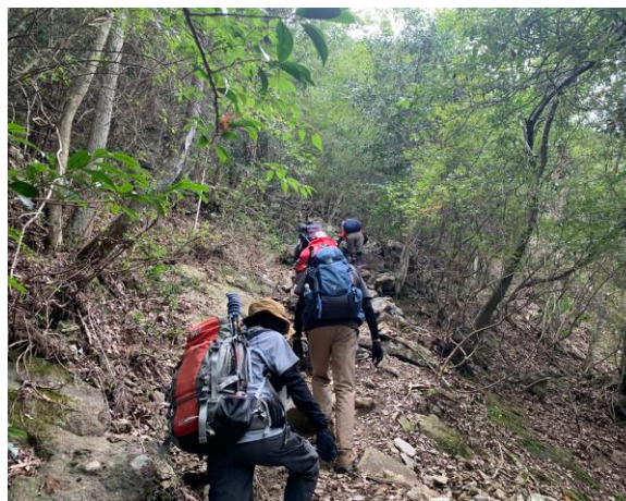
だんだんと傾斜が増してくる。