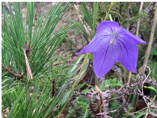
桔梗が一輪だけ咲いていた。