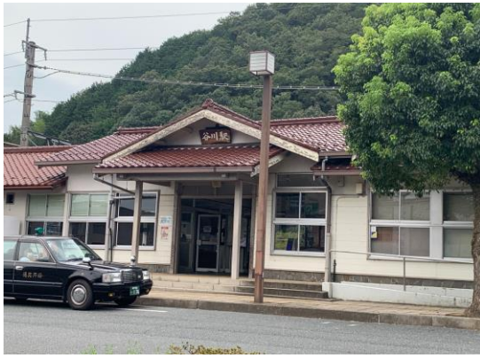
JR 谷川駅に到着。 ビールを買おうと思っていた人たちはどこにもコンビニなどが無いことに、かなりのショックを受けていました。