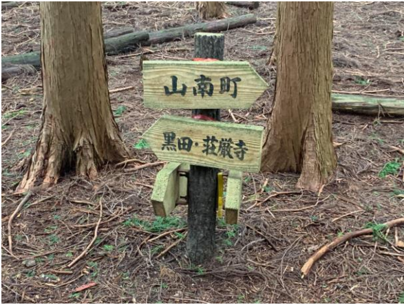
十字路口に戻り、谷川駅方面へ下山開始。