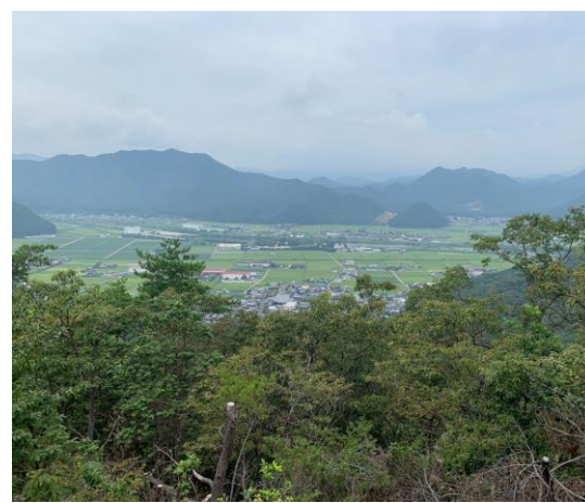
松尾の辻からの景色。