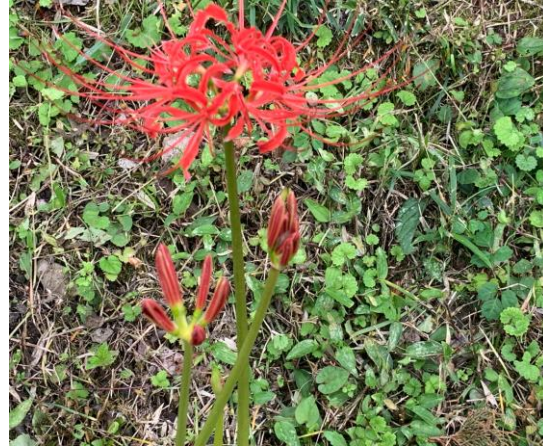
麓に降りてきた。 曼珠沙華が咲き始めている。