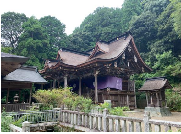
立派な神社があった。 高座神社。本殿は国の重要文化財。