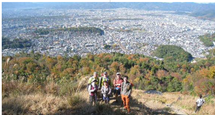
火床からの眺望 (本日の集合写真です)