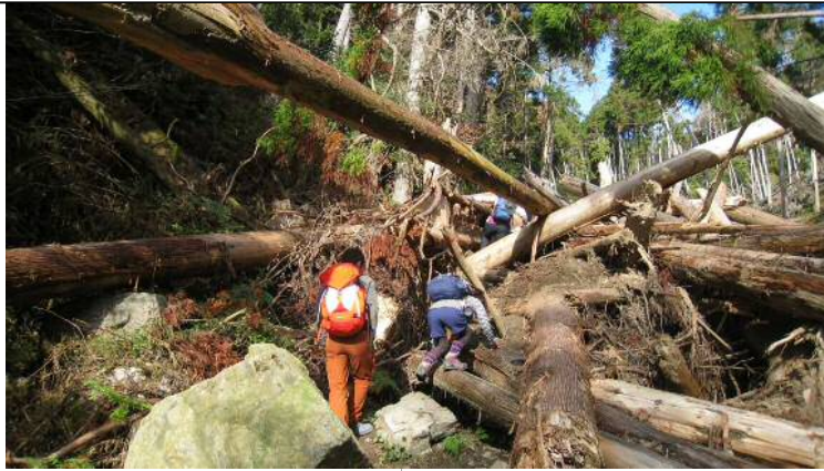
さあ行くぞ (よいしょっと)