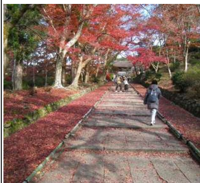
有名な階段です(ちょっと遅かったです)