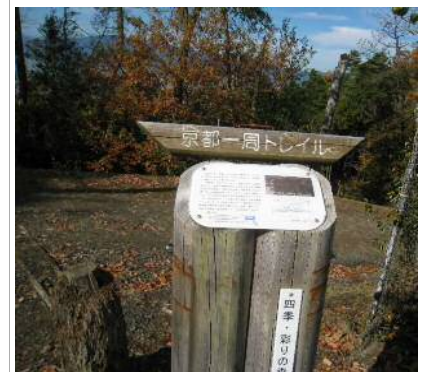
京都一周トレイルのコースにもなってます