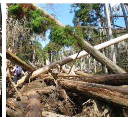
ドカーン 倒木・流木?