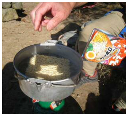
今日は「味噌ラーメン」です