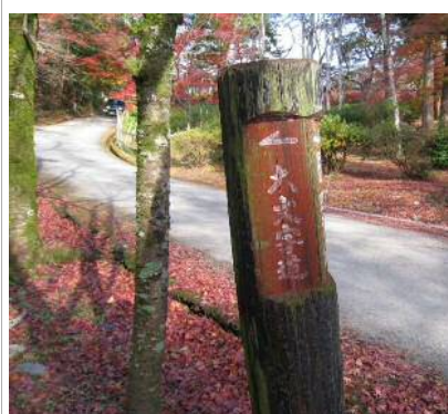
標識にしたがって進む