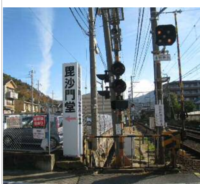
線路沿いに進み毘沙門堂目指し左折