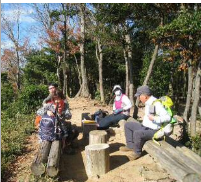
山頂到着 (いい天気です)