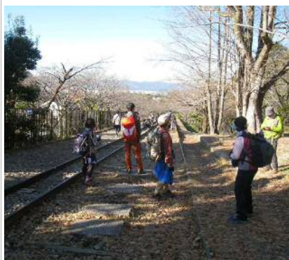
蹴上のインクライン