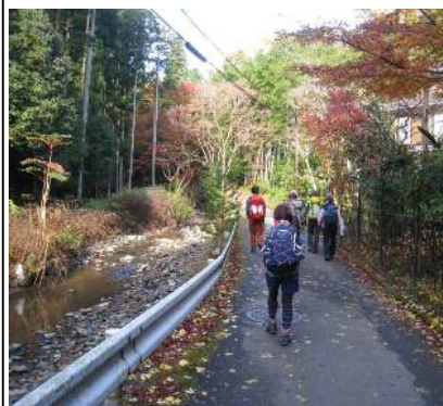
大文字道を軽快に進む