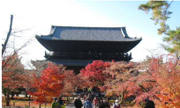
南禅寺の紅葉 (ちょっと遅かったです)