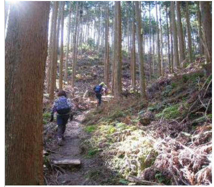
倒木群を抜けました