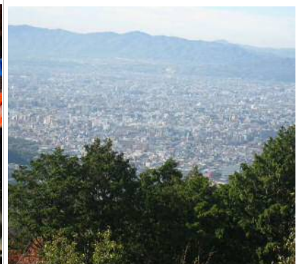
山頂からの眺望です