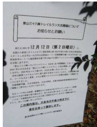
東山三十六峰トレイルラン大会の案内