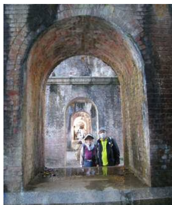
南禅寺の水管橋にて