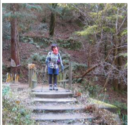
下山しました(この方連ちゃんです)