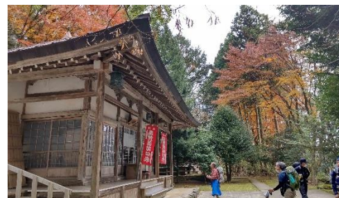
本堂の周りには紅葉が残っていました