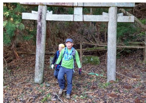
ようやくゴールの鳥居に到着。