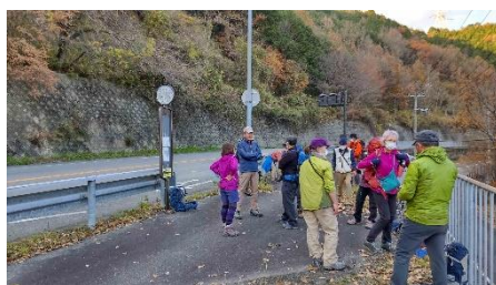
あとはバスを待つだけ