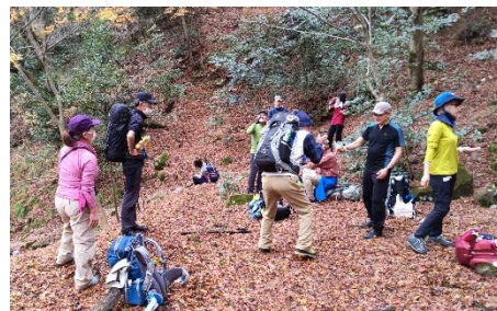
もう少し早ければ紅葉がきれいだった。紅葉の絨毯に秋の名残を味わいました