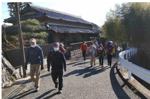
12月とは思えないほどの陽気の中スタート

年末にあたり高代寺山山行と一庫公園での納山会を開催しました。12月とは思えない暖かさで汗をかきながら高代寺山まで。ここから知明湖までは長い舗装道路歩きとなるため、今回は行程の一部として道なき道を地図とコンパスで探索する企画にしました。その前に、容易に下れると思った道がゴルフ場内で通行止め！最後は背丈まである笹のヤブコギになりました。そしてルート探索で下山。コンパスを使う練習をしていましたが、実践では必ずしも等高線が正しい地形をあらわしておらず、苦労しながら何とか切り抜けることができました。ハラペコになりながら一庫公園までの坂道を登り切り、待ちに待った納会に突入、今年一年の区切りをつける話題で盛り上がりました。計画では知明山にも登る予定でしたが、ヤブコギとルート探索で十分満足、次の機会にとっておきましょう。