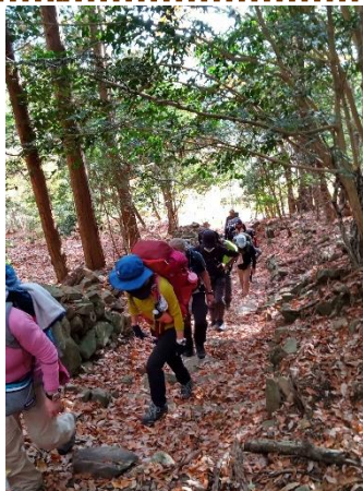
高代寺に向けて汗をかきながら