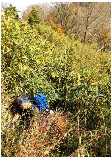
ゴルフ場内を歩くことができず、 背丈のヤブコギで切り抜ける