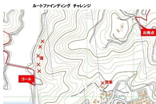
ルートファインディング。コンパ スと地図で悪戦苦闘