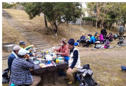
ハラペコで待ちに待った納山会