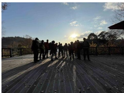
納会終わって知明湖畔まで下山