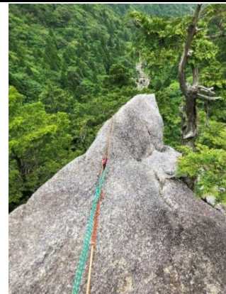
P7上部から懸垂下降 少しトラバースの移動あり