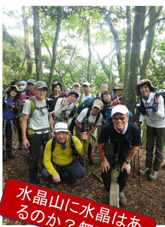
水晶山に水晶はあるのか？無いな。