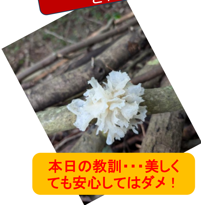
本日の教訓・・・美しくても安心してはダメ！