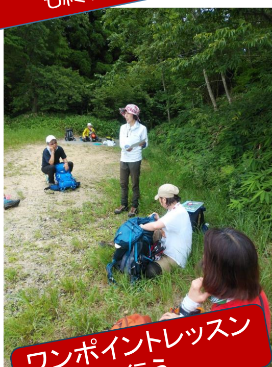
ワンポイントレッスンを 行う。