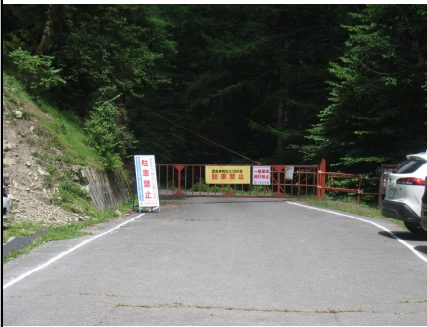
鳥倉第1駐車場(林道ゲート)

いつものJR川西池田駅を5:30出発するも大阪近郊の渋滞に遭遇し予定より遅れる。なんとか第1駐車場に駐車(残3台)することができた。ゲートから登山口まで小一時間を要する(車に自転車を積んで利用している登山者も見受けられた)。初日のテント場は平日であった為、がら空きであったが、塩見岳ピストンでテント場に帰った二日目(土曜)は、満席であった。三日目はゆっくり休んで近辺を散歩し出発する。途中、松川IC近くの町営の温泉でひと汗流し、メイメイ美味しい食事を味わった。眠気と戦いながら交代で運転、連休であったが少しの渋滞に合うだけで帰宅できた。(R.T)