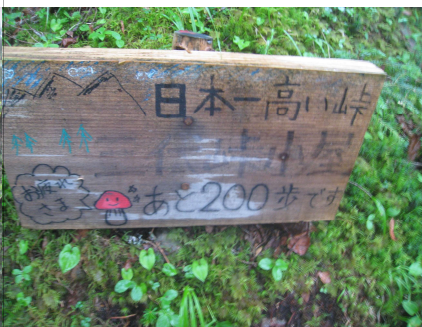
日本一高い峠らしいです?