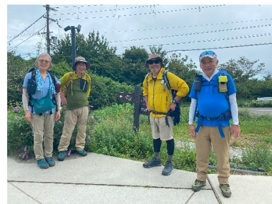
これから有馬温泉に降ります