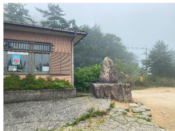
筆者Nはバテバテの状態で一軒茶屋