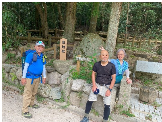
有馬温泉到着② お疲れ様でした！