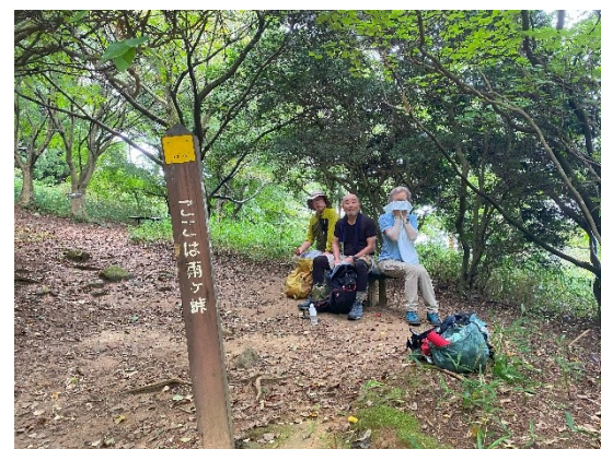
ようやく雨ヶ峠。足が前へ出なくなってきた