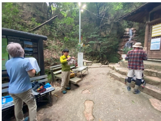
まずは高座の滝。もう汗だく状態