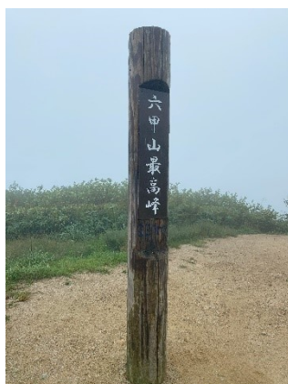
もちろんバテバテ状態。やっと終わった！