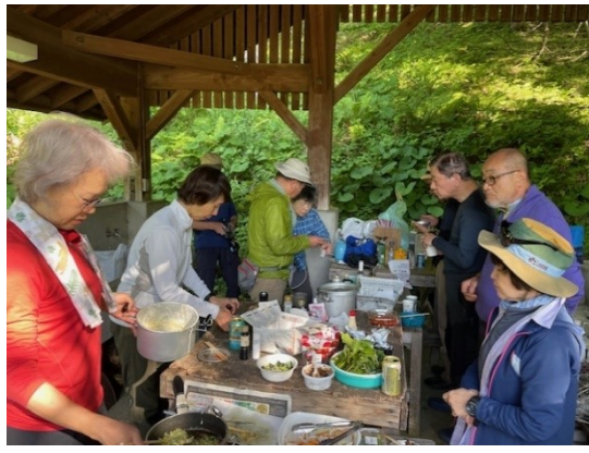
8. 夕食は山菜のてんぷら