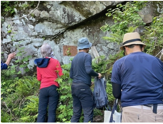
7. 山仲間の慰霊碑に合掌