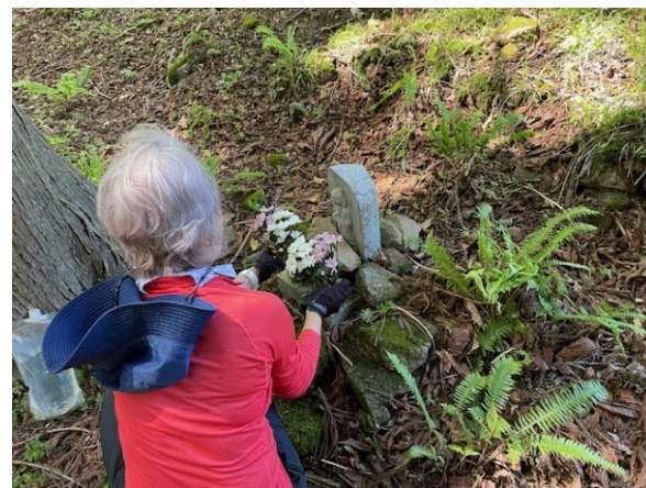
6. 遭難現場のお地蔵様に花を供える