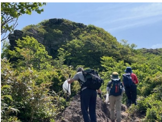
16. 氷ノ山頂上前の甑岩に向かって