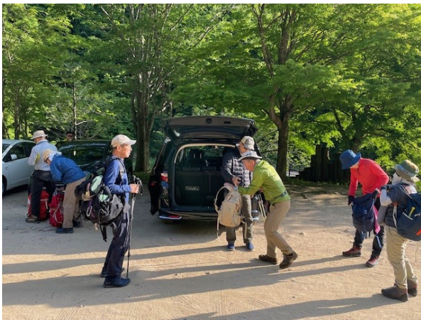
10. クルマで親水公園に送ってもらいました