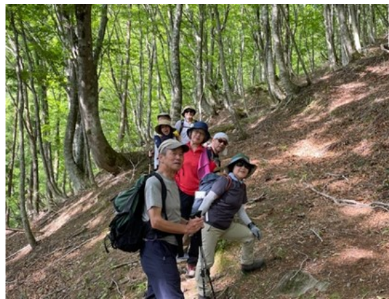
14. 木立の中で記念撮影