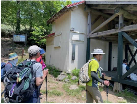
19. 神大ヒュッテに到着