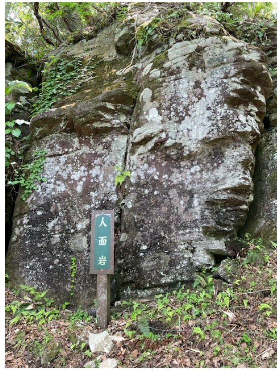
20. 人面岩 どこが目でどこが鼻か？