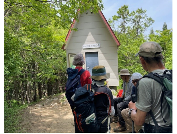
21. 東尾根避難小屋から一路下山