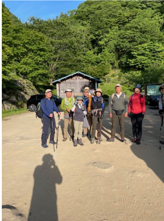
11. 出発前の記念撮影