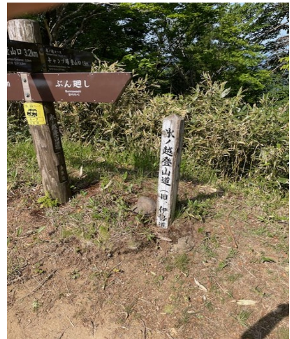
15. 氷ノ山越 鳥取から伊勢に続く道