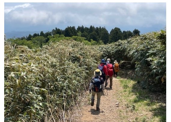
18. 根曲がり竹を採りながら