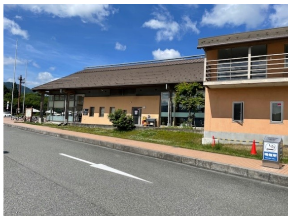
1. まほろばの郷で山菜を仕入れる