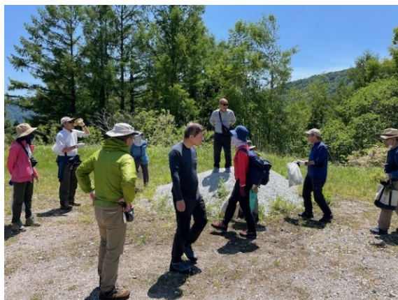
2. ハチ高原スキー場に山菜とり開始