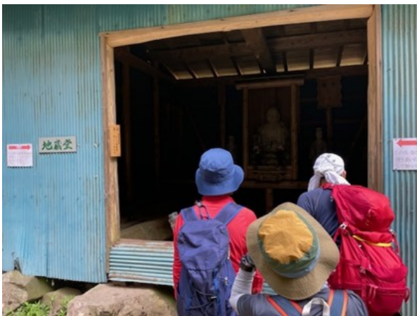
13. 地藏堂 中に地藏菩薩の木造がある