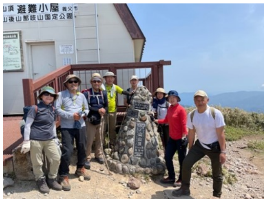
17. 氷ノ山頂上で記念撮影