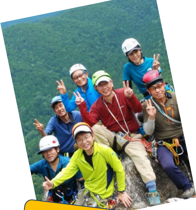
Y懸の頭にて。 つい笑みがこぼれますね。