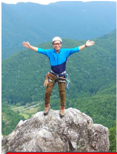
お誕生日、最高のプレゼント！